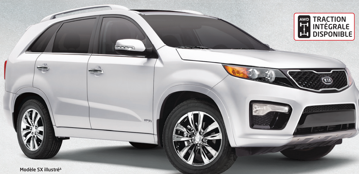
Modèle SX illustré a