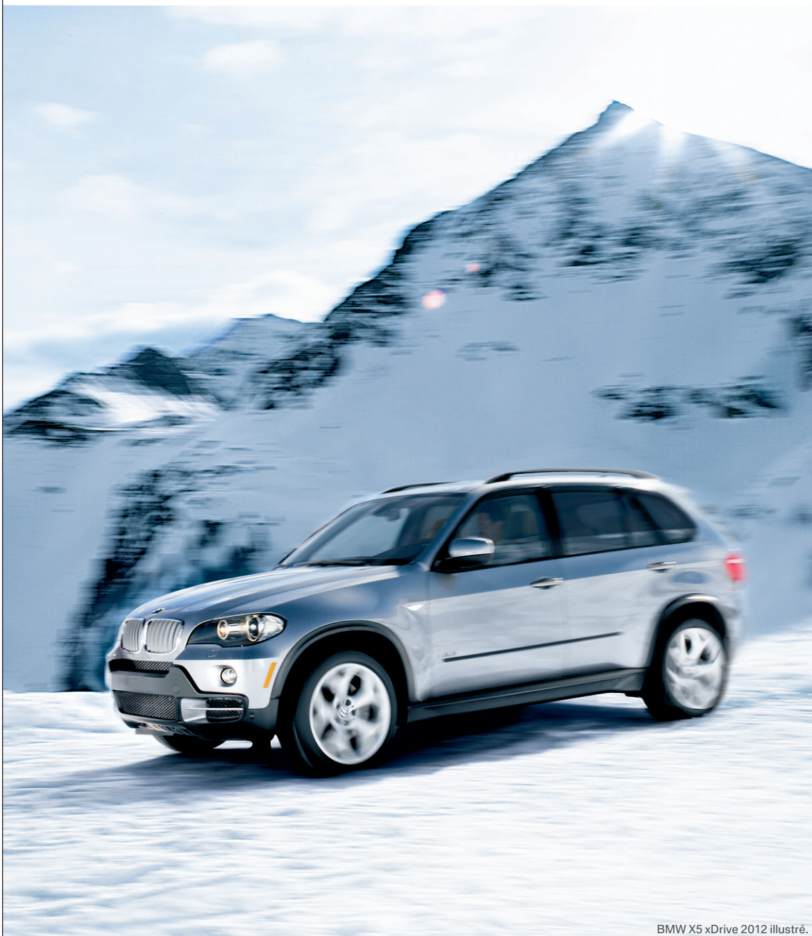
BMW X5 xDrive 2012 illustré.