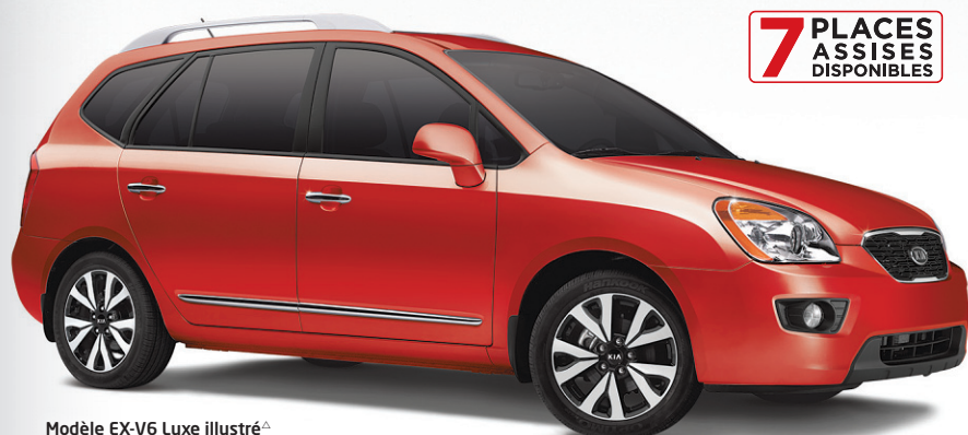
Modèle EX-V6 Luxe illustré a

Paiements aux deux semaines durant 84 mois. Acompte de 1 500 $. L'offre comprend les frais de transport et préparation et autres frais totalisant 1 765 $, la BORDÉE D'ÉCONOMIES DE 1 000 $* et des ÉCONOMIES DE 500 $ SUR LE FINANCEMENT yy . Offre basée sur le prix d'achat de 31 260 $ du modèle Sorento 3,5 L LX-V6 BA 2RM 2013.