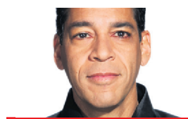
RICHARD HÉTU COLLABORATION SPÉCIALE

Dominique Strauss-Kahn, accusé par Nafissatou Diallo de l'avoir contrainte à une fellation, a tout au plus reconnu, lors d'une entrevue télévisée, une brève relation sexuelle «inappropriée».