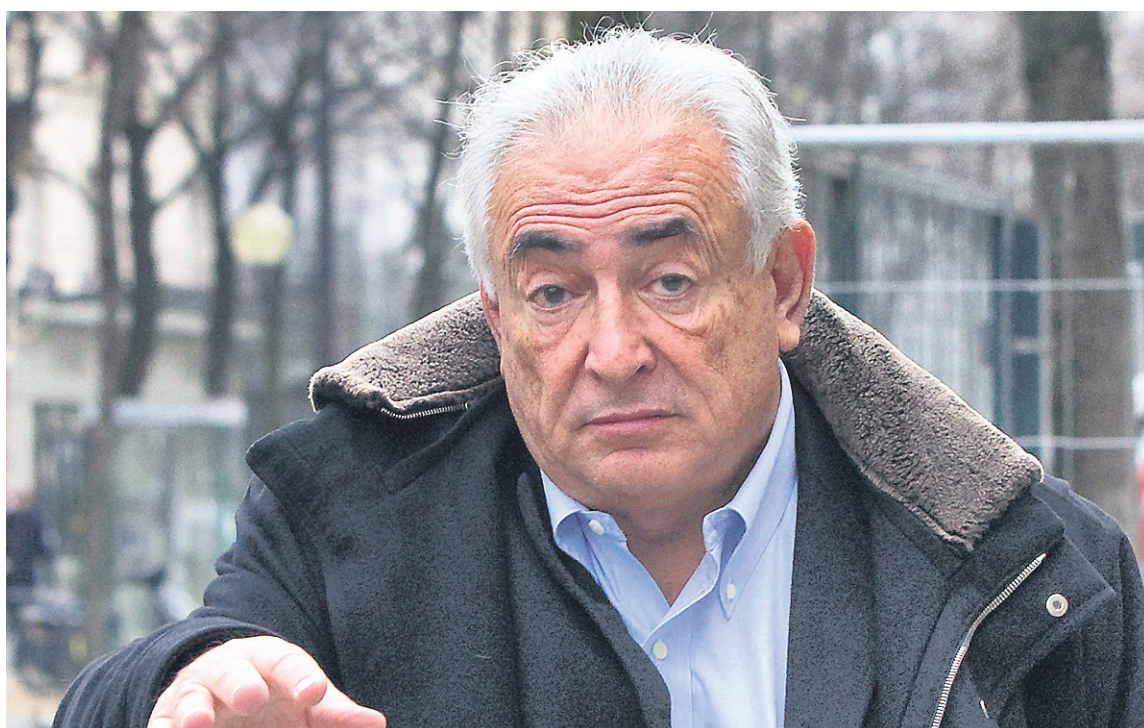
L'ex-directeur général du FMI Dominique Strauss-Kahn.

«C'est déjà fini», a aussitôt écrit sur Twitter la correspondante du Figaro , qui faisait partie des dizaines de journalistes venus assister à l'épilogue d'un feuilleton judiciaire qui a peut-être coûté la présidence française à DSK.