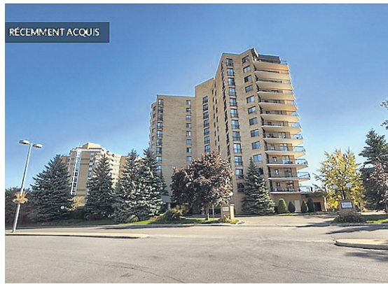
L'immeuble est situé au 4500, promenade Paton.

Gilles Vaillancourt, ex-maire de Laval, a acheté un condo de luxe malgré les saisies d'argent dont il a fait l'objet.