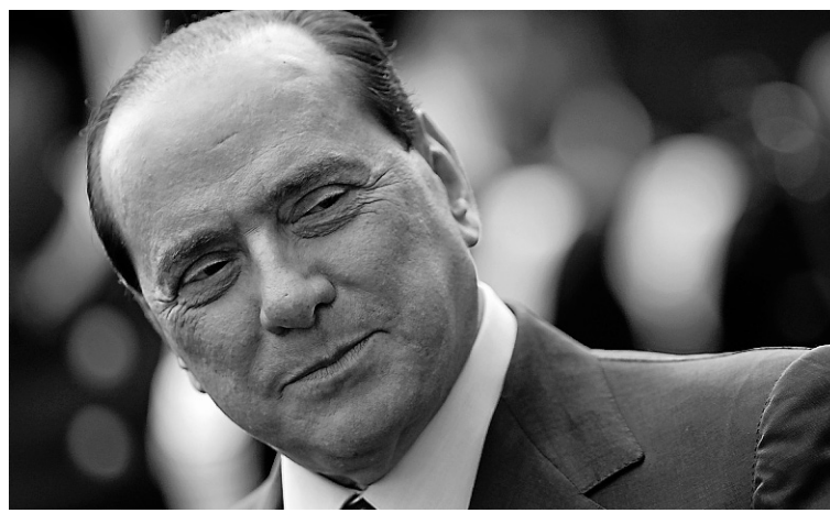
Selon un sondage, 73 % des électeurs italiens désapprouvent la sortie de retraite de Silvio Berlusconi.