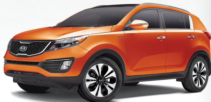
Modèle SX illustré a

L'offre comprend les frais de transport et préparation et autres frais totalisant 1 765 $, des ÉCONOMIES EN ARGENT DE 5 250 $ , la contribution du concessionnaire de 11 $ et la BORDÉE D'ÉCONOMIES DE 1 000 $* . Offre basée sur le prix d'achat de 22 760 $ et les caractéristiques de série du modèle Rondo LX 2012 avec climatiseur.