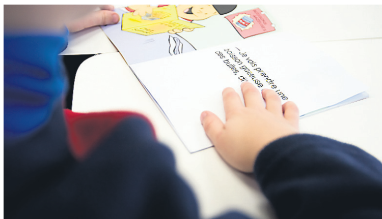
Autre élément qui ressorte de l'étude: les enfants qui fréquentent le réseau scolaire francophone lisent moins bien que ceux qui étudient en anglais.

Le Québec arrive pour sa part au 21 e rang. Moins d'un élève sur deux atteint un seuil élevé et 85 %, un seuil intermédiaire. Le niveau de lecture