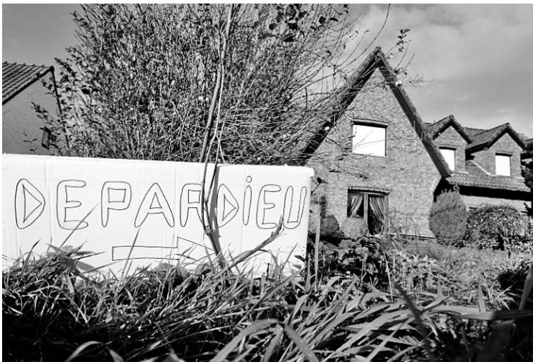
Une affiche géante indiquant où se trouve la maison de l'acteur a été installée dans le village belge de Nechin.

« Obélix a bien changé », a ironisé la présidente du Front national, Marine Le Pen, qui accuse les riches Français comme Gérard Depardieu de vouloir se soustraire à leurs