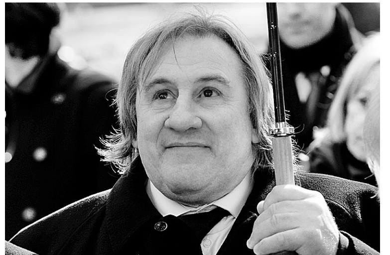
Gérard Depardieu esquivera la décision du gouvernement français qui prévoit l'imposition à 75 % des revenus supérieurs à 1 million d'euros.

Ce n'est pas la première fois qu'un artiste de renom