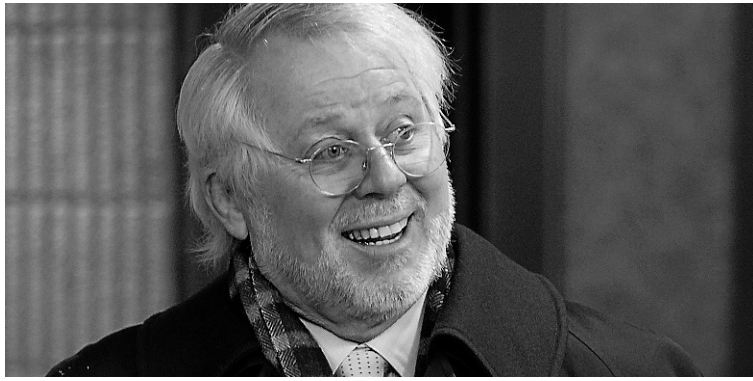
L'homme qui a inspiré le film L'initié , Jeffrey Wigand.

Selon le témoin-vedette, les fabricants de tabac n'ont pas révélé plusieurs informations au public concernant la cigarette, comme la possibilité de contracter le cancer du poumon, du larynx ou de la gorge. « Brown & Williamson soutenait tout le contraire: que la nicotine ne crée pas