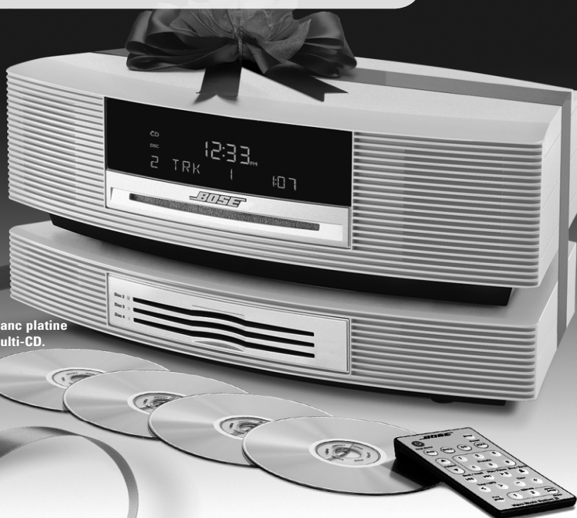
Modèle illustré en blanc platine avec changeur multi-CD.

Les gens l'adoreront encore plus avec le changeur multi-CD. Conçu exclusivement pour le système de musique Wave MD III, le changeur multi-CD en option vous permet de profiter d'un son d'une grande fidélité pendant des heures. Glissez un CD traditionnel ou de MP3 dans le système de musique Wave MD III et trois autres dans le changeur de CD. Les deux vont véritablement de pair. Le système vient également avec une télécommande de la taille d'une carte de crédit qui vous permet d'utiliser toutes les fonctions à distance, y compris le syntoniseur AM/FM numérique, l'horloge et l'alarme. Une manière simple et pratique d'utiliser ce système élégant parfait pour le salon, la cuisine, la chambre ou le bureau.