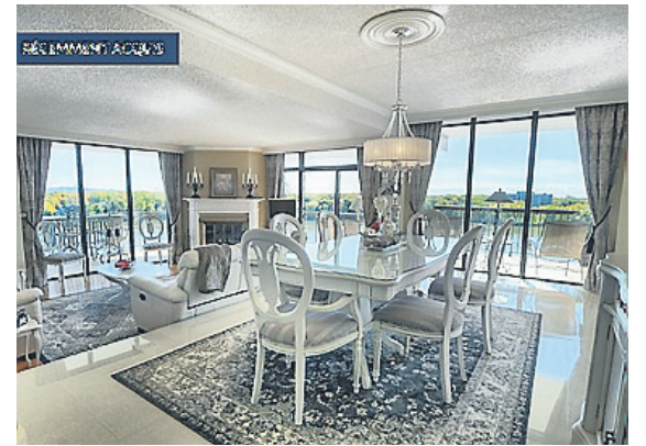
Vue de la salle à manger.