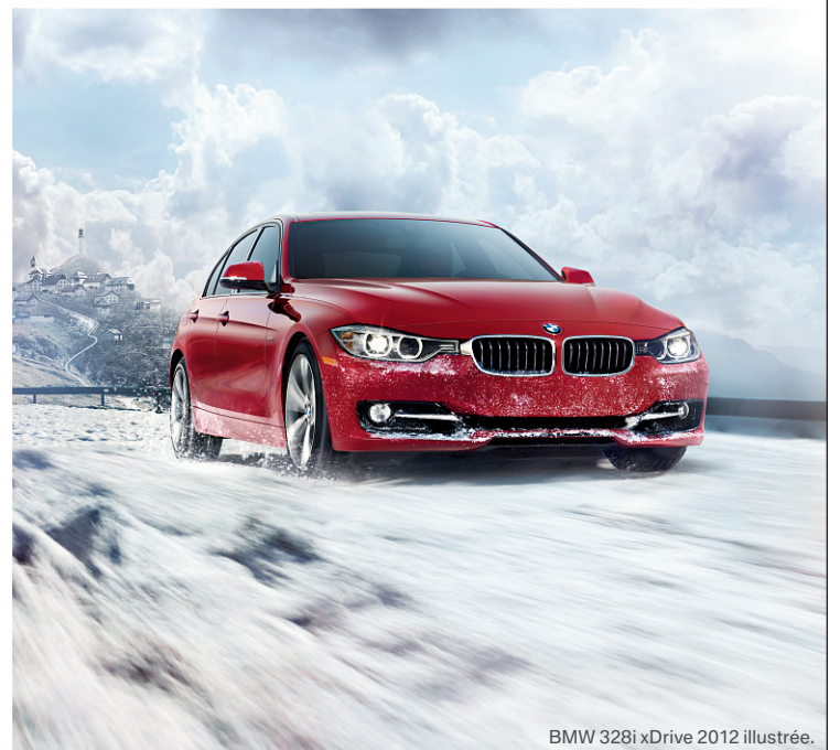
BMW 328i xDrive 2012 illustrée.