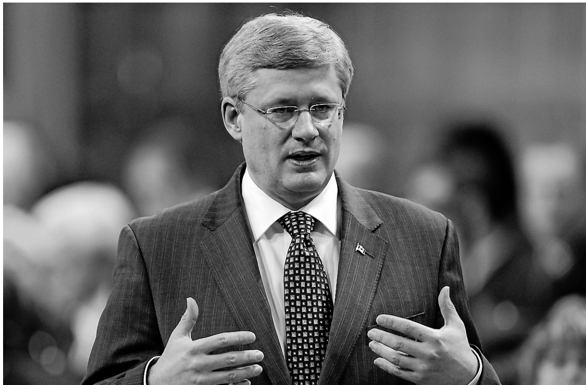
Les conservateurs de Stephen Harper estiment qu'ils subissent « une campagne politique déguisée en procès », selon leur porte-parole.

Mais lors de la première journée du procès, hier, la Cour n'a pas entendu le fond de l'affaire. Le Parti conservateur