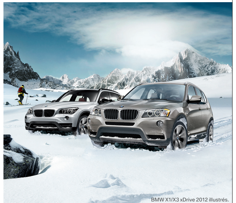
BMW X1/X3 xDrive 2012 illustrés.

Montréal BMW Canbec 4090, rue Jean-Talon Ouest 514.731.7871 bmwcanbec.com