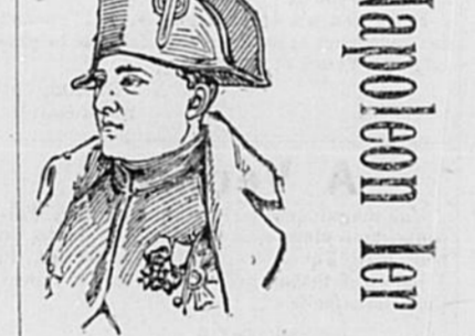
Commencera dans le No. 12

24 Pages de Gravures 5c. le Numéro. $2.50 par an. Livré à domicile