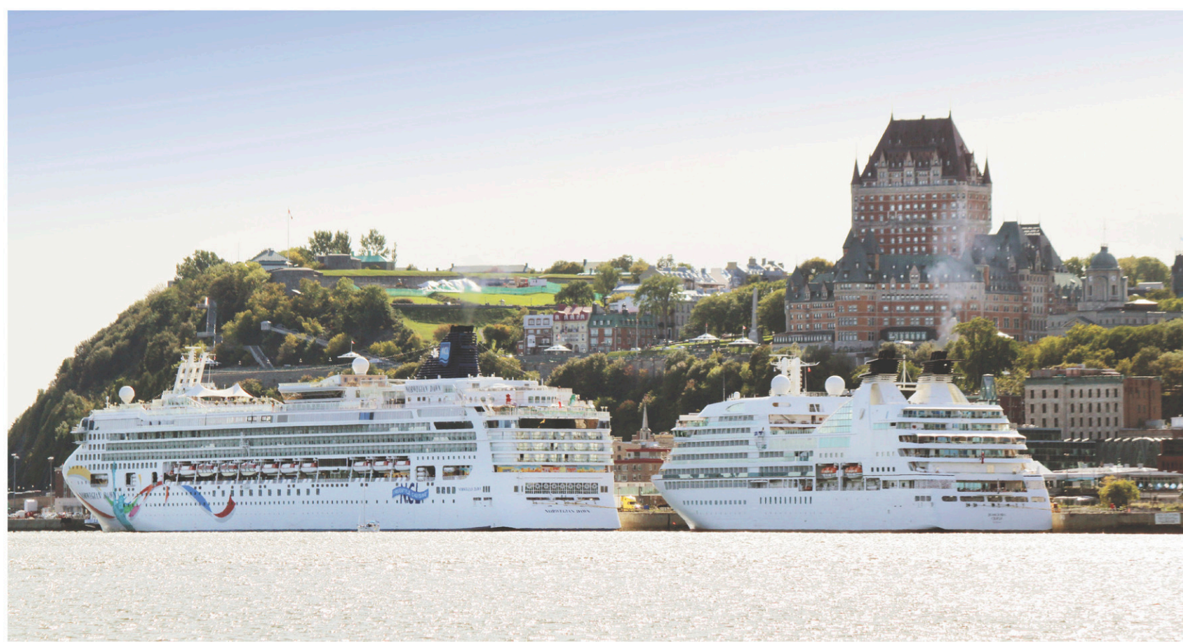
Le port de Québec est situé en territoire fédéral.

La Cour suprême a confirmé l'effectivité des lois canadiennes lorsqu'elles sont appliquées à des activités se déroulant sur Internet. Désormais, l'application des lois canadiennes dépend uniquement de la volonté politique d'appliquer des politiques cohérentes. L'alibi de « l'impossibilité d'intervenir sur Internet » n'est plus possible. Il ne manque désormais que la volonté et le courage pour appliquer des politiques numériques cohérentes.