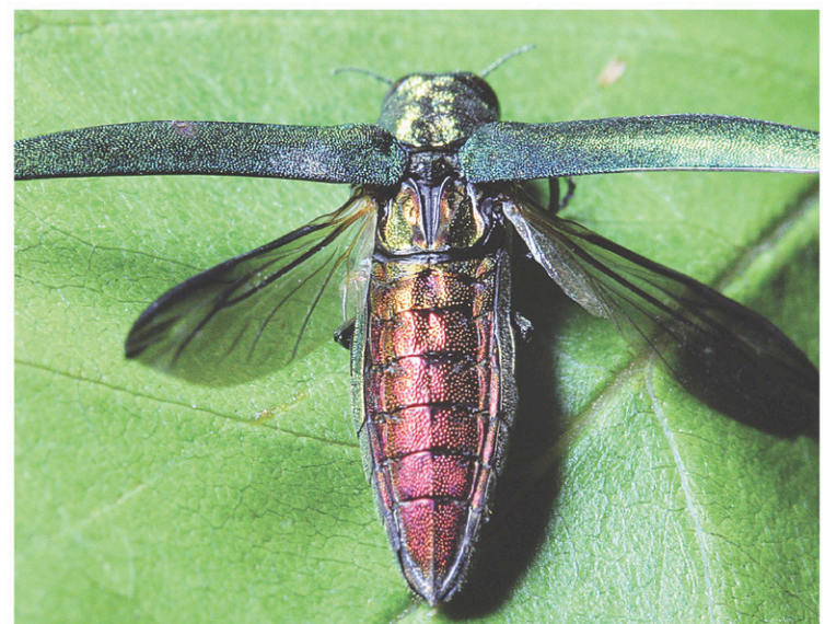
VILLE DE MONTRÉAL

Originaire d'Asie, l'agrile a été localisé pour la première fois au Canada en 2002. Il est présent dans la grande région de Montréal depuis 2011 et dans l'Outaouais depuis 2010.