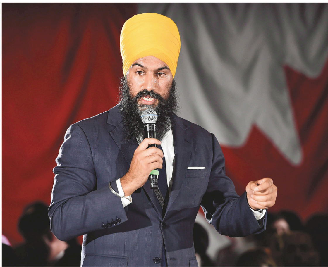
NATHAN DENETTE LA PRESSE CANADIENNE

Pour M. Dionne Labelle, ces deux exemples posent problème. « Si sa religion commence déjà à influencer ses intentions parlementaires, ça ne