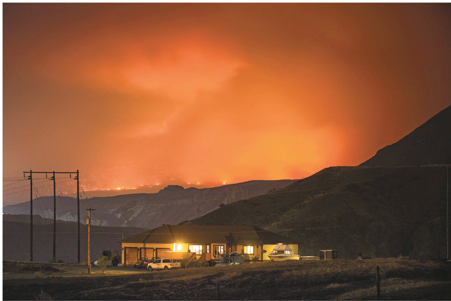
Un incendie de forêt faisait rage tôt lundi matin derrière une montagne à l'est de Cache Creek, en Colombie-Britannique.