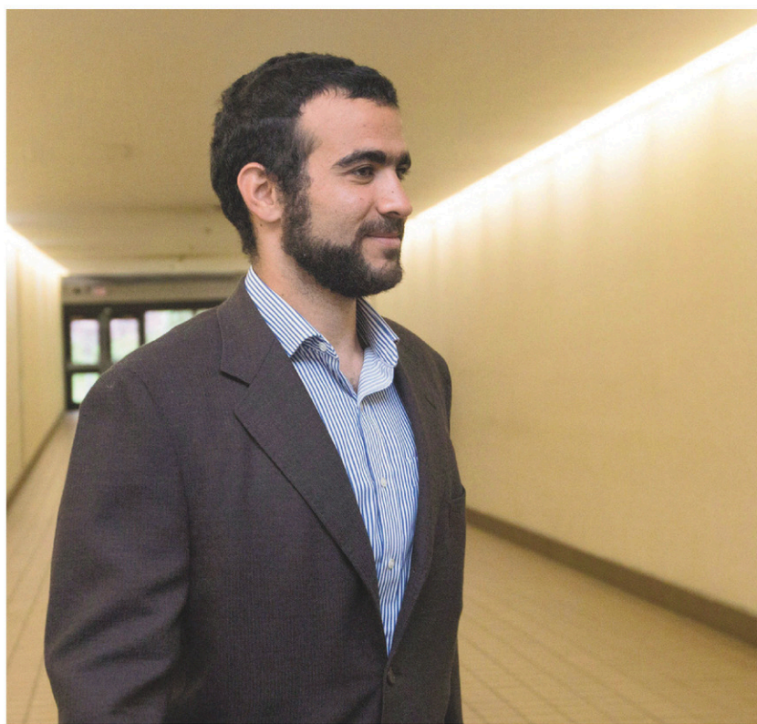
Omar Khadr a obtenu des excuses et 10,5 millions de dollars du gouvernement fédéral en reconnaissance de la violation de ses droits.

«Ils n'ont pas le droit de le faire et ça n'aurait pas dû être fait, on s'entend. Mais le problème, c'est que lui non plus [Omar Khadr] n'avait pas à le faire [le geste qu'il a été accusé d'avoir posé sur le champ de bataille afghan]», a tranché M. Paul-Hus.