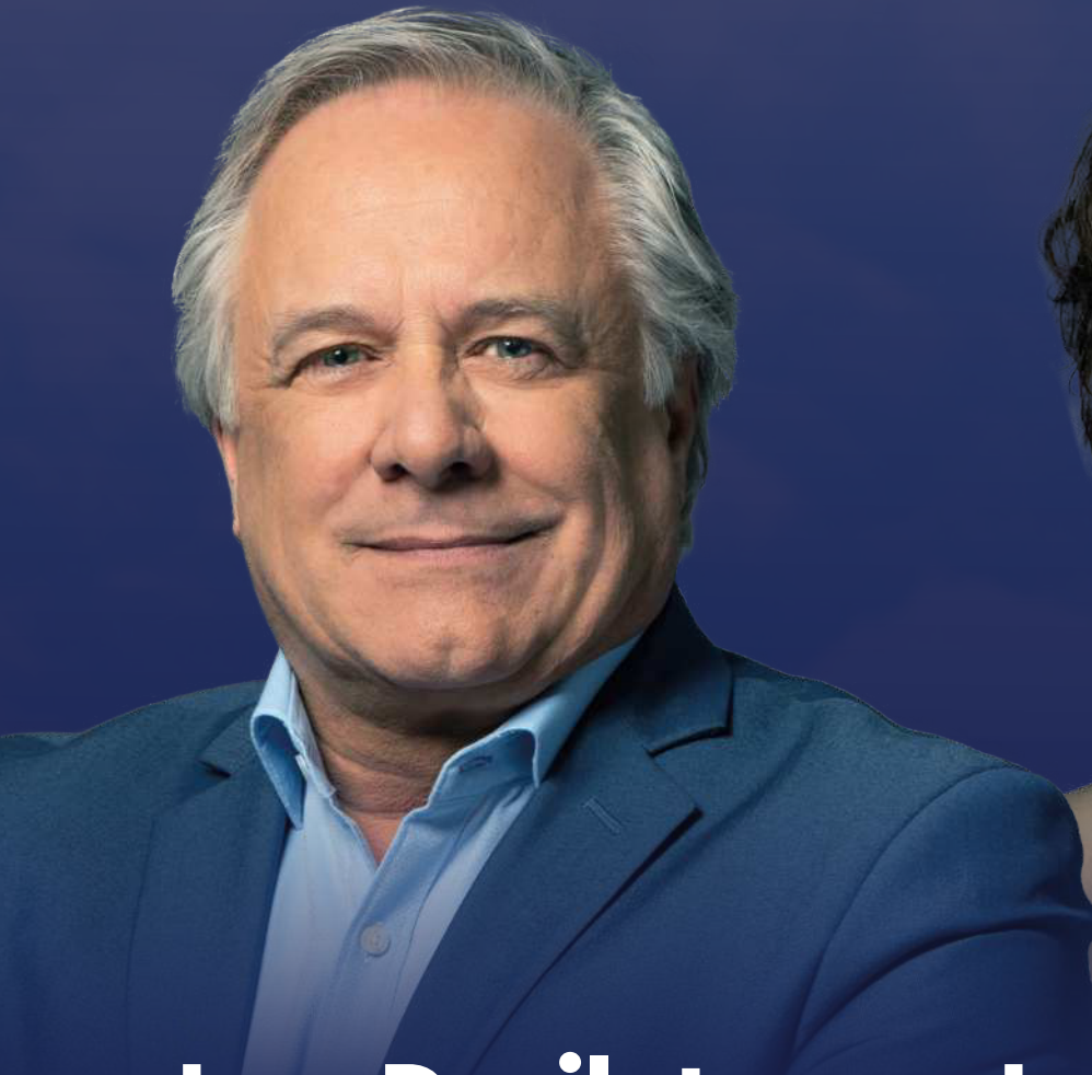
Luc Desilets Député de Rivière-des-Mille-Îles