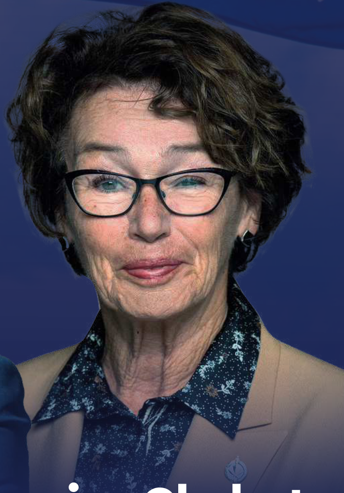
Louise Chabot Députée de Thérèse-De Blainville