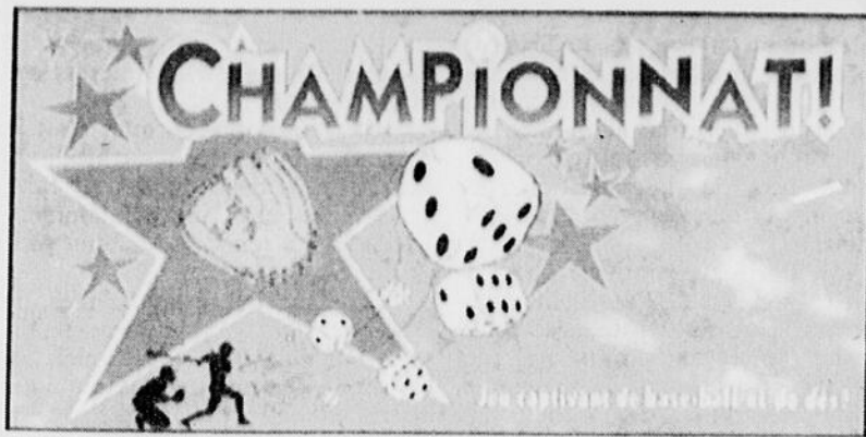
Le jeu «Championnat» est de conception et fabrication québécoise.