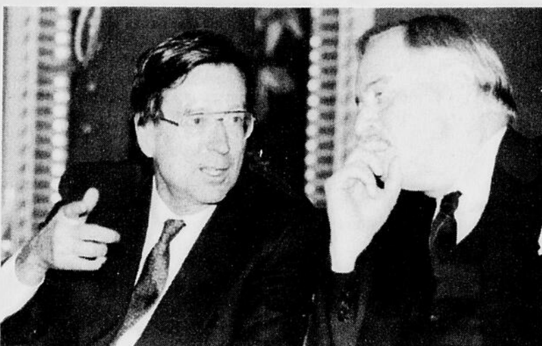
Robert Bourassa et Jacques Parizeau ont fait un brin de causette à la cérémonie soulignant le bicentenaire.

«Actuellement, la vente pure et simple de notre investissement dans Univa n'est pas envisagée. Toutefois, d'autres options existent et sont explorées, dont l'inclusion de nouveaux associés au sein du groupe d'actionnaires principaux d'Univa.»