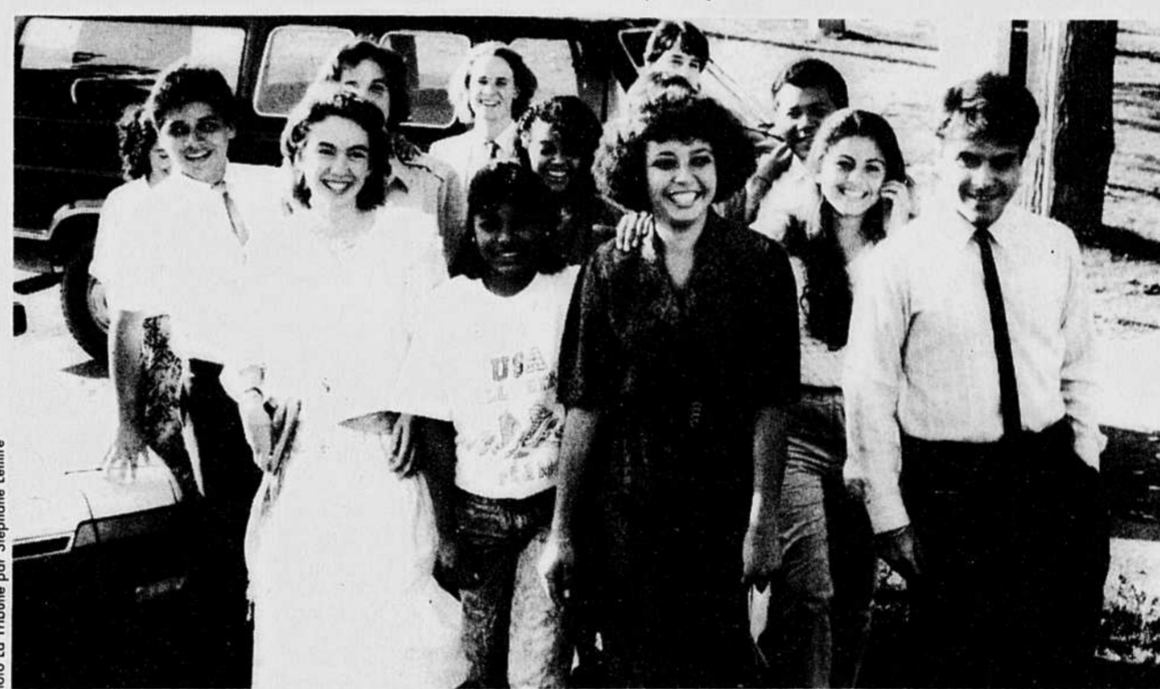
Sept Latino-Américains et sept Canadiens étudieront le coopératisme à travers un stage de trois mois dans divers organismes d'action communautaire de Sherbrooke.

La Ville de Sherbrooke leur a organisé une petite cérémonie de bienvenue et une tournée des environs. Au cours de leur séjour, ces étudiants auront droit à toutes les installations sportives de la Ville de façon gratuite.