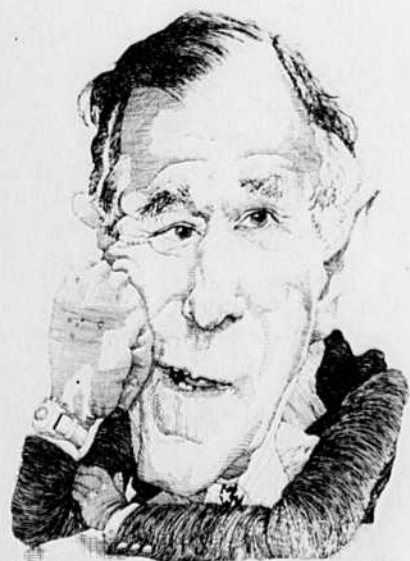
Le président Bush