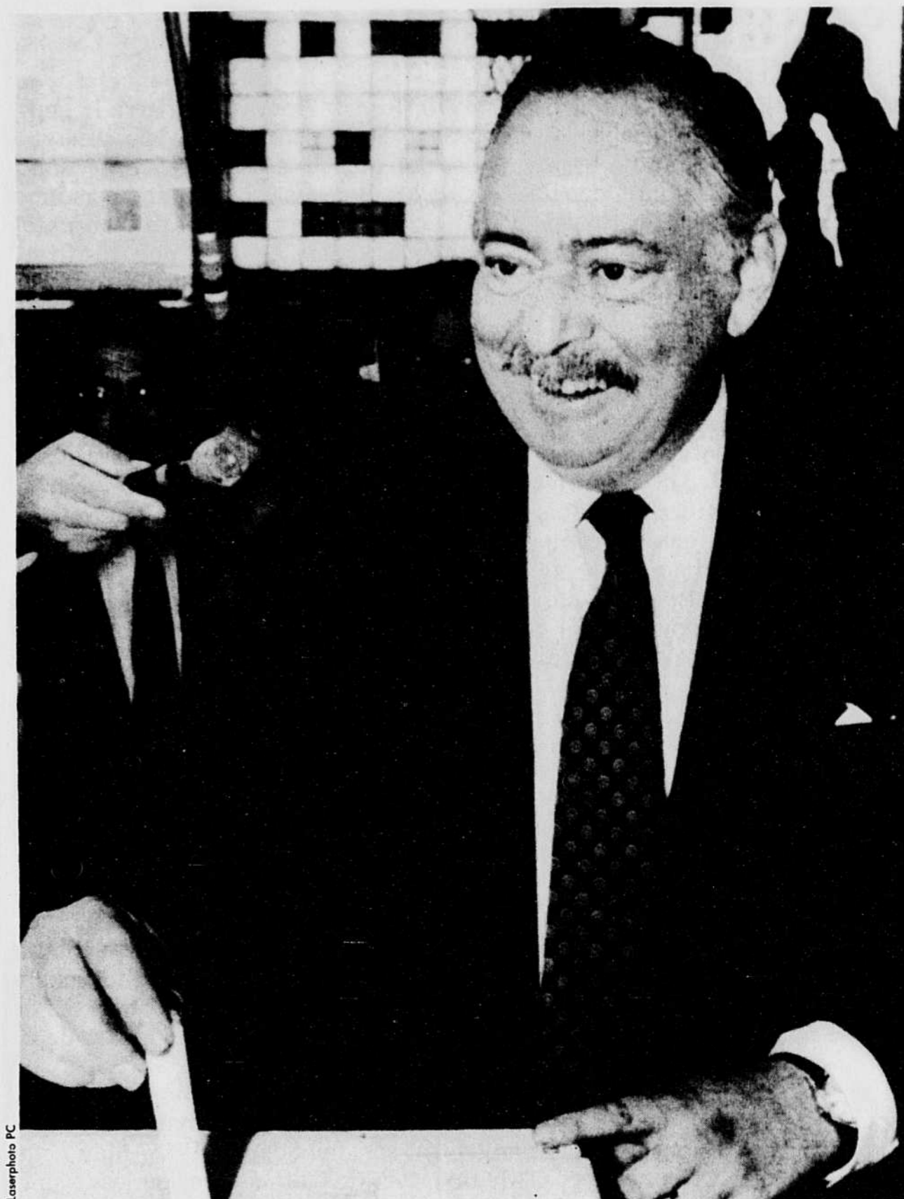
Le chef du Parti québécois, Jacques Parizeau, a déposé hier matin son bulletin de vote dans la circonscription d'Outremont, où il réside. M. Parizeau a été élu dans le comté de l'Assomption par 5000 voix de majorité.