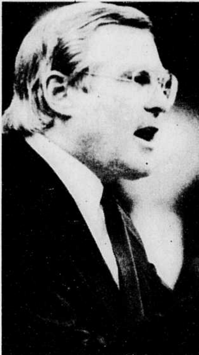
Le ministre des Finances, Michael Wilson

Ils ont entrepris un jeûne de quelques jours, et prévoient se faire relayer par un autre groupe pour poursuivre la vigile.