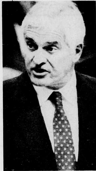
Le chef libéral John Turner

teur a fait paraître dans les journaux canadiens à la fin du mois d'août.