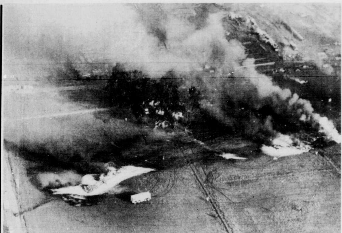
L'écrasement du bombardier B-52 a tracé un chemin de fer et de feu dans ce champ près de Sacramento.