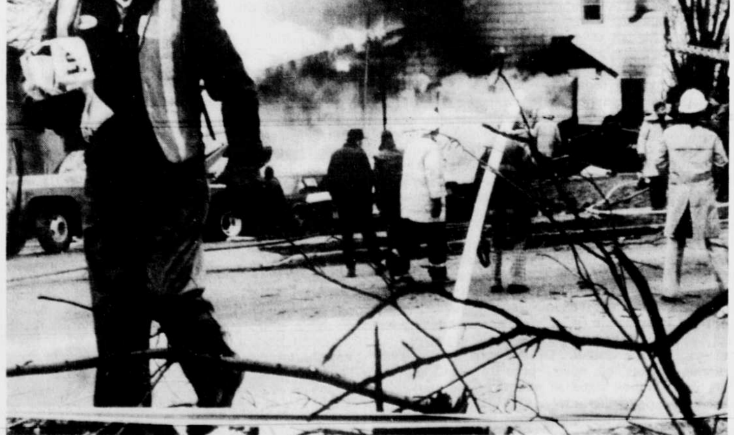
Les sauveteurs s'affairent autour de la librairie dans laquelle est venu atterrir le bimoteur Cessna, faisant au moins six morts, à Montgomery.

En raison du violent incendie qui s'est déclaré après l'écrasement de l'avion, les sauveteurs se trouvent dans l'impossibilité de dire si l'accident a fait des victimes dans le magasin. Ils précisent seulement que plusieurs personnes ont été conduites dans divers hôpitaux de la région.