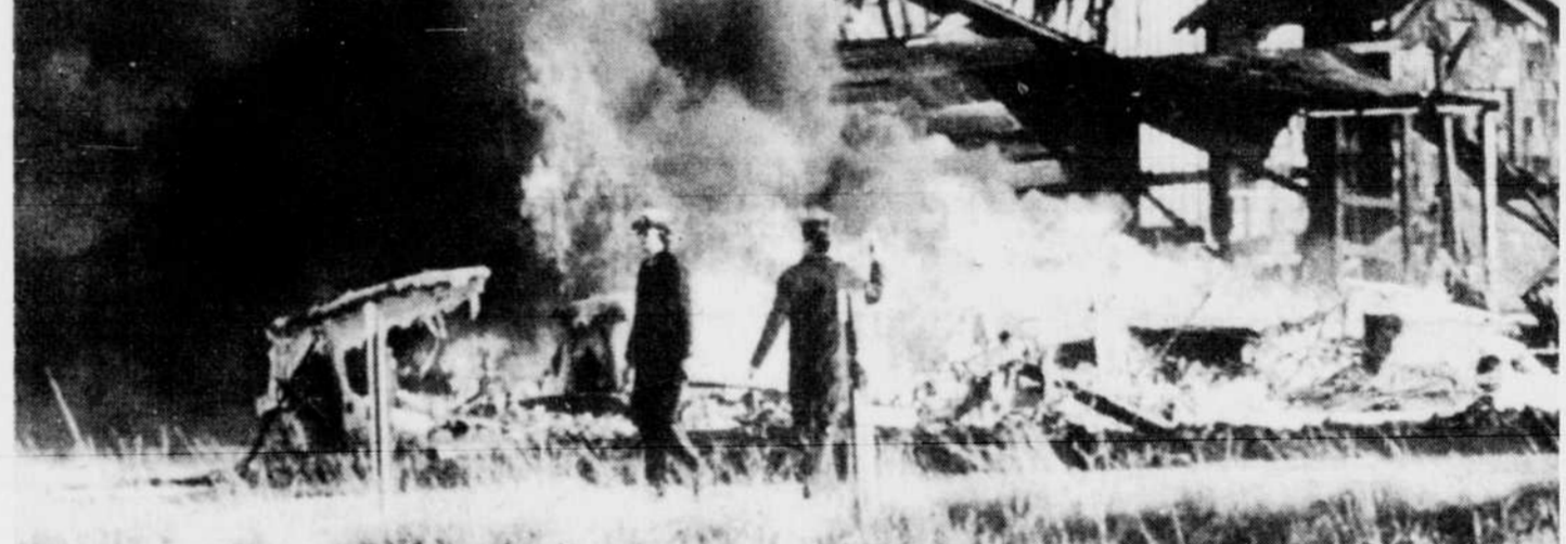
Les débris du B-52 en flammes n'ont atteint aucune maison et seuls les membres de l'équipage ont été tués.

Les causes de l'accident ne sont pas encore connues.