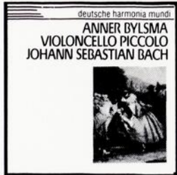
J.S. BACH Bylsma

...et plusieurs autres sélections sur disque compact seulement