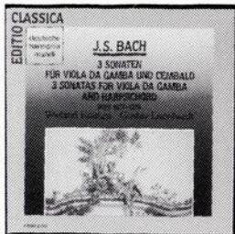
J.S. BACH Kuijken, Leonhardt