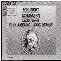
SCHUBERT, SCHUMANN Lieder Ameling/Demus