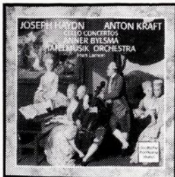
HAYDN, KRAFT Tafelmusik Lamon