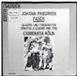
FASCH Camerata Köln