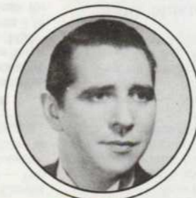
Richard Verreau Sans doute le plus connu de nos chanteurs, il a été acclamé en Italie, en Autriche, en France, aux États-Unis et en URSS.