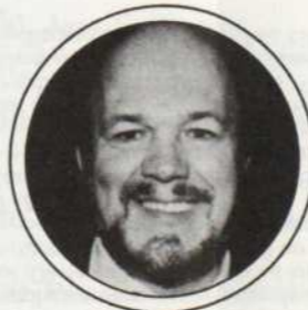
Louis Quilico Le grand baryton de l'heure: Metropolitan, Bolchoï, Opéra de Paris, Opéra de Vienne, Covent Garden.