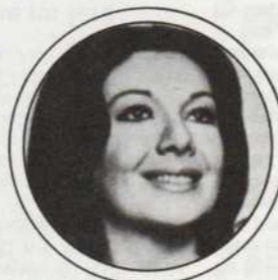
Huguette Tourangeau Elle s'est acquise une réputation mondiale grâce à ses enregistrements avec Joan Sutherland.