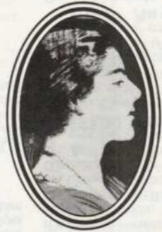
Eva Gauthier (1885-1958) Spécialiste de la musique contemporaine, elle la défendit partout dans le monde.