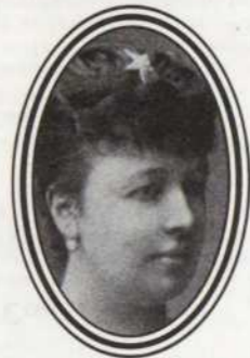
Emma Albani (1847-1930) La plus grande gloire canadienne de l'opéra et du concert. Elle chanta durant 24 ans à Covent Garden.