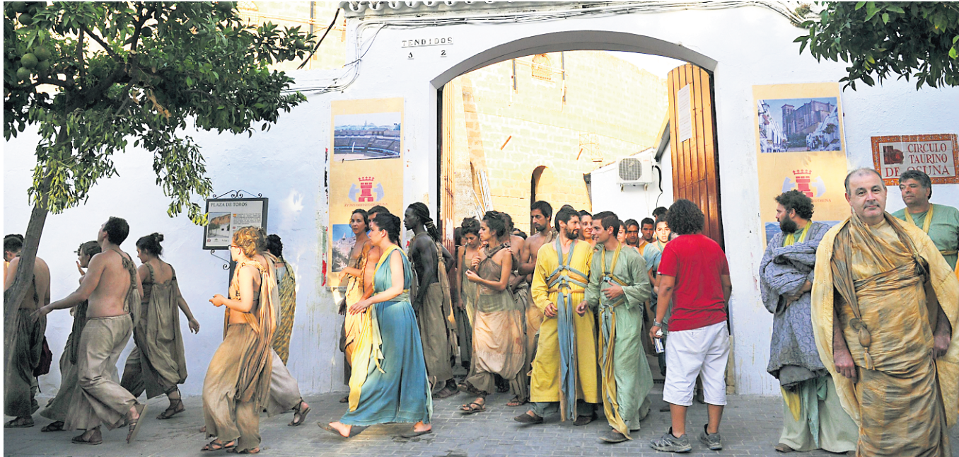
Des figurants de la série Game of Thrones quittent l'arène de taureau d'Osuna où une scène a été tournée.