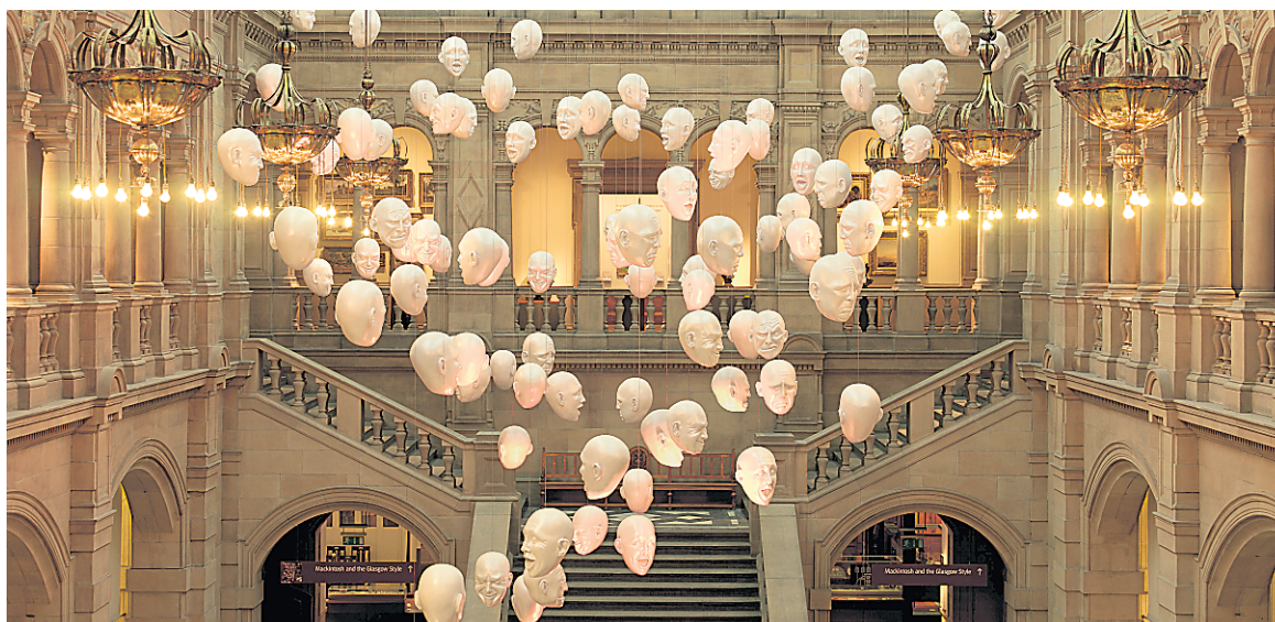
L'un des plus imposants musées de la ville (22 galeries et 8000 artefacts), le Kelvingrove, est l'endroit tout désigné pour s'initier aux grands maîtres écossais.

Les frais de voyage de ce reportage ont été payés par Glasgow City Marketing Bureau. Info : peoplemakeglasgow.ca