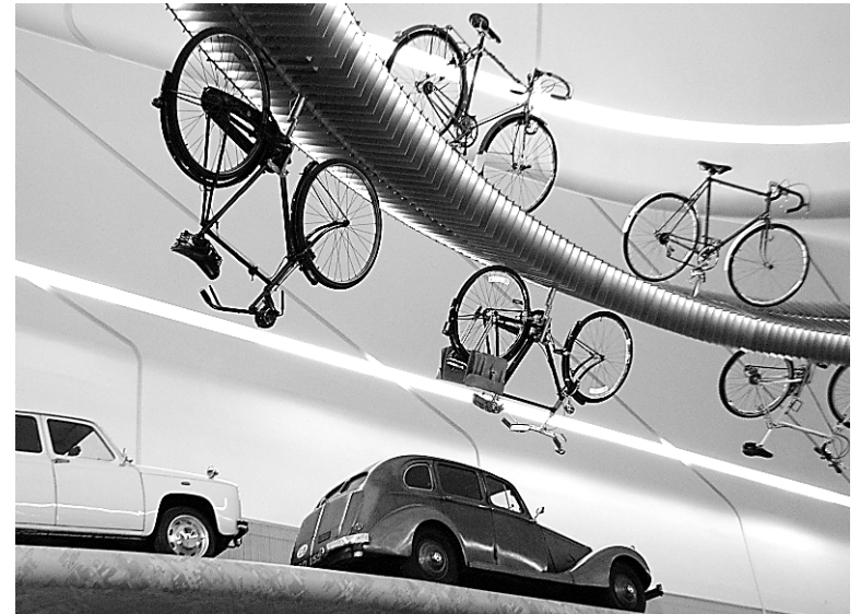
Le musée Riverside accueille les dizaines de voitures, tramways, autobus et autres machins à moteur inventés par l'homme depuis plus d'un siècle.

C'est l'heure du thé : après avoir admiré l'extérieur des édifices dessinés par MacKintosh, découvrez son travail de designer en allant prendre le thé au Willow Tea Room de la rue Sauchiehall, dont il a entièrement supervisé le design intérieur du salon. S'il affiche complet, rabattez-vous sur la succursale de la rue Buchanan, ouverte en 1999, mais qui, à défaut d'avoir été dessinée par le maître, en respecte le style dans ses moindres détails. 217, Sauchiehall Street 97, Buchanan Street www.willowtearooms.co.uk/the-willow-sauchiehall-st