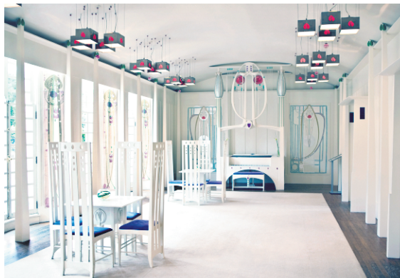
La «Maison pour un amateur d'art» de Charles Rennie MacKintosh