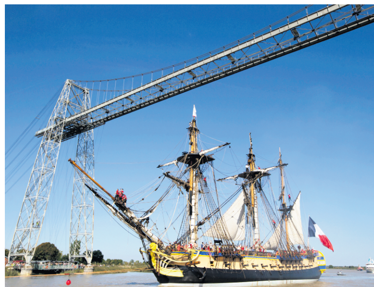
Dès le 11 novembre et jusqu'au 31 décembre, il sera possible d'admirer l'intégralité de L'Hermione en visite libre ou guidée à Rochefort.