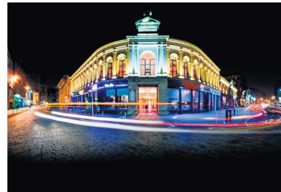
Le cœur historique de Glasgow, Merchant City