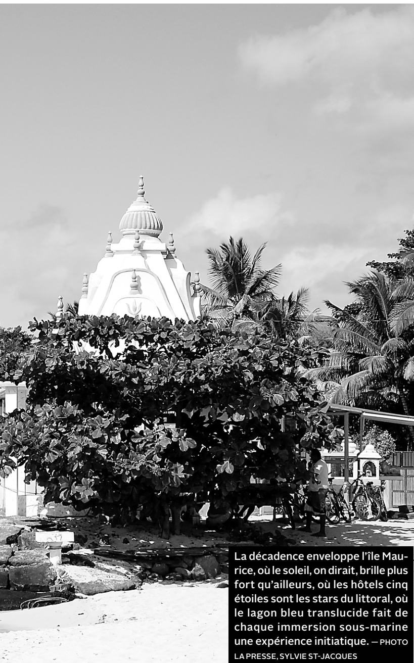
La décadence enveloppe l'île Maurice, où le soleil, on dirait, brille plus fort qu'ailleurs, où les hôtels cinq étoiles sont les stars du littoral, où le lagon bleu translucide fait de chaque immersion sous-marine une expérience initiatique.

Certes, quand la civilisation avance, la forêt recule... Mais à travers les branches des cilaos, on chuchote que l'argent ne coule plus à aussi grands flots autour des piscines à débordement du littoral.