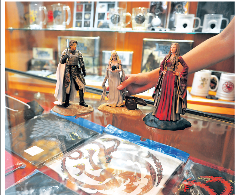
Les figurines de la série Game of Thrones commencent à faire leur apparition dans la ville d'Osuna, tout comme le personnage Daenerys Targaryen au Musée d'Osune.