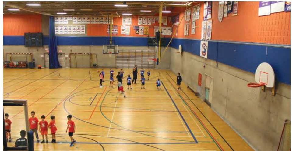
Les gymnases de l'école secondaire du Mont-Bruno, dont le gymnase double, permettent de combler les besoins des associations sportives pour l'instant.