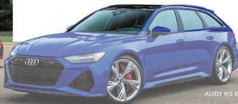
AUDI RS 6 2021