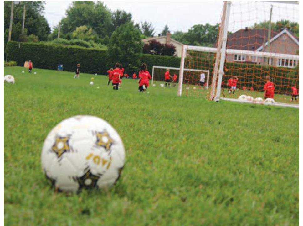
Le projet de centre intérieur de soccer attend le complexe multisport pour être relancé.

Il confirme que son club va bien, et même si les relents de la pandémie sont encore présents quant au nombre d'inscriptions, ils se dissipent. « Nous