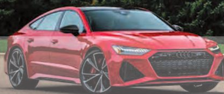
AUDI RS 7 2021