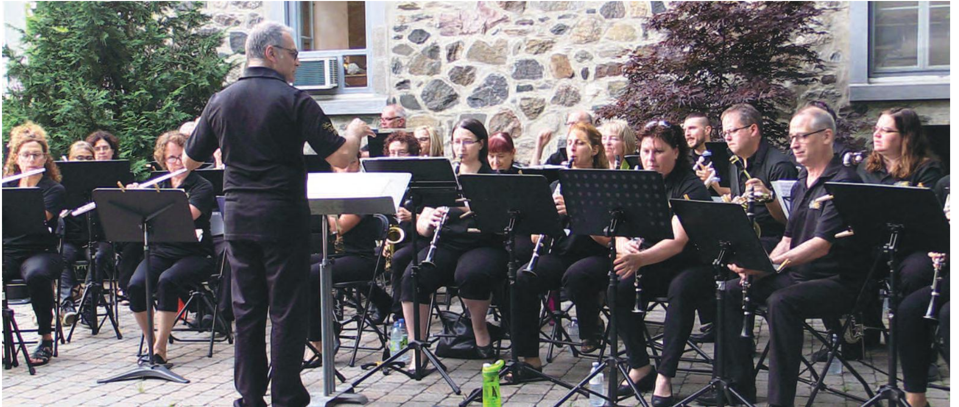
Les musiciens de l'Harmonie Mont-Bruno se produiront au Vieux Presbytère.

À Saint-Bruno, la saison estivale est synonyme de spectacles extérieurs gratuits. Neuf événements sont prévus entre le 3 juillet et le 27 août, au Vieux Presbytère ainsi qu'à la place du Village.