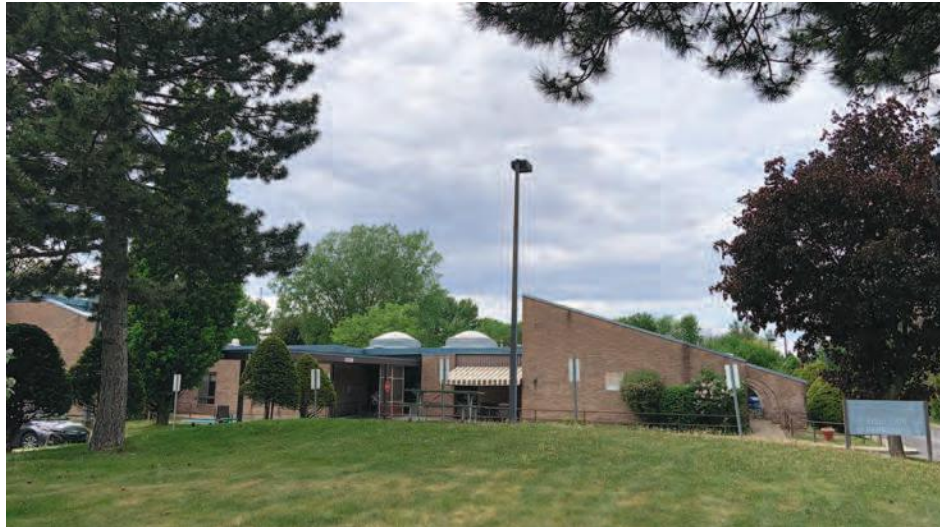
Le CHSLD de Saint-Bruno est en manque criant de personnel. (Photo : archives)

C'est le CISSS qui a répondu au journal. « Notre priorité étant d'offrir des soins et services de qualité à nos résidents, des conseillères cliniques à la direction des soins infirmiers ont été attirées pour soutenir et outiller pendant huit semaines le personnel sur place », a-t-il