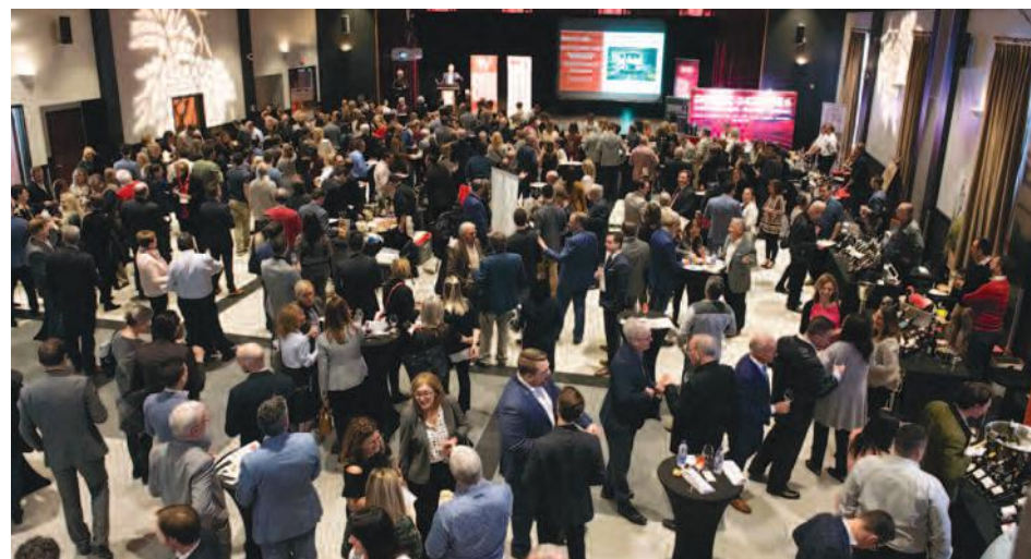
Le 20 e Salon des vins de la Montérégie aura lieu au Centre Marcel-Dulude.

Le Salon des vins de la Montérégie a connu du succès au cours des dernières années. En effet, d'une récolte d'environ 45 000 $ en 2016, il est passé à