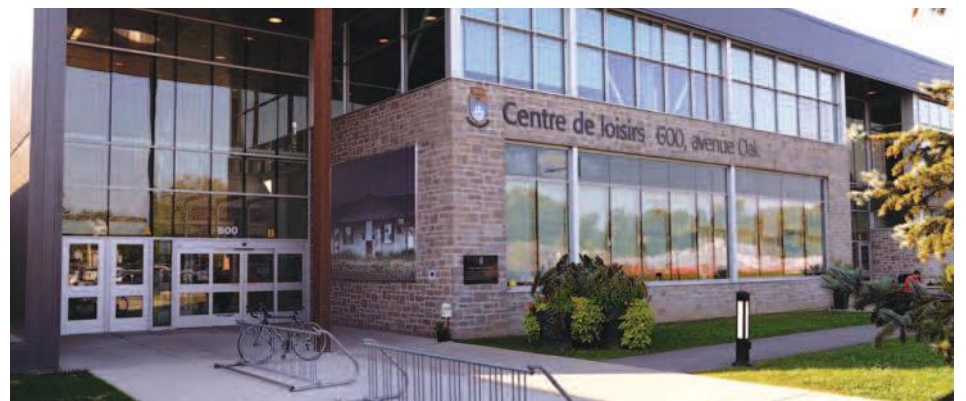
Le centre sportif de Saint-Lambert a été inauguré en 2011.

À Varennes, le Complexe multisport régional (CMR) a été construit dans une