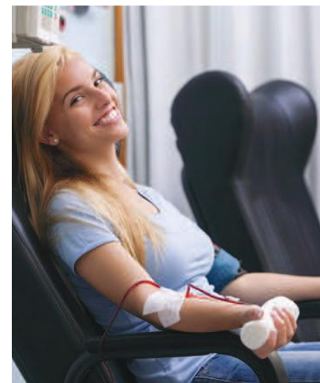
Une collecte de sang se déroule à Saint-Bruno les 8 et 9 juin.

La réponse de la population permettra aux patients malades de recouvrer la