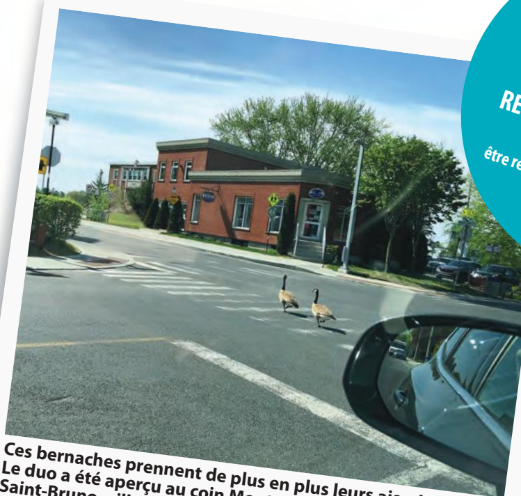
Ces bernaches prennent de plus en plus leurs aises! Le duo a été aperçu au coin Montarville et Seigneural, à Saint-Bruno, ville prioritaire pour les piétons.

FAITES-NOUS PARVENIR VOS PHOTOS À REDACTION@VERSANTS.COM (Les photos publiées peuvent être réutilisées pour illustrer des articles de nos publications.)