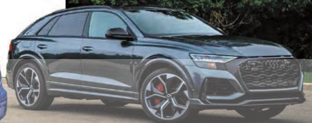
AUDI RS Q8 2021