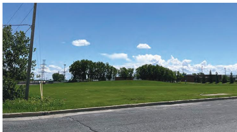
Ce terrain, au parc Marie-Victorin, est ciblé pour le projet de complexe sportif.