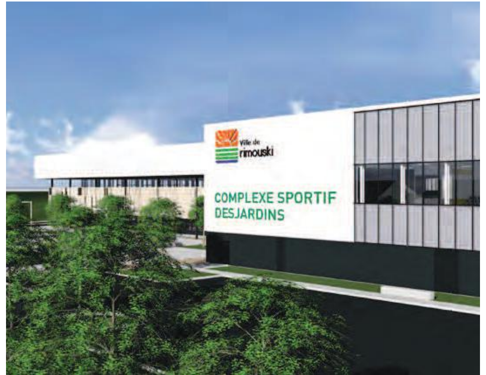
Le complexe sportif de Rimouski porte le nom de son commanditaire, Complexe sportif Desjardins.

Pour le maire, il est peu probable que le complexe multisport, qui a déjà changé de nom à plusieurs reprises bien qu'il n'y ait pas eu encore la première pelle-tée de terre, puisse porter le nom d'une