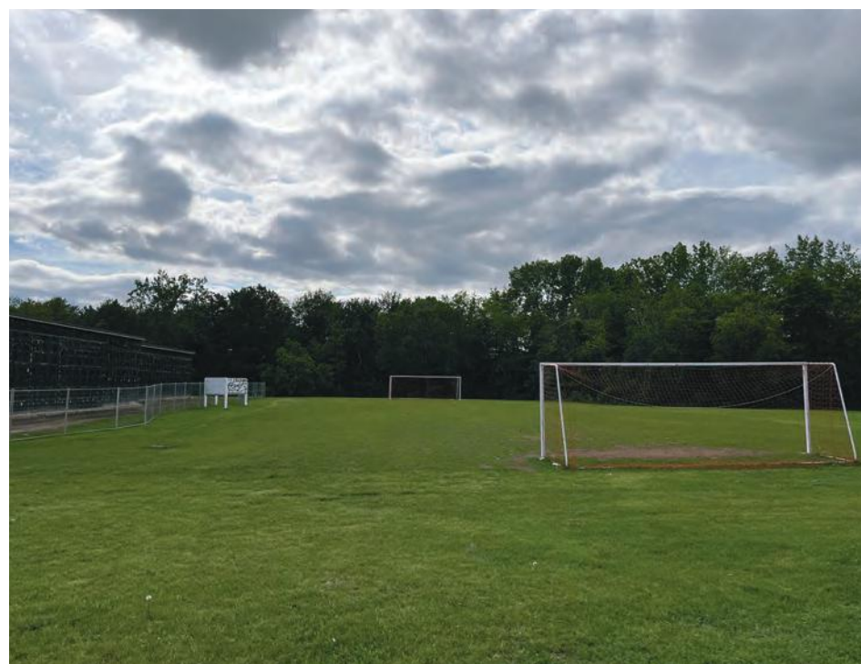
C'est derrière l'école secondaire que serait bâti le complexe sportif si ce site était choisi.

Il y a aussi des avantages à bâtir le complexe sportif au parc Marie-Victorin. À