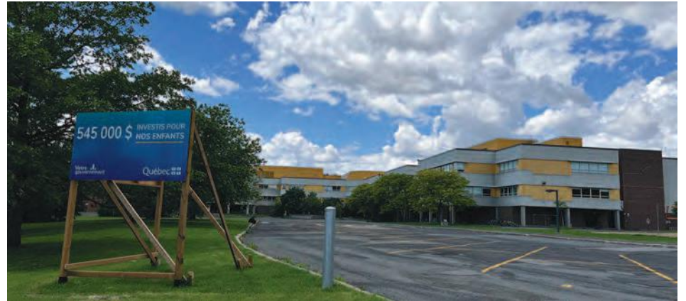
L'école secondaire du Mont-Bruno profite, depuis quelques années, d'un système de géothermie qui lui permet d'augmenter son efficacité énergétique.