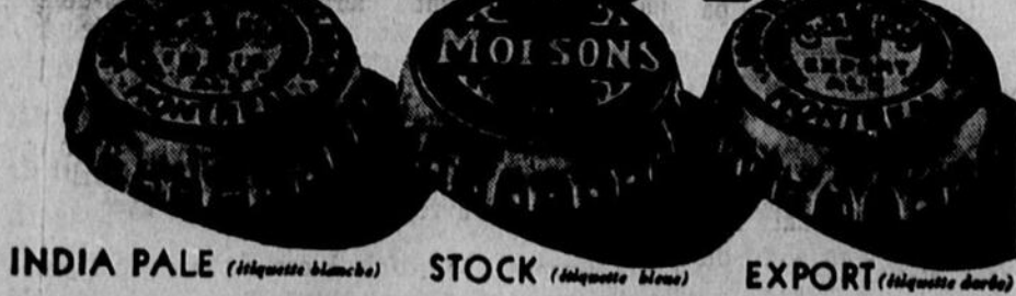
INDIA PALE (étiquette blanche) STOCK (étiquette bleue) EXPORT (étiquette dorée)