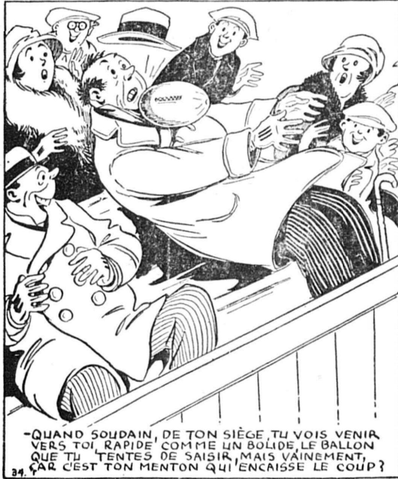
-QUAND SOUDAIN, DE TON SIÈGE, TU VOIS VENIR VERS TOI, RAPIDE COMME UN BOLIDE, LE BALLON QUE TU TENTES DE SAISIR, MAIS VAINEMENT, CAR C'EST TON MENTON QUI ENCAISSE LE COUP ?