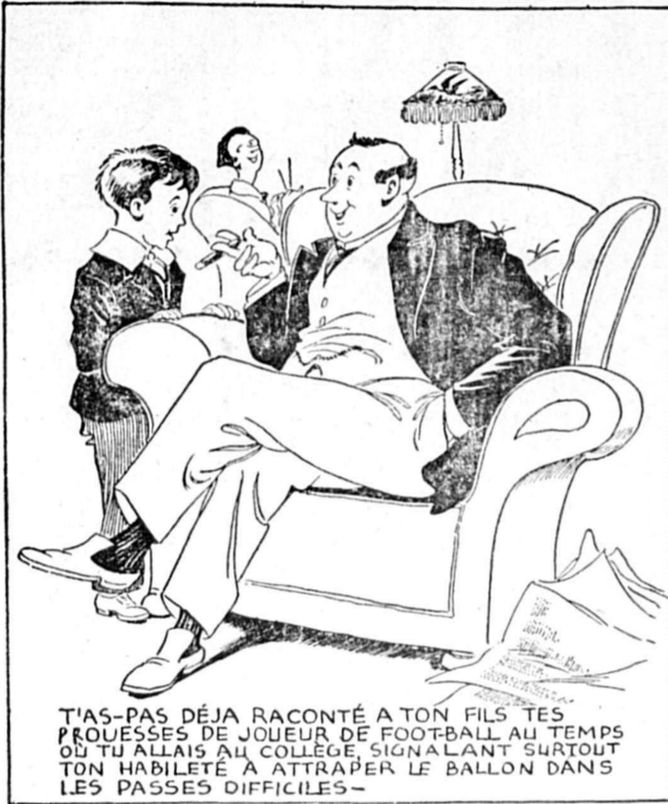
T'AS-PAS DÉJÀ RACONTÉ À TON FILS TES PROFFESSES DE JOUEUR DE FOOT-BALL AU TEMPS QU TU ALLAIS AU COLLEGE SIGNALANT SURTOUT TON HABILITÉ À ATTRAPER LE BALLON DANS LES PASSES DIFFICILES -