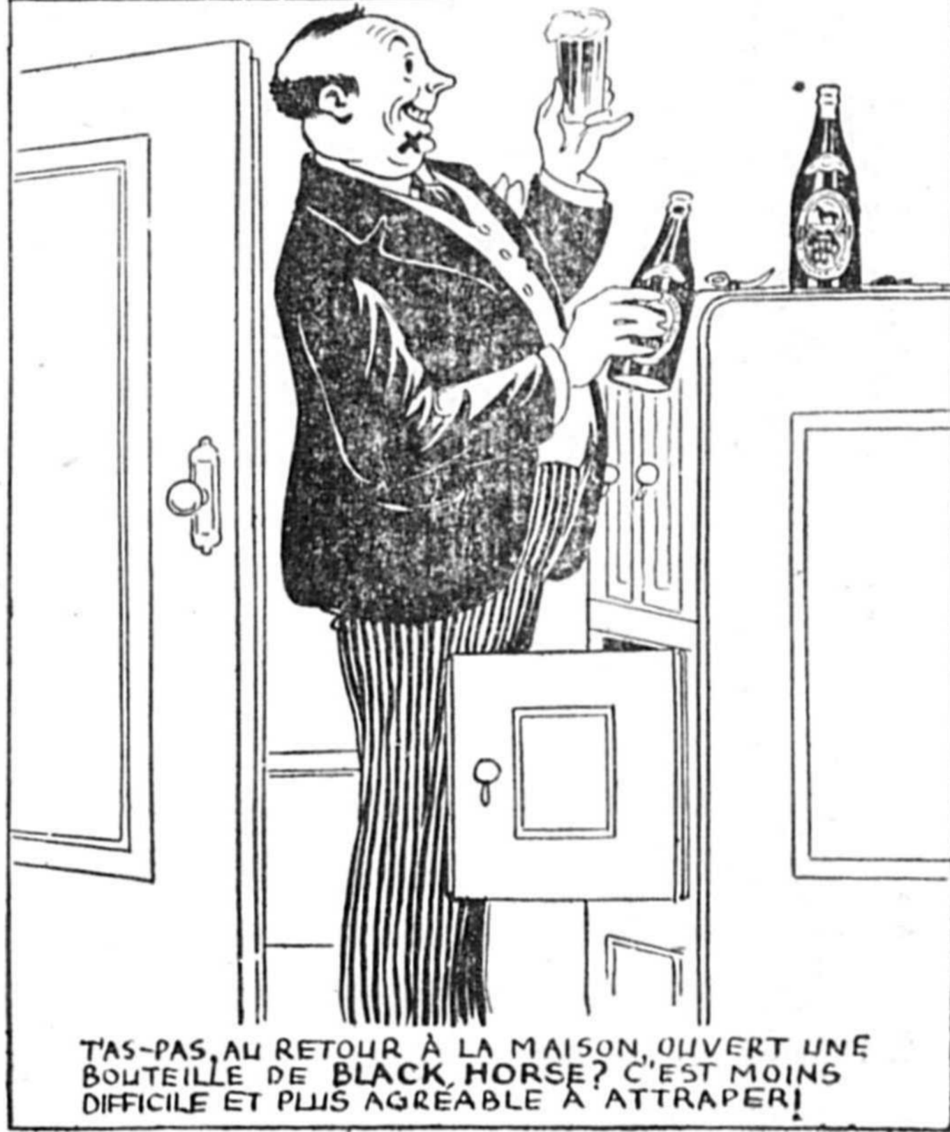
T'AS-PAS, AU RETOUR À LA MAISON, OUVERT UNE BOUTEILLE DE BLACK HORSE? C'EST MOINS DIFFICILE ET PLUS AGREABLE À ATTRAPER!