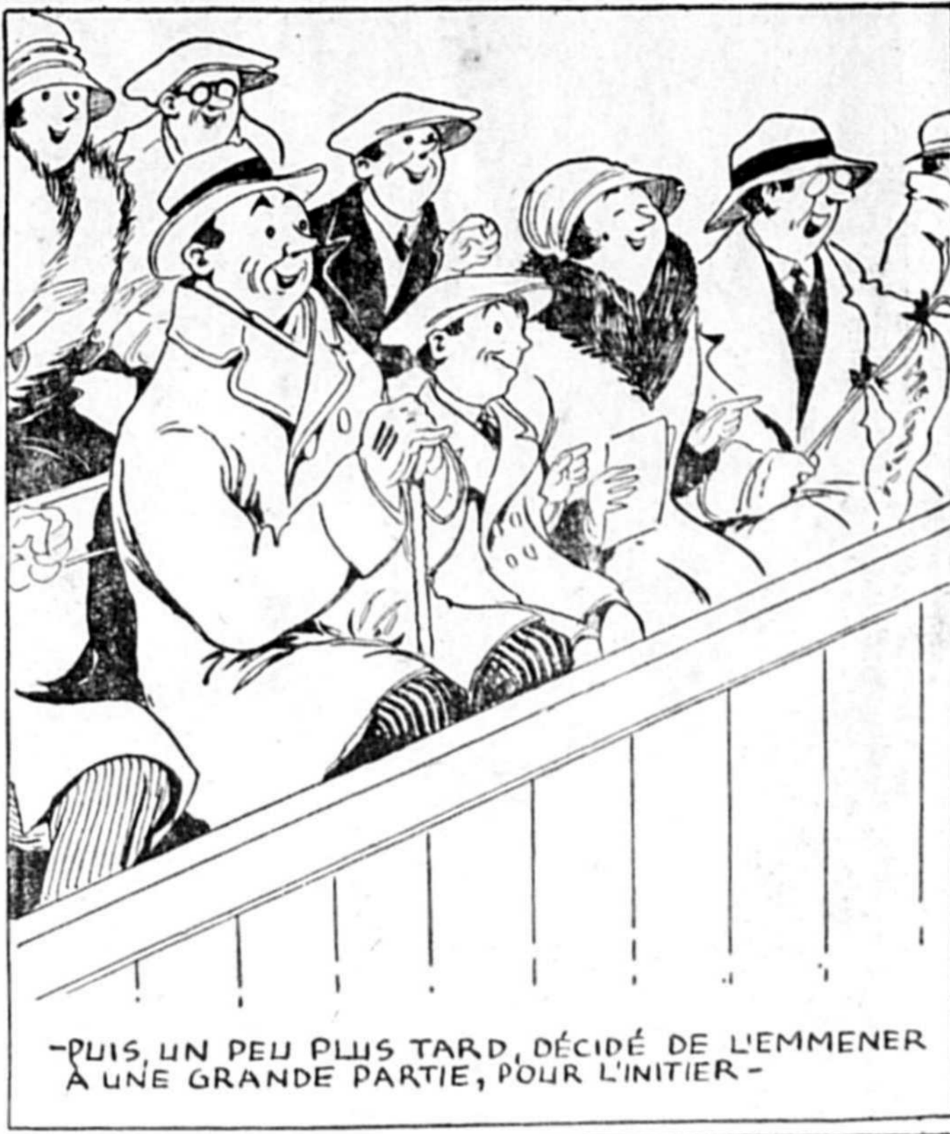
-PUIS, UN PEU PLUS TARD, DÉCIDÉ DE L'EMMENER À UNE GRANDE PARTIE, POUR L'INITIER -