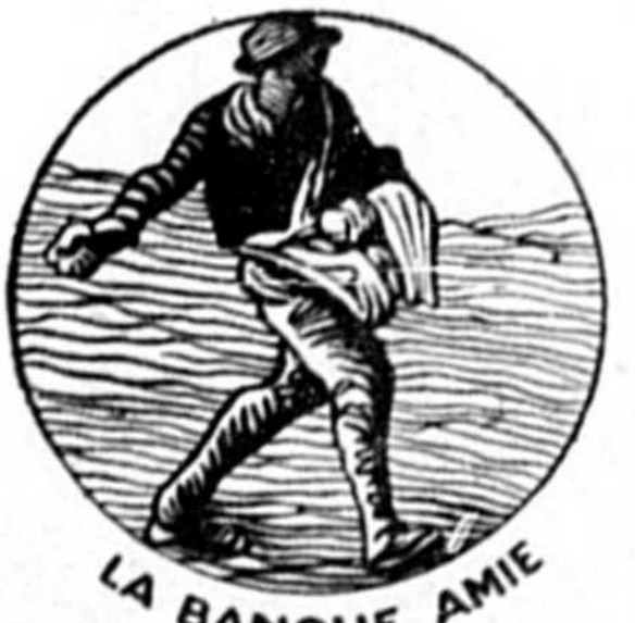
LA BANQUE AMIE

71, Ave. de la Station, Shawinigan Falls