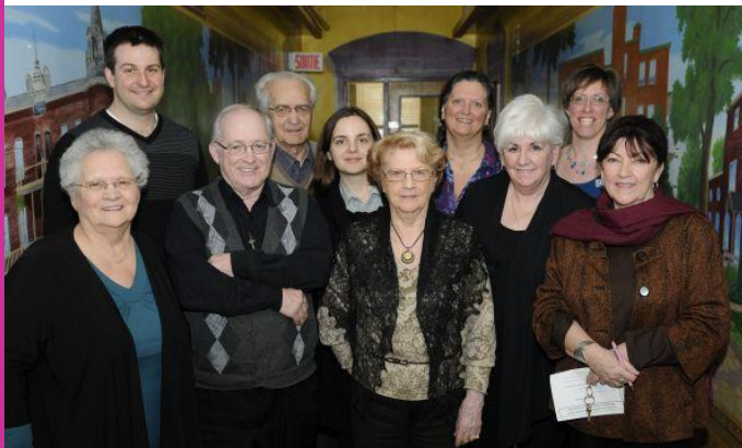
Création d'un comité de milieu de vie par l'AQDR Centre du Québec en mars 2011

Le comité Milieu de vie et le comité Habitat de l'AQDR réunissent plusieurs sections (Mauricie, Saguenay-Lac St-Jean, Montérégie et Chaudière-Appalaches) qui ont beaucoup réfléchi et travaillé à la mise sur pied de comités de milieu de vie dans six régions différentes. Leur expertise a teinté les recommandations de l'AQDR sur les enjeux liés à l'implantation de ces comités. Il y a encore une grande réticence des exploitants, car cette instance de représentation des résidents et des familles va exprimer ce qu'ils veulent comme résidence pour qu'elle devienne un milieu de vie. Pour que cette parole soit possible, il faut que le comité ne soit pas sous la juridiction de l'exploitant.