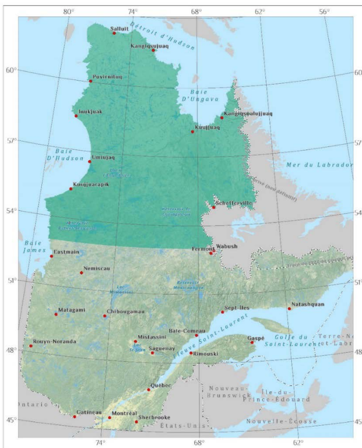
Figure 1. Territoire de cartographie écologique du Nord québécois

La cartographie des dépôts de surface est un des pans issu de la cartographie écologique du Nord québécois. La cartographie couvre un territoire d'environ 700 000 km 2 au nord du 53 e parallèle (figure 1).