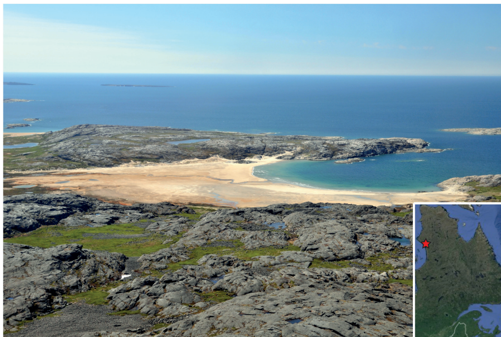
Rivage de la baie d'Hudson