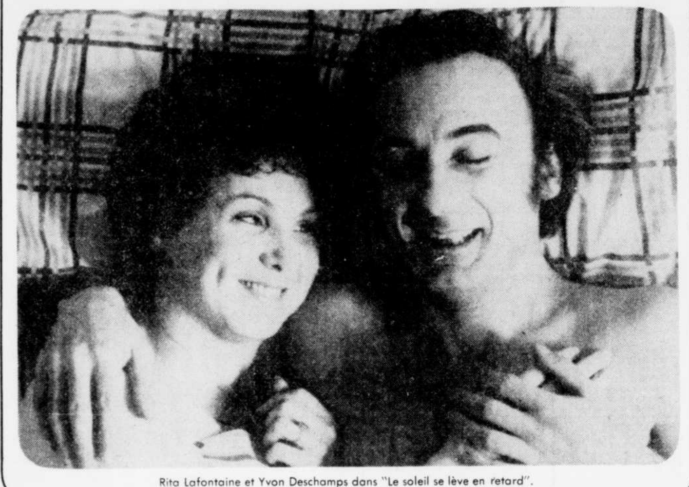
Rita Lafontaine et Yvon Deschamps dans "Le soleil se lève en retard".