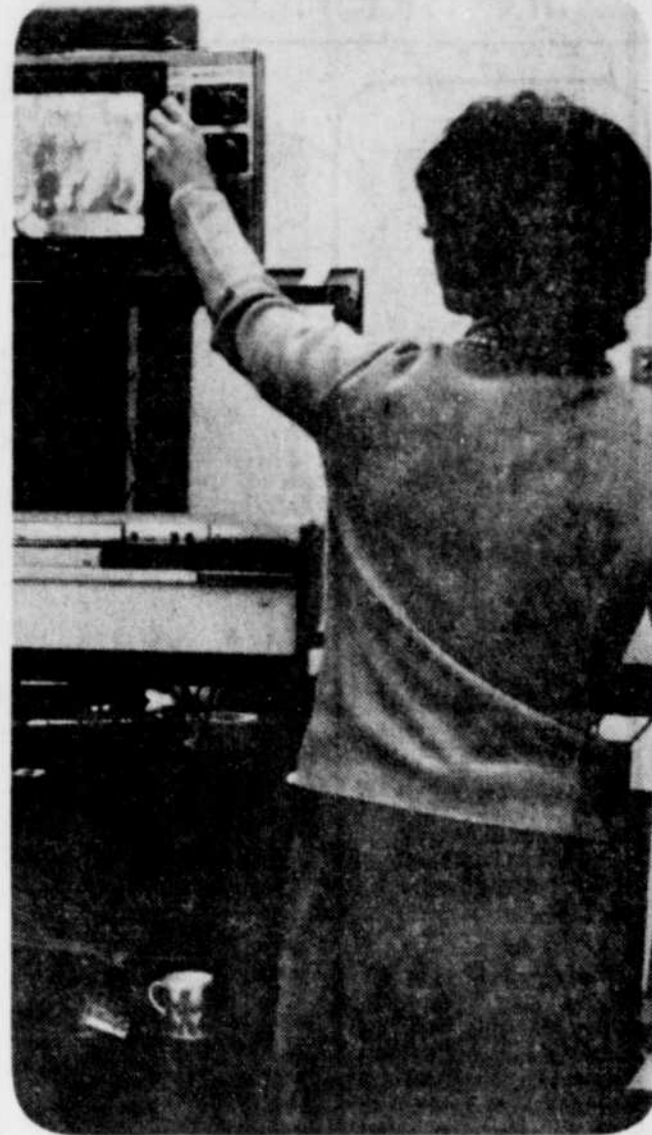
Télé-Krac, une production hebdomadaire étudiante pour la télévision communautaire présente ce soir quatre entrevues traitant de la vie étudiante au Cégep de Shawinigan, et de votre quotidien régional, Le Nouvelliste.

Le directeur du CMC de Shawinigan souligne enfin que ces données comprennent les activités du kiosque à la Plaza de la Mauricie et celles du Campus du Cégep. Elles sont, selon lui, des indicateurs très réalistes du marché du travail actuel, puisqu'en dépit de toutes ces réalisations la proportion de personnes en quête d'emploi demeure très élevée à Shawinigan.