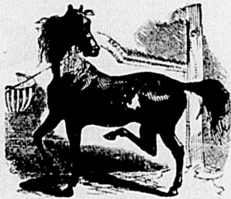
Première période de la colique spasmodique.

Il y en a de deux sortes — spasmodique et flatueuse. La première est la plus fréquente et les symptômes en sont familiers à beaucoup de propriétaires de chevaux. Les gravures ci-dessous montrent les positions prises par le cheval dans les différentes phases de la colique.