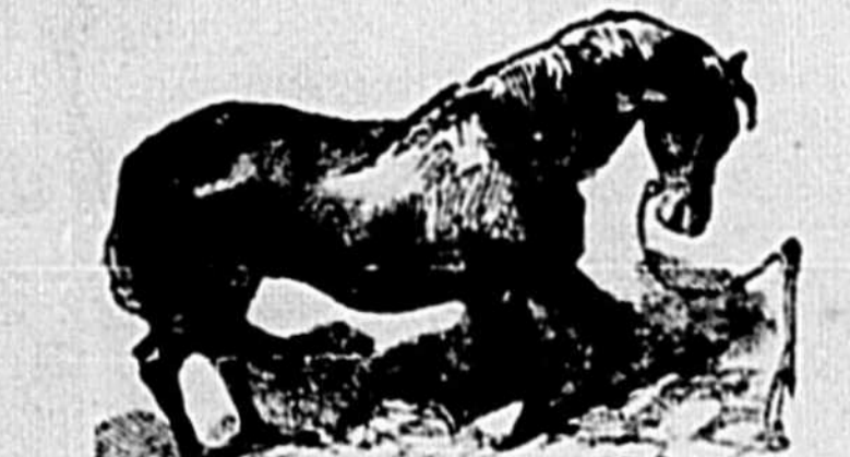
Deuxième période de la colique spasmodique.

Symptômes. —Le cheval éprouve une douleur subite et donne des signes de grande souffrance, changeant continuellement de place, et manifestant le désir de se coucher. Mais en quelques minutes ces symptômes disparaissent, donnant au cheval un moment de répit, suivi d'une attaque plus sévère que la précédente; et ces alternatives continuent jusqu'à ce qu'enfin le cheval ne puisse plus se tenir sur ses jambes. Il est couvert d'une sueur froide, les jambes et les oreilles retiennent à peu près leur température naturelle. Il se regarde les flancs, surtout le côté droit, comme pour indiquer le siège du mal; il gratte la terre du pied de devant, et se frotte presque le ventre du pied de derrière.