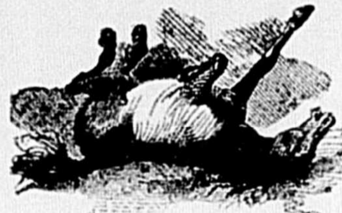
Troisième période de la colique spasmodique.

faire de l'eau, ce dont il est empêché par la contraction spasmodique de l'urètre. Ce dernier symptôme n'a pas besoin de traitement, car, dès que la colique sera passée, le cheval fera de l'eau librement. En conséquence, suivez le traitement que nous donnons ci-dessous, afin d'apaiser la colique le plus tôt possible.