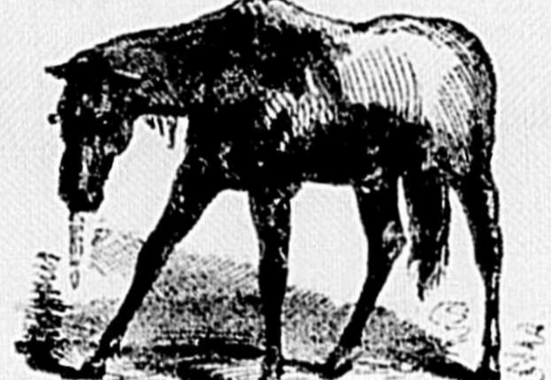
Posture du cheval dans la dernière période de la pneumonie.

Causes. —Une des plus fréquentes peut-être, est une marche rapide contre un vent froid, à la sortie d'une écurie chaude, mal aérée et trop encombrée