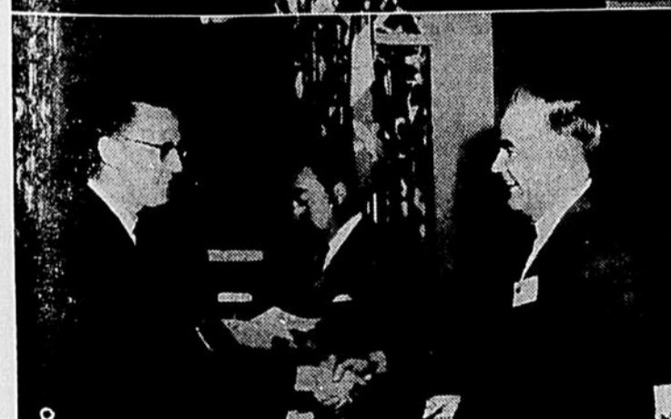
Le premier ministre de la province, l'honorable JEAN LESAGE, était samedi le 20 août dernier l'hôte d'honneur de l'Association des Hebdomadaires de langue française du Canada, à l'issue du congrès annuel au Manoir Richelieu, à La Malbaie. C'était la première fois qu'un Premier Ministre de la Province assistait à un congrès de la presse hebdomadaire. Voici quelques photos prises lors du dîner. (1) l'honorable M. LESAGE, au cours de l'allocution mémorable qu'il a prononcée. (2) Les invités de la table d'honneur entourant l'hon. Lesage; de gauche à droite, l'hon. DANIEL JOHNSON, député de Bagot et conseiller juridique de l'Association, Mme LIONEL BERTRAND, l'hon. LIONEL BERTRAND, secrétaire de la Province et sec.-trésorier de l'Association, Mme MAURICE MARQUIS, M. LUCIEN FONTAINE, président sortant, l'hon. LESAGE, M. MAURICE MARQUIS, président élu, Mme LUCIEN FONTAINE, Mme JEAN LESAGE, l'hon. PAUL GERIN-LAJOIE, Ministre de la Jeunesse et membre de l'Association, Mme GERIN-LAJOIE, M. et Mme LUCIEN GUERTIN. (3) Le président du dîner, M. Lucien Fontaine, remet à l'hon.