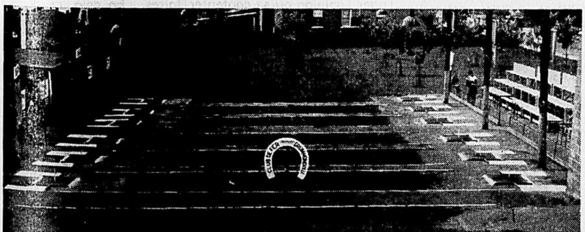
"CLUB DE FER" DE DRUMMONDVILLE : Cette photo nous montre le magnifique terrain, où se dérouleront les 10 et 11 septembre prochain, les rencontres du grand tournoi provincial de Fer à Cheval, à Drummondville. Ce grand événement sera sous le patronage de la brasserie Molson. Ce terrain qui fait l'orgueil de tout Drummondville,

est de l'avis de plusieurs, le plus beau et le mieux organisé de la province. Il est à noter que les distances réglementaires de 40 pieds entre chaque poteau sont observées. Un très grand nombre de concurrents sont attendus à ce tournoi, le premier du genre à Drummondville.