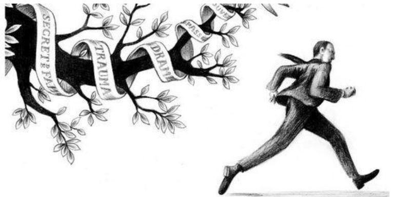
L'héritage de nos aïeux ne se cantonne pas à un regard bleu azur ou à une tendance à la colère, mais aussi à une part de leur vécu douloureux.