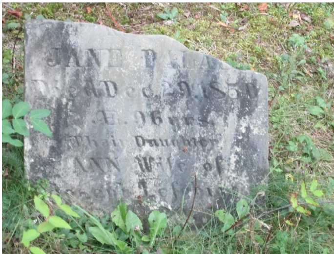
Pierre tombale d'origine datant de 1840

C'est dans le cimetière protestant Trinity de Saint-Gilles que la pierre tombale a été retrouvée, mais malheureusement en très mauvais état. Le descendant désirait restaurer le monument. Une photo de la pierre tombale lui a été acheminée. Devant l'ampleur de la dégradation, le descendant a pris l'initiative de faire fabriquer une nouvelle pierre afin de s'assurer que la trace de ses ancêtres ne soit pas perdue à tout jamais. Cette pierre a été installée au début juin 2015.