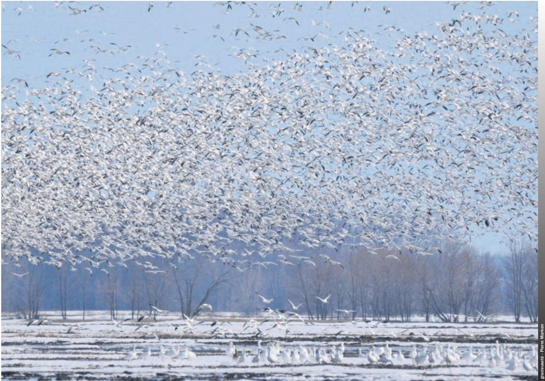
Des oies prises en photo à Saint-Barthélemy lors du printemps 2017.