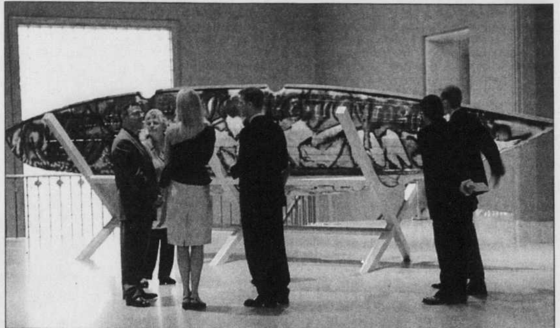
Le Musée des beaux-arts de Montréal inaugurerait hier une exposition des œuvres de Jean-Paul Riopelle qui appartiennent pour la plupart à sa propre collection. L'exposition, qui se terminera le 29 septembre prochain, accueille aussi des œuvres des collections du Musée du Québec et de Power Corporation ainsi que d'autres œuvres, très peu connues, tirées de l'atelier de l'artiste.

L'exposition Riopelle ouvrirait hier en même temps qu'une rétrospective des œuvres de la peintre Joan Mitchell, qui couvre entièrement la carrière de l'artiste, de 1951 à sa mort en France en 1992. Mitchell et Riopelle ont été compagnons de vie.