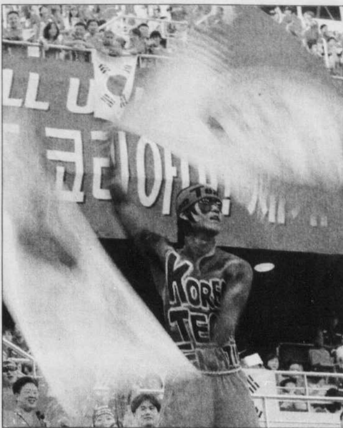
Les supporters de l'équipe sud-coréenne arboraient des maquillages dignes de guerriers indiens et n'ont jamais failli à la tâche d'encourager les leurs.

A 18h, le «Pilsung Korea» («victoire pour la Corée»), hymne de la bande d'Hiddink, et les «Tee Han Min-kuk» («République de