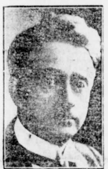
Le président COSGRAVE, de l'Etat Libre d'Irlande, qui a triomphé dans les deux élections complémentaires, prenant même un siège à De Valera.