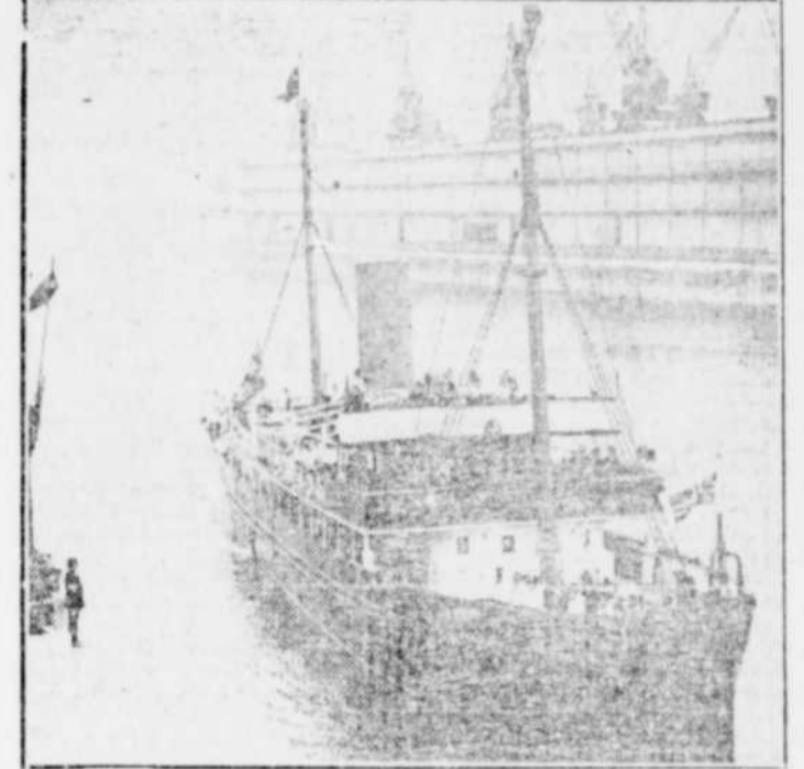
Leurs Majestés le Roi et la Reine d'Angleterre viennent d'inaugurer officiellement la cale-seche de Liverpool. On voit ici le bateau galata ayant à bord les souverains s'avançant à travers la cale, qui est une construction absolument originale.