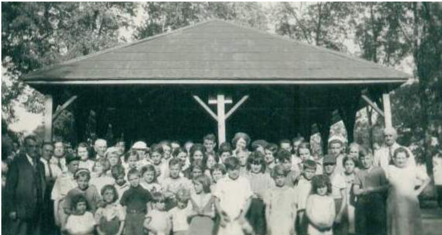
Pique-nique à l'île Sainte-Hélène en 1947