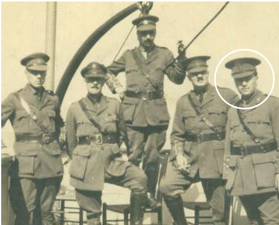
Aumônier militaire en 1916.

der pardon de ses fautes; l'adage « Hors de l'Église (catholique), point de salut » perdait également son sens. Il retrouvait déjà par ses lectures et ses observations les grands principes protestants, et cette vision nouvelle devenait pour lui apaisante. Il n'échappait pas pour autant à ses tiraillements, mais il semble bien qu'il les ait gardés longtemps pour lui et n'en ait fait part à personne.