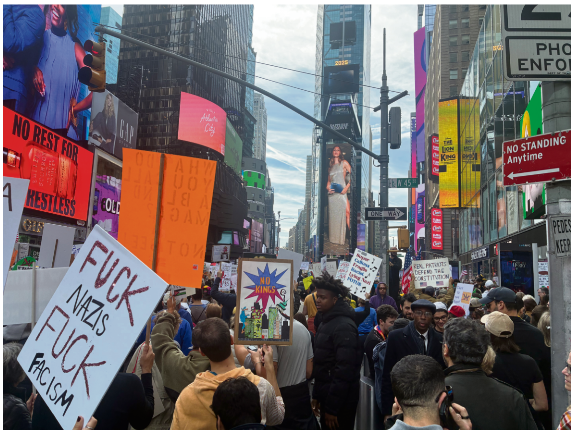
VALENTIN PELOUZET | LE DÉLIT