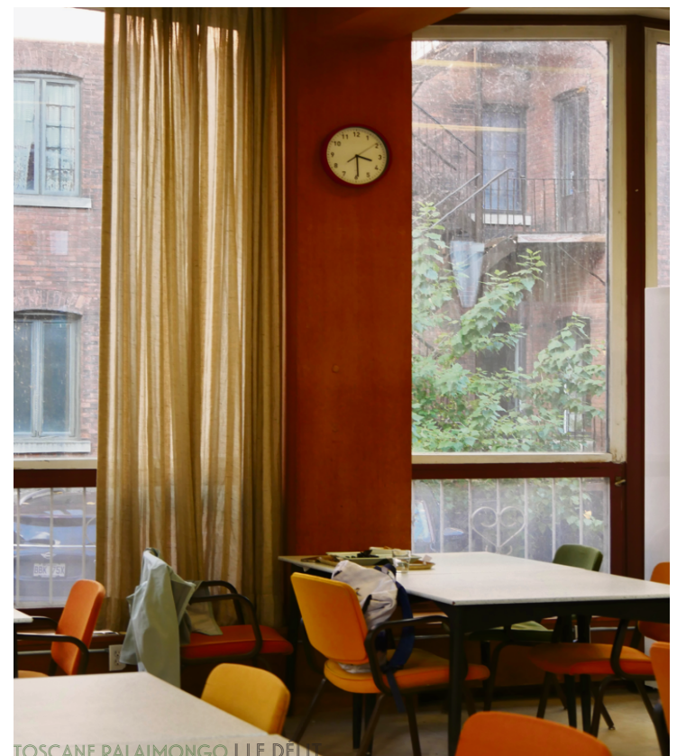
TOSCANE RALAIMONGO | LE DÉLIT

Pour moins de 20 dollars, on peut avoir un plat chaud dans une atmosphère paisible, quelque chose de plus en plus recherché maintenant que la température commence à