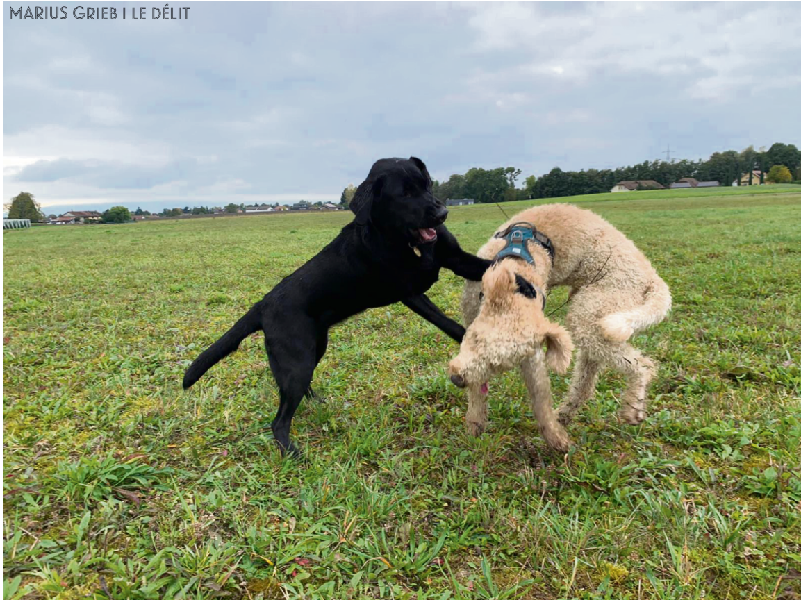
MARIUS GRIEB | LE DÉLIT

ciales sont perceptibles à l'échelle individuelle : pas besoin d'une étude scientifique pour comprendre que regarder une centaine de vidéos en format court en l'espace de quinze minutes n'aura pas des effets positifs sur notre bien-être. Mais, comme pour la plupart des phénomènes sociaux, c'est surtout l'idéologie politique qui se cache dans l'ombre de cette frénésie collective qui se révèle réellement dangereuse.