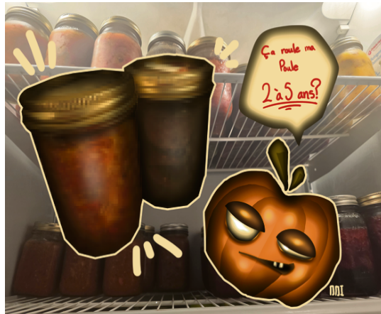
STU DORÉ | LE DÉLIT

Le terme « cannage » est peut-être une expression plus familière désignant la mise en conserve dans des pots de verre de type « Mason » ou « Bernardin ». Cette technique est habituellement pratiquée pour prolonger la conservation des aliments, pour préparer des marinades ou simplement pour sceller hermétiquement