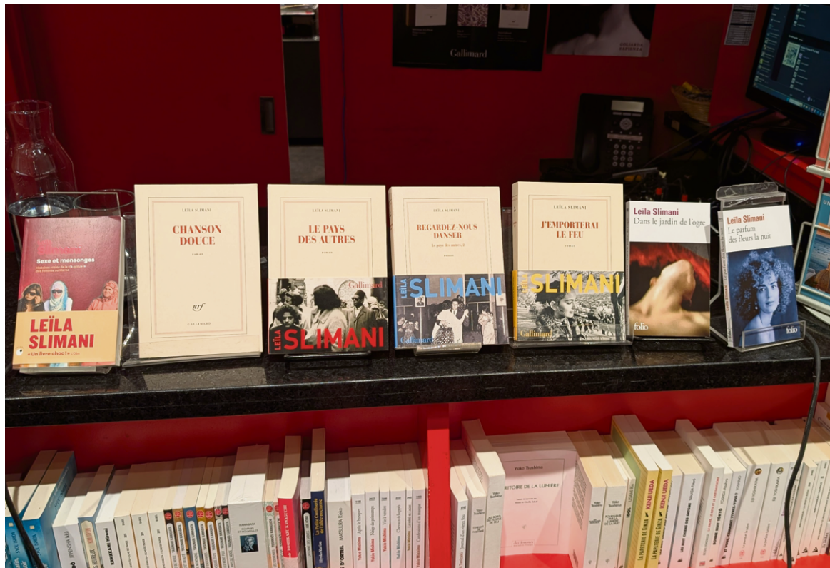
JIAYUAN CAO | LE DÉLIT