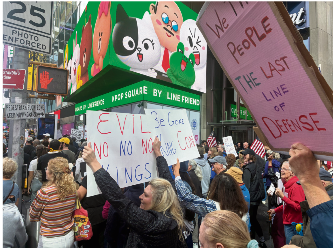
VALENTIN PELOUZET | LE DÉLIT

Le mouvement « No Kings », malgré sa popularité, peut-il réél-