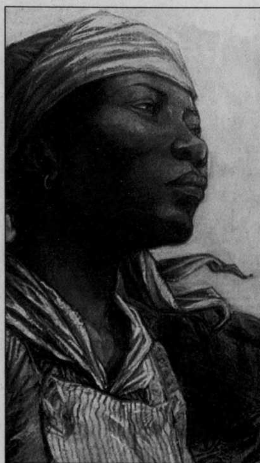
Détail de l'illustration de Francis Black pour la couverture de l'ouvrage de Roland Viau, Ceux de Nigger Rock , paru aux éditions Libre Expression.

N ous sommes au début des années 1950. Près de Saint-Armand, dans les cantons de l'Est, un fermier vient de déterrer un crâne dans son champ. Il venait auparavant de découvrir des os, plus ou moins rongés. Homme ou bête, se demande-t-il? Homme, lui répond avec assurance le facteur du village. Probablement les restes d'esclaves noirs enterrés là au XIX e siècle, apprendra plus tard le fermier. Donc le voici devant les restes d'hommes traités comme des bêtes. Que fait-il? Il réenterrer tout cela sans plus de cérémonie, près d'un vieux pommier, et s'en va continuer de remuer son champ.