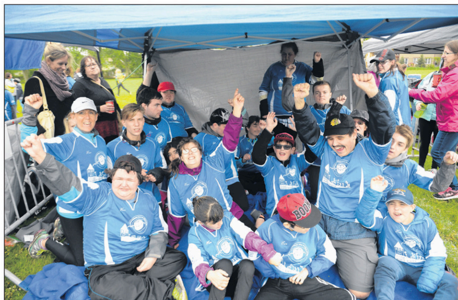
L'équipe de l'école Marie-Rivier ne manquait pas d'énergie.