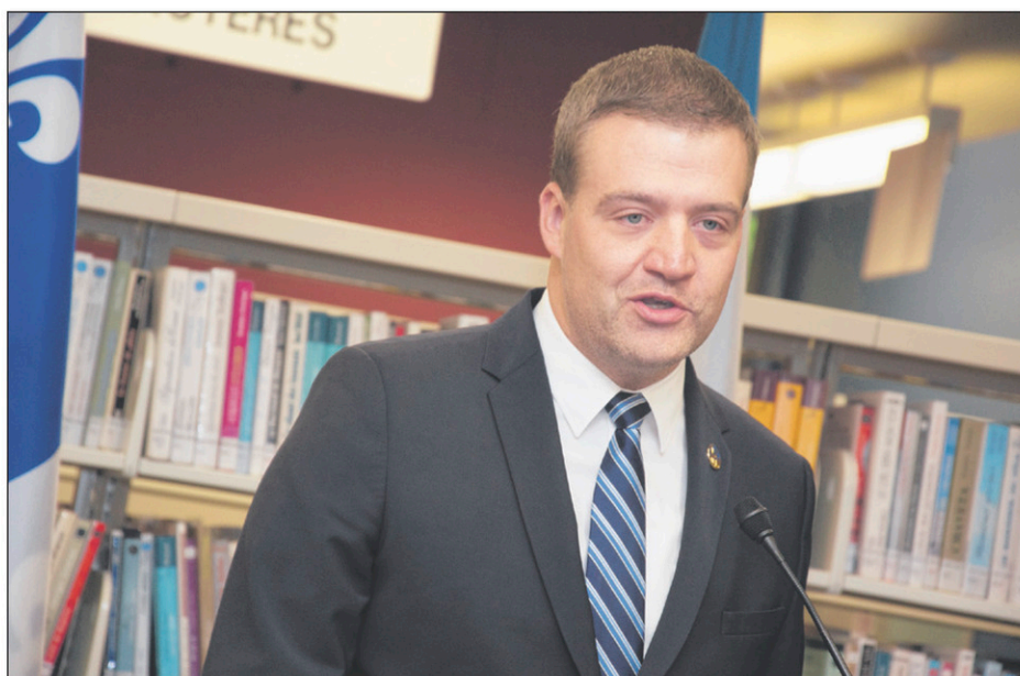
Le ministre de la Culture et des Communications, Luc Fortin, a annoncé que son gouvernement donnerait des subventions pour l'intégration de l'église Saint-Gérard-Majella à un projet immobilier, mais à plusieurs conditions.

Ce dernier a étudié les croquis proposés par les promoteurs montrant le lieu de culte intégré à un complexe locatif de 81