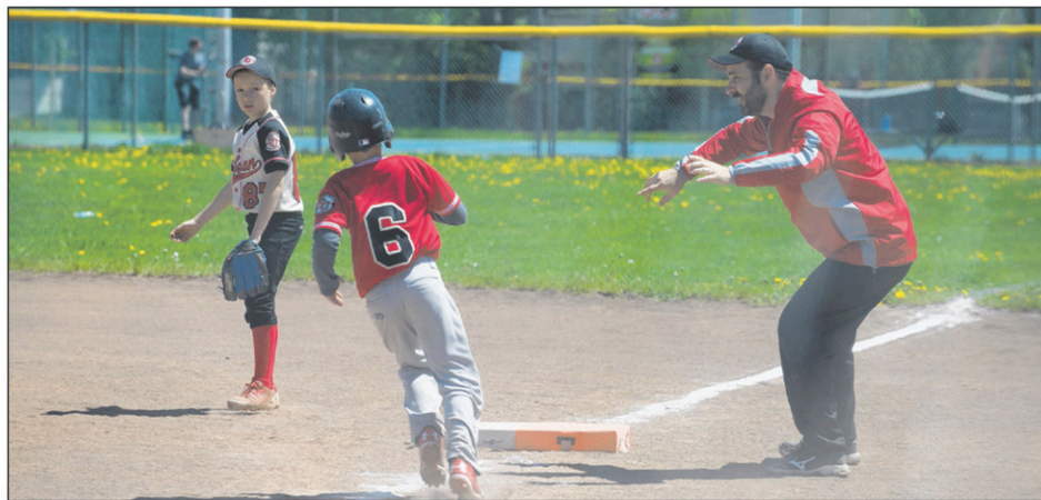
Plusieurs équipes du baseball mineur de Saint-Jean-sur-Richelieu ont disputé des matchs en fin de semaine, sur les terrains du Parc multisport Bleury, dans le secteur Iberville. Cet été, 559 joueurs sont inscrits dans la Ligue de baseball mineur de Saint-Jean.

L'augmentation du nombre d'inscriptions se traduit par l'ajout de six équipes en 2017. Ainsi, par rapport à l'été dernier, le baseball mineur compte deux équipes de plus dans les catégories novice et pee-wee, et une de plus chez les atomes et les moustiques.