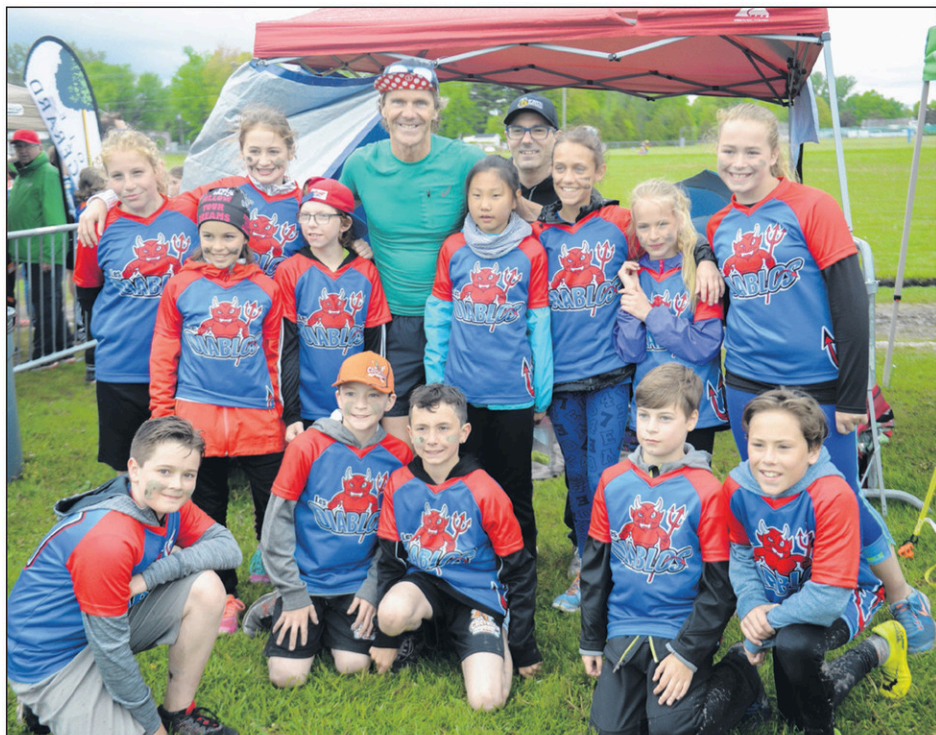
L'équipe de l'école Saint-Lucien était bien fière de rencontrer Pierre Lavoie.