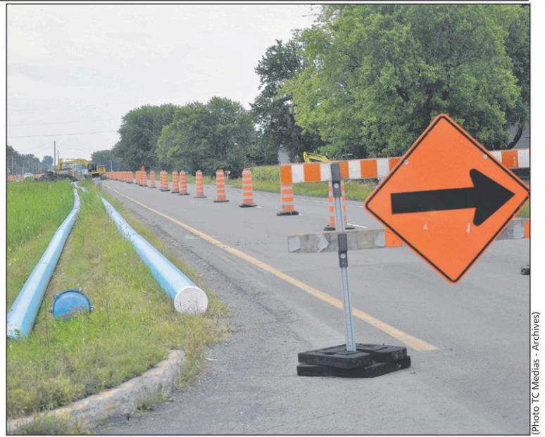
La conduite visait à desservir un noyau urbain, six kilomètres plus loin.

La responsable de l'accès à l'information lui a répondu par écrit «qu'aucune demande officielle de subvention n'a été déposée. Seules des démarches verbales ont eu lieu avec le MAMOT» (ministère des Affaires municipales et de l'Occupation du territoire). La lettre poursuit en indiquant que la Ville ne détient aucun document relatif à des analyses de qualité d'eau sur les propriétés du boulevard Saint-Luc.