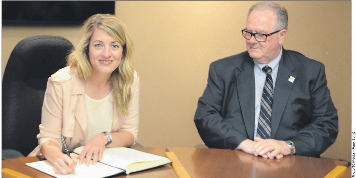
En compagnie du maire Michel Fecteau, la ministre Mélanie Joly signe le Livre d'or de Saint-Jean lors de son passage à l'hôtel de ville.

Quant à l'aide fédérale à l'International de montgolfières, dans sa portion versée par Patrimoine canadien, elle était passée de 80 000$ à 94 000$ l'an dernier et sera majorée à 96 000$ cette année, a annoncé la ministre.