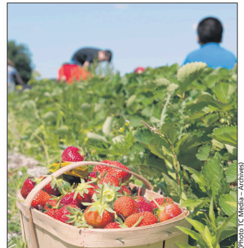
Malgré la pluie du printemps, les producteurs sont optimistes en vue de la prochaine saison des fraises.

Il faudra maintenant que le soleil demeure au rendez-vous, afin de permettre le développement et le mûrissement des fruits. La chaleur sera bienvenue, mais pas la canicule.