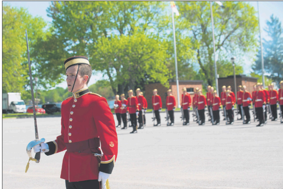
Le Collège militaire pourrait accueillir jusqu'à 250 élèves-officiers à la rentrée du mois d'août.

Interrogé par la ministre qui voulait savoir jusqu'à quel nombre le Collège