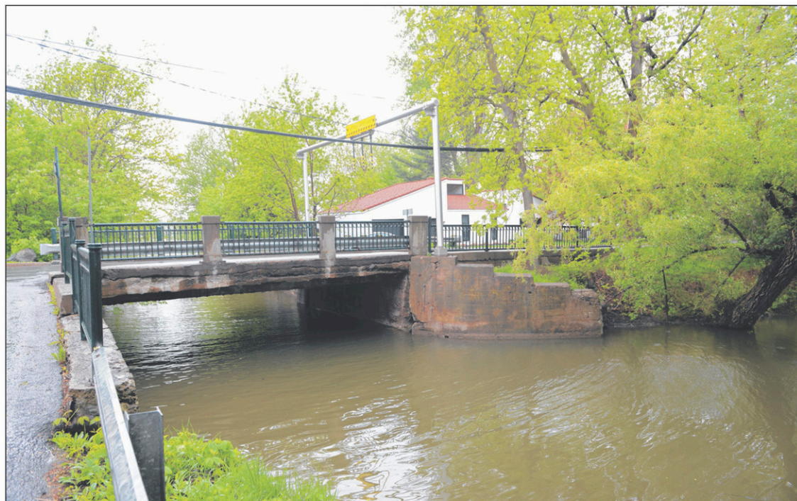
Il y a au moins une décennie qu'il est question de reconstruire le pont du ruisseau Bleury