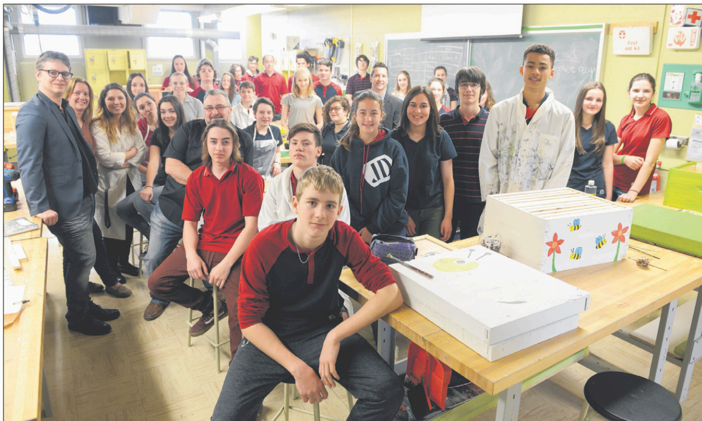
Des élèves de troisième secondaire ont fabriqué une trentaine de ruches à l'école Joséphine-Dandurand.