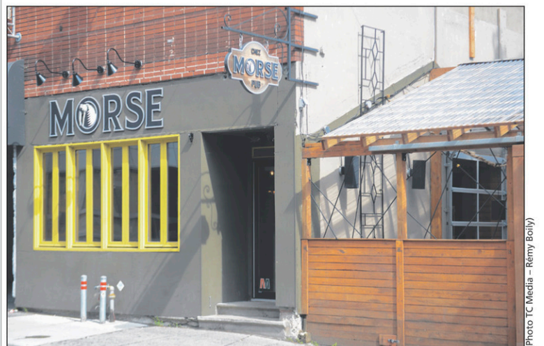
Le pub Chez Morse est l'un des deux établissements ciblés par des voleurs.

Néanmoins, les autorités rappellent aux citoyens qu'ils peuvent transmettre des informations sur la ligne anonyme Anti-crime en tout temps, au 450 357-2000, s'ils ont été témoins d'une activité suspecte.