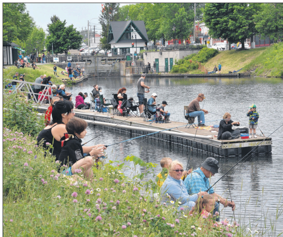
Le tournoi de pêche du Club Richelieu se terminera à 14 heures avec la remise des trophées.

Quelle que soit leur prise du jour, les jeunes pêcheurs courront la chance de gagner l'un des nombreux prix décernés sur le site, vers 14 heures.