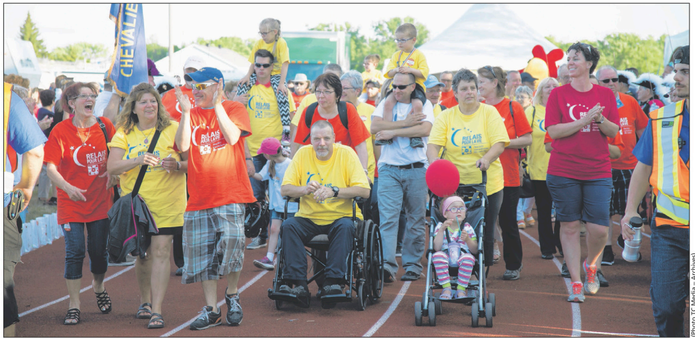
Les personnes survivantes du cancer donneront le coup d'envoi officiel du Relais pour la vie à 19 heures.

Un cornemuseur, une montgolfière illuminée en vol captif de même qu'un moment