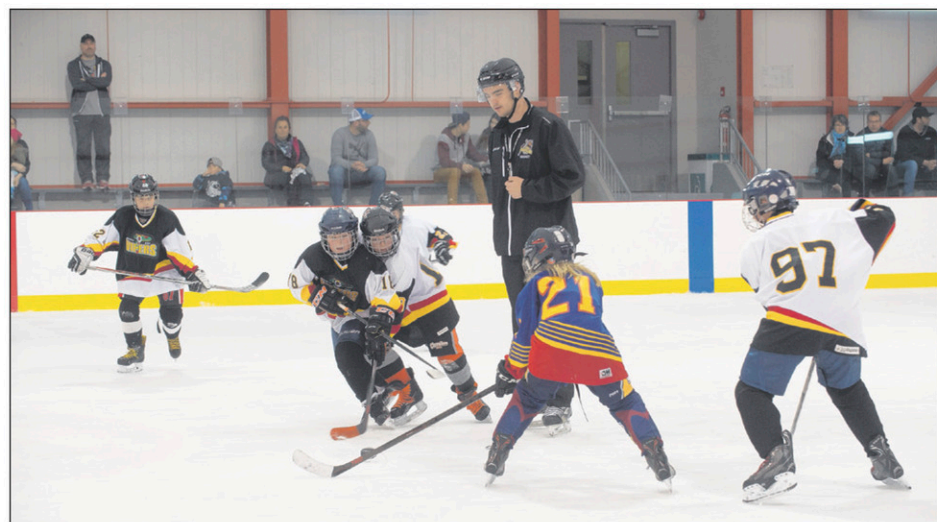
Les joueurs de catégorie benjamine participaient pour la première fois au camp de sélection du programme de hockey scolaire de la polyvalente Marcel-Landry.

Elle courra le 100 m et le 200 m. Les deux athlètes les plus rapides obtiendront leur laissez-passer pour les Mondiaux.