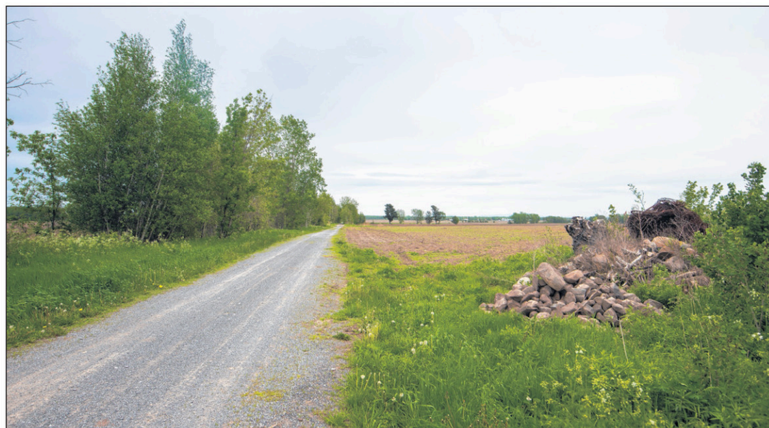
Cet agriculteur a étendu son champ jusqu'au sentier de gravier. Auparavant, il y avait une bande boisée comparable à celle de l'autre côté. En plus, il a déposé des pierres et des souches sur la propriété de la piste cyclable.

droite. Il arrive que le sentier soit recouvert de purin. Pas terrible pour circuler à vélo. Enfin, il faut le souligner, de Farnham à Granby, un tel comportement ne se rencontre pas.