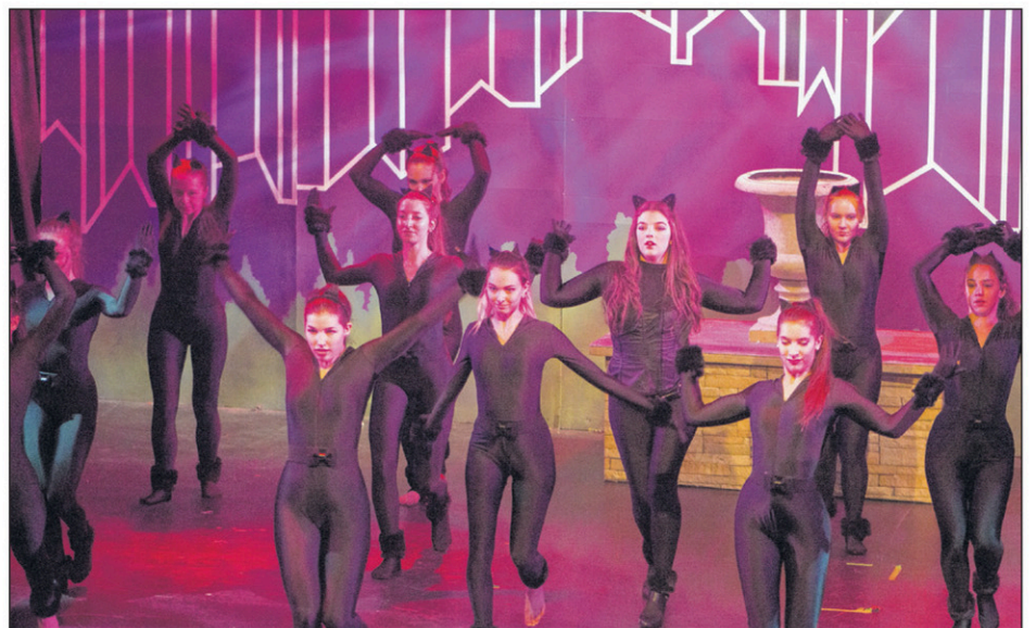
Des numéros de danse des finissants de l'option punctuaient le chorédrame. Les chorégraphies étaient signées Karine Lemay et Caroline Cyr.