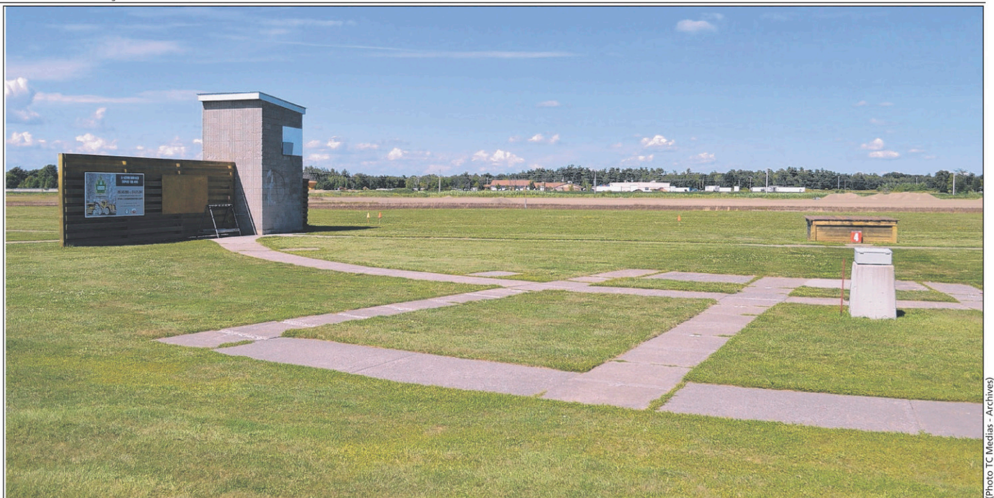
Le club doit cesser ses activités extérieures trois ans après la fin du processus de changement de zonage.

Le comité exécutif approuve les États financiers 2016 de l'Office municipal d'habitation du Haut-Richelieu. Ils révèlent un déficit réel de 2377$ pour le volet HLM. Ce déficit est payable à 10% par la Ville de Saint-Jean-sur-Richelieu, soit une somme de 237 718$. Une somme de 54 893$ est également versée à titre de contribution de la Ville au Programme de supplément de loyer.