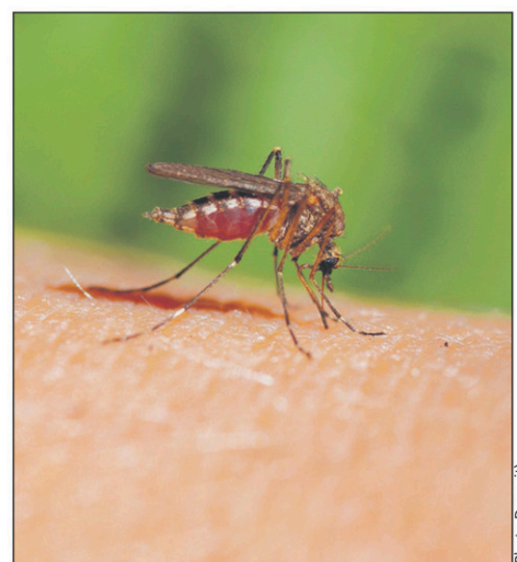
Le printemps pluvieux est très favorable à la prolifération des moustiques dans la région.

Tout le Québec sera aux prises avec cette recrudescence des populations et Saint-Jean-sur-Richelieu ne sera pas