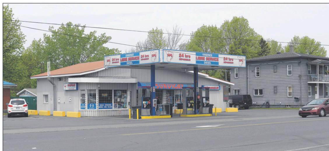
Un autre vol qualifié est survenu au dépanneur Survigaz dimanche dernier.

Mentionnons que trois des fusils ont été achetés par la Ville de Saint-Jean-sur-Richelieu et quatre ont été donnés par les Forces armées canadiennes à l'occasion du renouvellement de leur équipement.