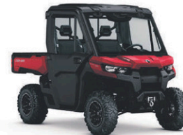
Defender XT CAB