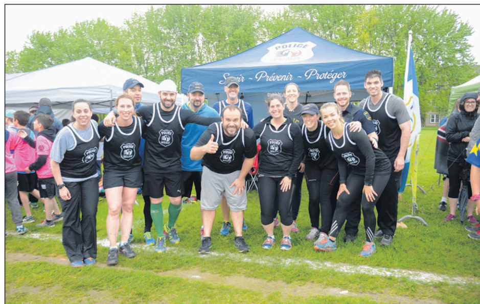
Les policiers de Saint-Jean-sur-Richelieu ont participé à l'événement pour une troisième année consécutive.