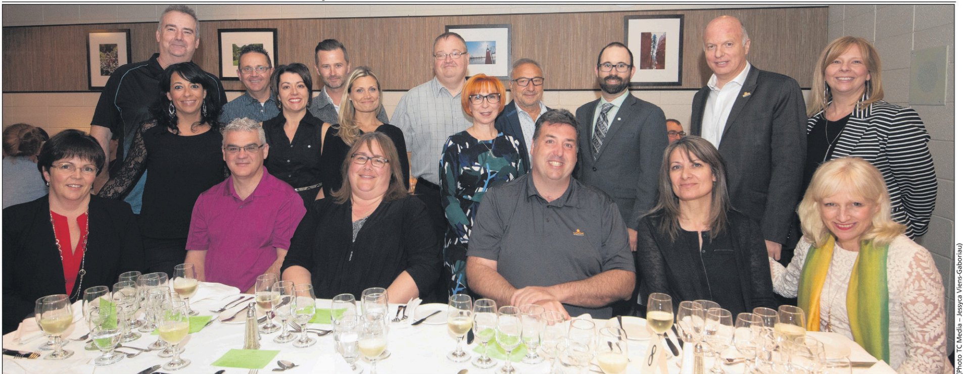
Plusieurs personnalités du monde de l'éducation dans la région ont participé à la 15 e édition du souper-bénéfice pour la persévérance scolaire.