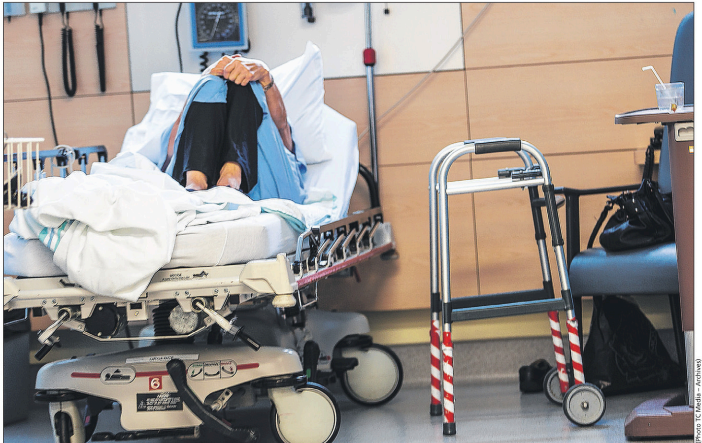
Les aînés hospitalisés passent souvent en premier pour obtenir une place en hébergement, selon l'Alliance du personnel professionnel et technique de la santé et des services sociaux.

«Il n'y a aucun rehaussement prévu pour les ressources de type familial, ajoutée-t-elle. Il y a très peu d'attente de ce côté. Les demandes ne sont pas du même ordre. À cause du vieillissement de la population, les gens ont davantage besoin de places en ressource intermédiaire ou en centre d'hébergement. Le maintien à domicile a