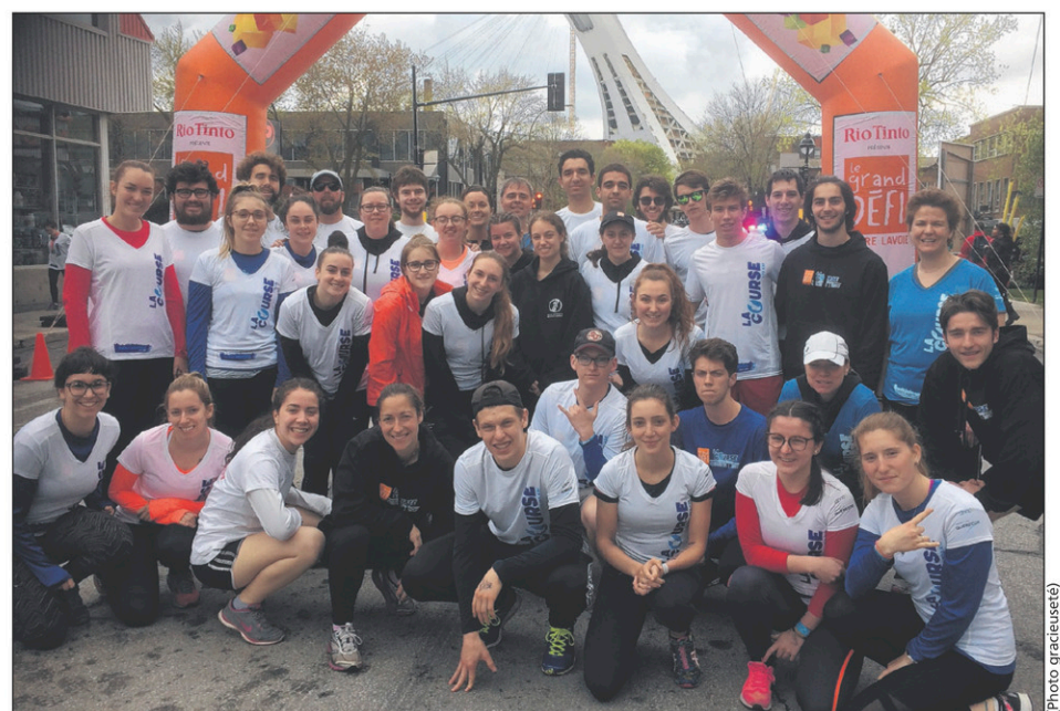
Les étudiants du Cégep à leur arrivée au Parc olympique après La Course du Grand défi Pierre Lavoie.

«En dépit de la fatigue accumulée, de la douleur et des blessures, c'est une