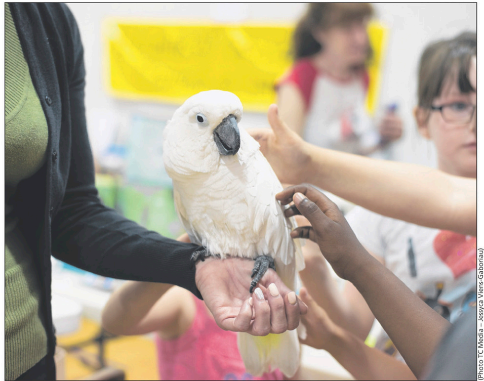
Les perroquets occupent une place importante dans la programmation.

Les activités se déroulent de 10 à 17 heures. Le prix d'entrée est de 2$ pour les adultes. L'entrée est gratuite pour les enfants de moins de 12 ans. On peut obtenir plus de renseignements en consultant le site Internet avecdeuxailes.ca. Il faut cliquer sur l'onglet «Festival avec deux ailes», en haut de page.