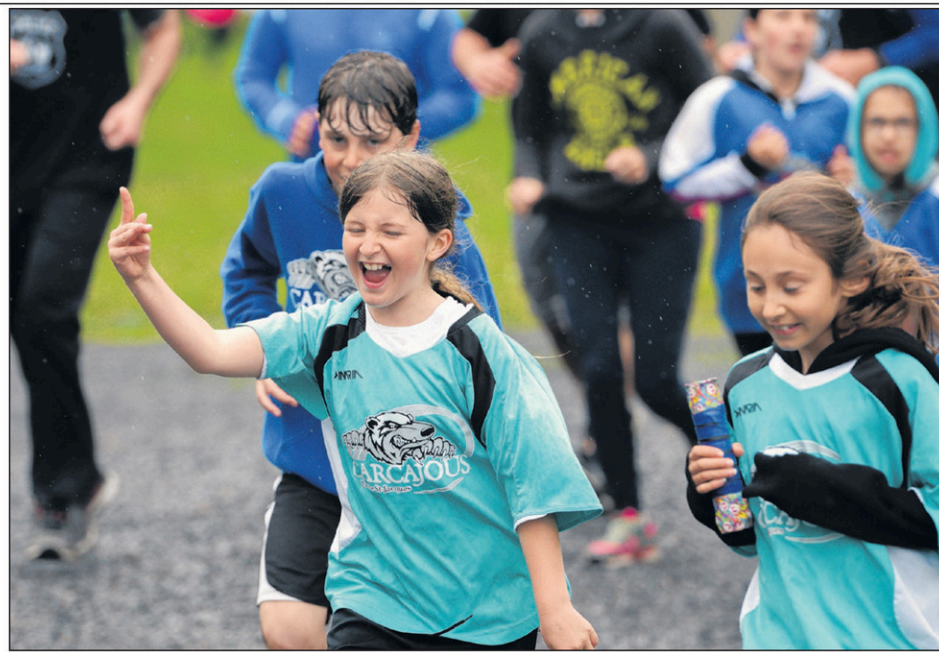
La pluie n'est pas venue gâcher la fête pour cette élève de l'école Saint-Jacques.