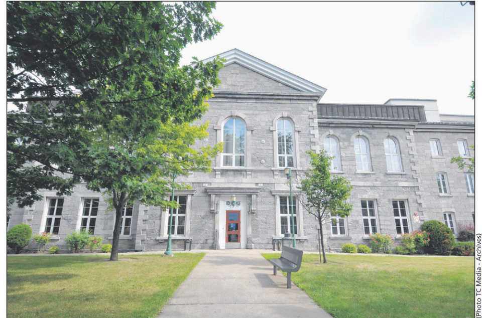
Antonio D'Amico a été reconnu coupable de plusieurs chefs d'accusation au palais de justice de Saint-Jean.

Selon l'enquête menée par le Bureau des enquêtes indépendantes (BEI), l'accusé a pointé l'arme en direction des policiers. Le vendredi 26 mai, au moment de l'enregistrement des plaidoyers de