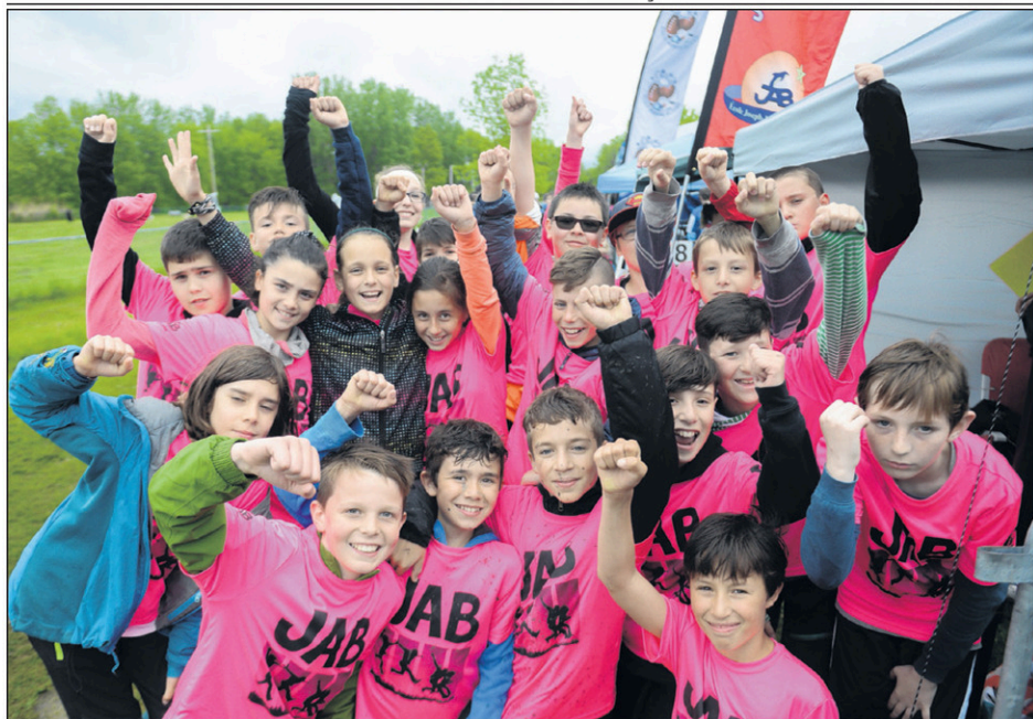
Les élèves de l'école Joseph-Amédée-Bélanger ont relevé le défi de courir un marathon à relais le 26 mai dernier.