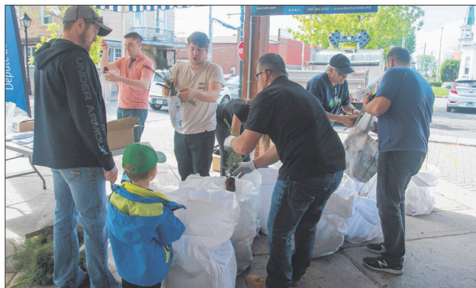
Les citoyens pouvaient choisir leur arbre parmi dix essences disponibles telles que le pin blanc, le bouleau jaune et l'érable à sucre.

La distribution s'est poursuivie en après-midi à Saint-Blaise-sur-Richelieu. Une centaine de personnes sont venues chercher environ 200 arbres supplémentaires. Un millier d'arbres ont été écoulés au total durant la journée.