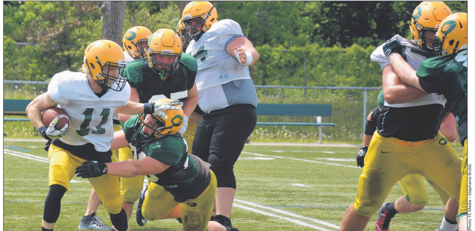
Les joueurs des Géants ont enfilé 180 jeux le week-end dernier en préparation pour la prochaine saison.

À l'attaque, une des batailles qui retiendra l'attention d'ici l'ouverture de la saison 2017 sera celle pour le poste de quart. De l'aveu même