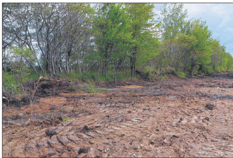
À Sainte-Brigide, un agriculteur est en train d'agrandir son champ en arrachant la bande boisée.

LE CANADA FRANÇAIS 315, rue MacDonald, bureau 250 Saint-Jean-sur-Richelieu J3B 8J3 Sans frais : 1 800 947-8555 Télécopieur: (450) 347-4539 450 347-0323 www.canadafrancais.com LES PETITES ANNONCES 1 866 637-5236