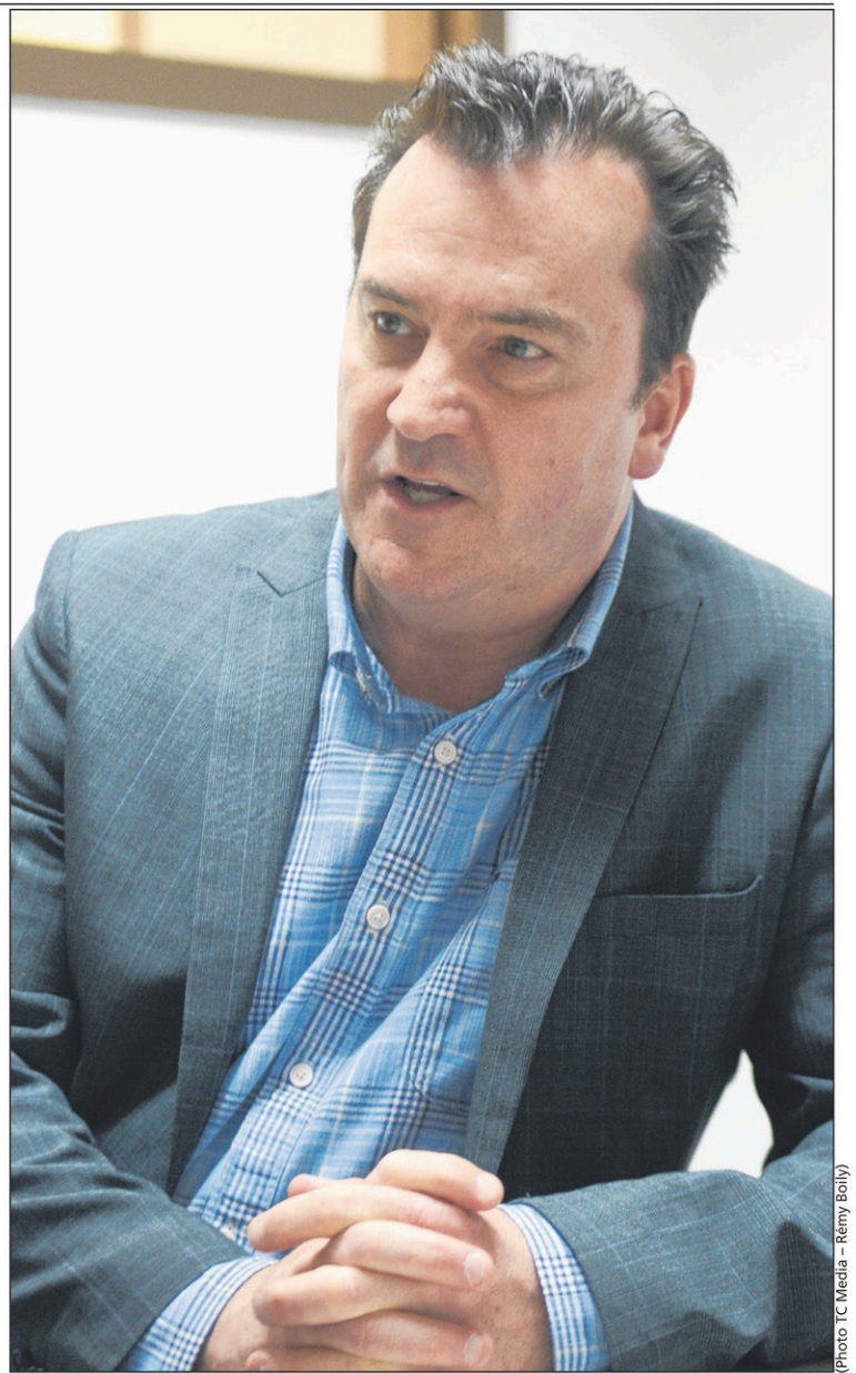
Le député Alain Therrien, porte-parole péquiste en économie, veut proposer des mesures concrètes pour alléger le fardeau administratif des PME.

Pour le député de Saint-Jean, la tournée permet de jeter les bases d'un dialogue permanent avec les entreprises.