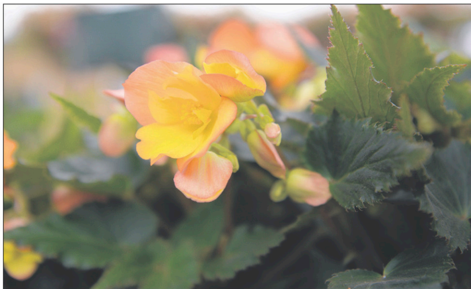
Le bégonia «Unbelievable Lucky Strike», au ton d'abricot et de pêche, fait partie de la cuvée des dix fleurs «Exceptionnelles» de l'année 2017.