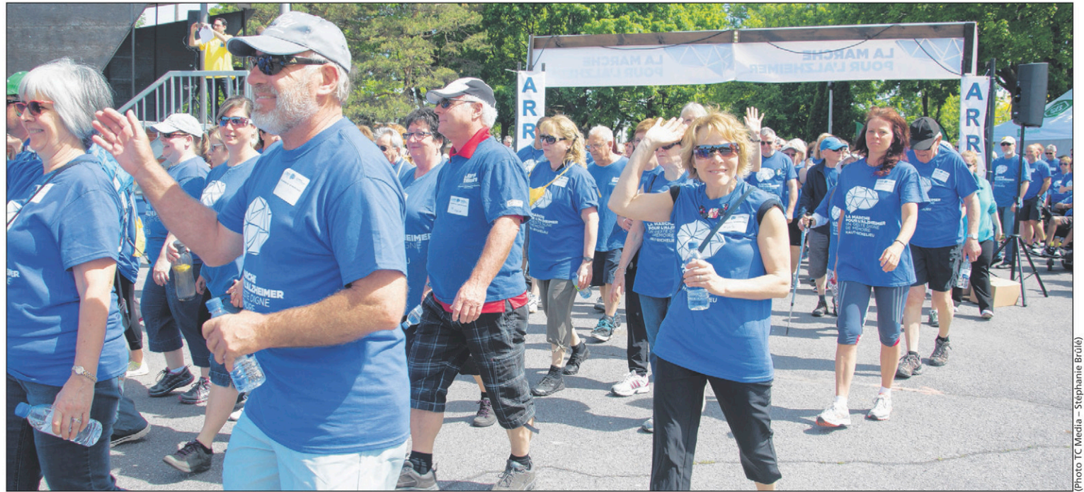
L'ambiance était à la fête dans le parc Beaulieu pour la 11 e Marche pour l'Alzheimer.

Compte tenu d'une collecte de dons qui s'est avérée plus ardue cette année, les résultats sont très satisfaisants, souligne-t-elle. «Ce sont 112 630$ qu'on va pouvoir donner à la population. La Marche pour l'Alzheimer, c'est comme une tape dans le dos