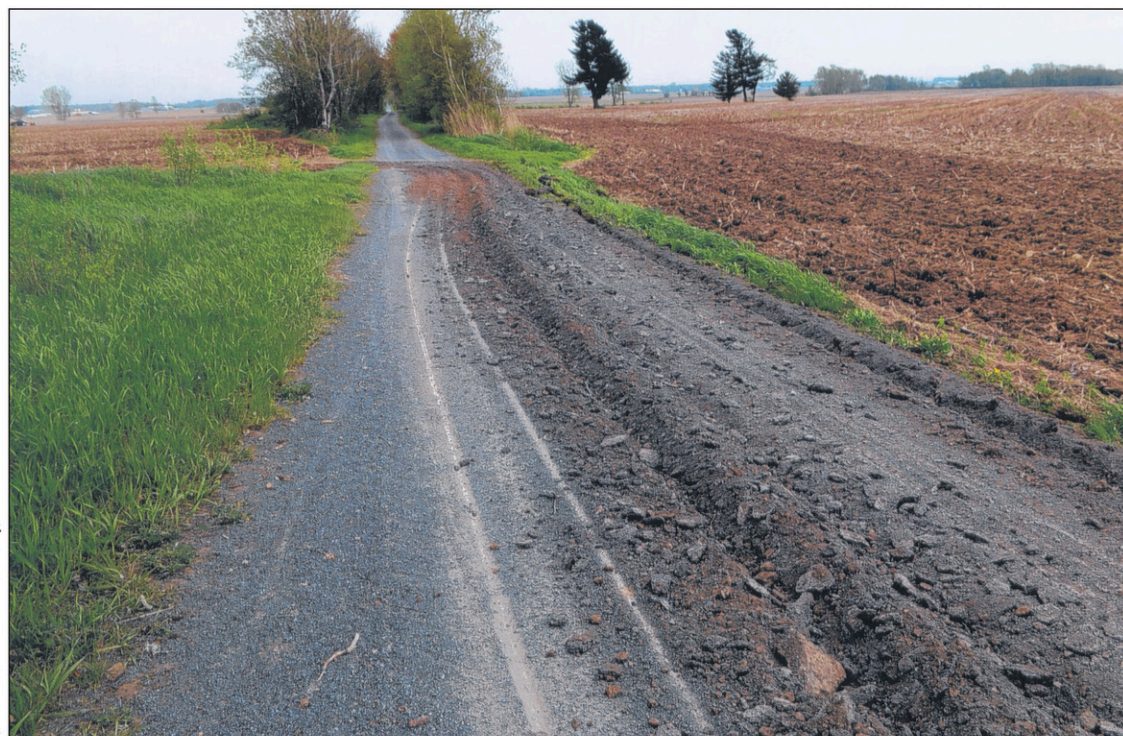
À Mont-Saint-Grégoire, un agriculteur a défoncé la piste en circulant avec sa machinerie. À l'arrière-plan, on aperçoit un tronçon de la piste comme il devrait l'être.