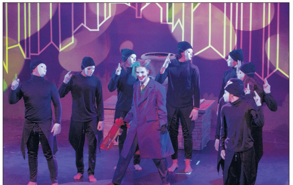
Batman devait encore une fois contrecarrer les plans du Joker et de sa bande interprétée par les finissants de l'option théâtre.