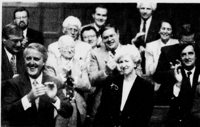
Kim Campbell a eu droit à une ovation debout de la part de Brian Mulroney et des autres membres du gouvernement, mercredi aux Communes.

ture première ministre devra choisir son personnel, former son cabinet et prendre connaissance d'une foule de dossiers concernant l'organisation de son parti.