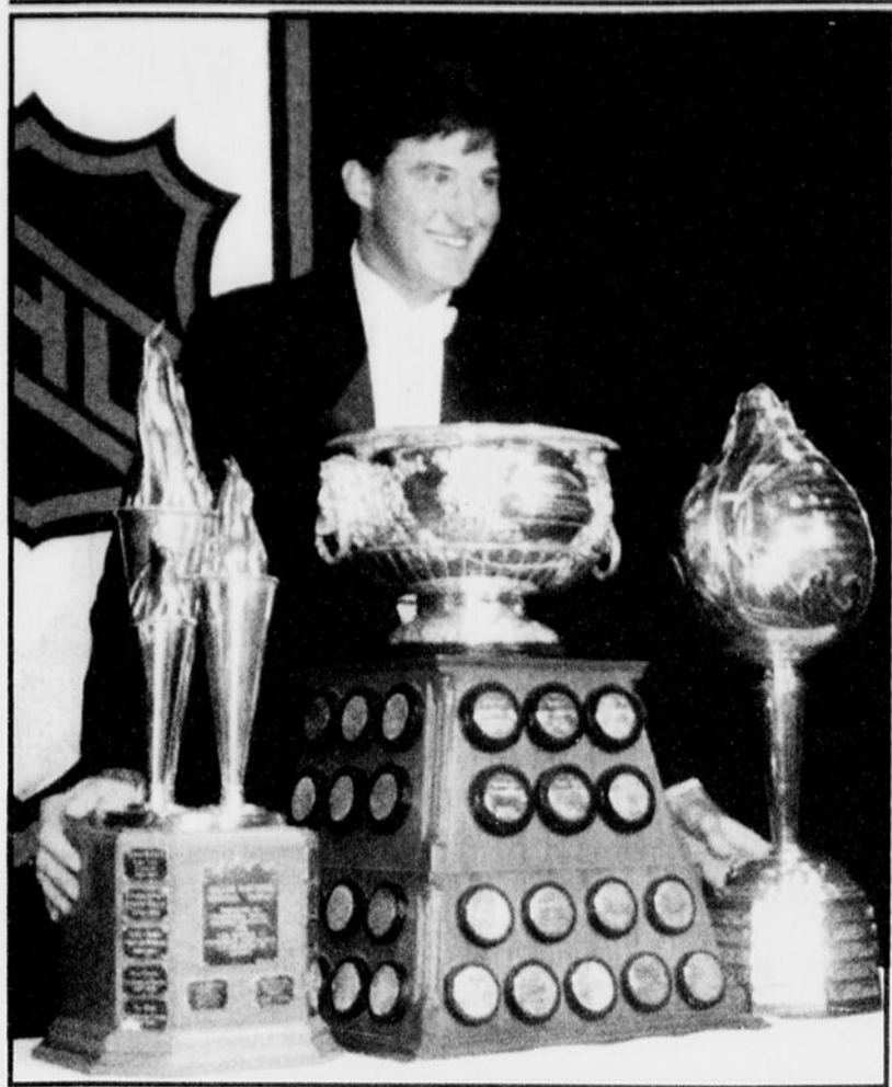
Mario Lemieux et ses trois trophées: une saison de rêve... malgré les blessures et la maladie.