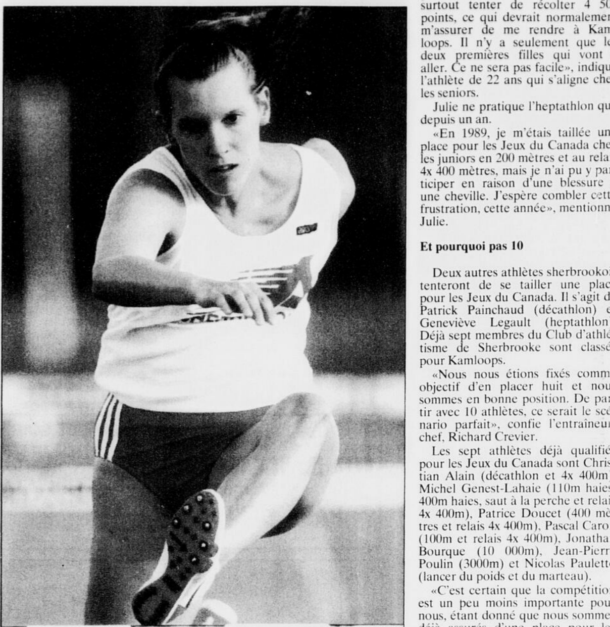
Université de Sherbrooke

«C'est sûr que j'aimerais participer aux Jeux du Canada, mais je vais surtout tenter de récolter 4 500 points, ce qui devrait normalement m'assurer de me rendre à Kamloops. Il n'y a seulement que les deux premières filles qui vont y aller. Ce ne sera pas facile», indique l'athlète de 22 ans qui s'aligne chez les seniors.