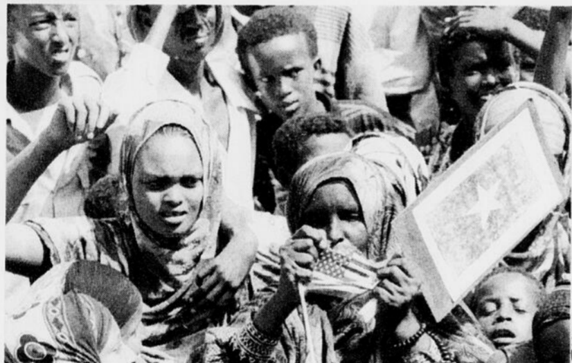
Une résidente de Mogadiscio, en Somalie, déchire un drapeau américain en guise de protestation contre les attaques des forces de l'ONU.

- Attention! La rage s'en vient. En effet, on rapporte de plus en plus de cas de rage animale dans notre région. La prudence est de mise. La