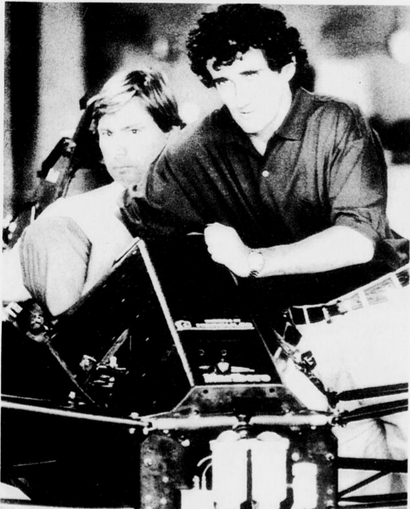
Le Français Alain Prost a remporté le Grand Prix de formule un du Canada en fin de semaine dernière à Montréal. Prost a conduit sa Renault V10 devant 70 520 spectateurs réunis au circuit Gilles Villeneuve.

- Vous voulez voir des dinosaures plus vrais que nature? Alors allez voir ce que Steven Spielberg a fait dans son dernier film, Jurassic Park. Reconstitués grandeur nature par une équipe de marionnettistes, informaticiens et techniciens de toutes sortes, les dinosaures de Jurassic Park sont saisissants. Peut-être même un peu trop pour les enfants.