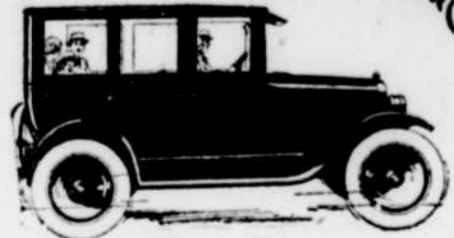
Sédan à 4 Portes Overland

Indubitablement la première parmi toutes les voitures fermées à bas prix. Quatre larges portes. Confortable pour cinq personnes. Embrayage du type à disques. Débordante de puissance. Très économique. Jusqu'à $70, meilleur marché que les voitures concurrentes.