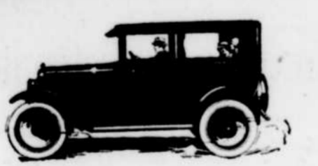
Sédan Régulier à 2 portes, Overland

Indubitablement la première parmi toutes les voitures fermées à bas prix. Quatre larges portes. Confortable pour cinq personnes. Embrayage du type à disques. Débordante de puissance. Très économique. Jusqu'à $70, meilleur marché que les voitures concurrentes.