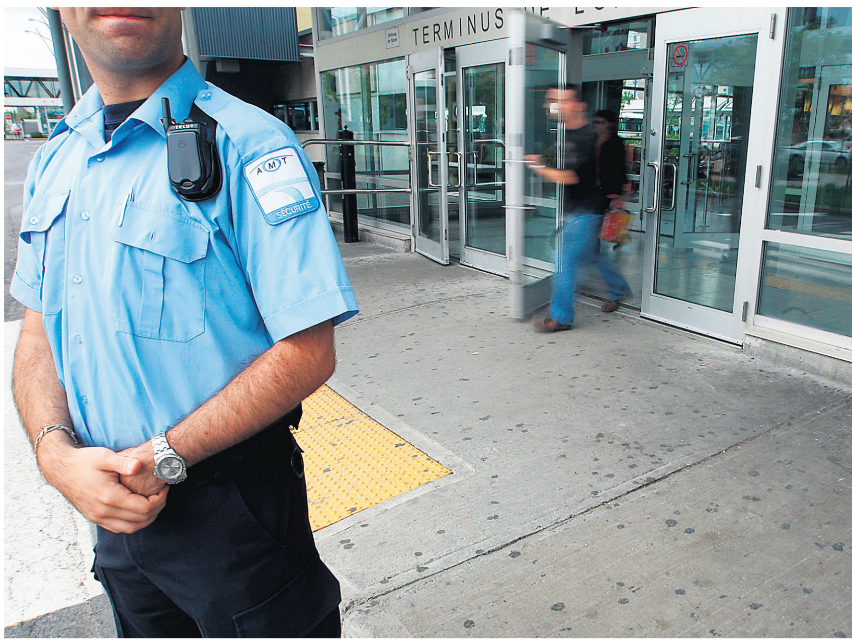
Des fugueuses se retrouvent au métro Longueuil et se font ensuite recruter par des gangs de rue, racontent des jeunes filles d'un foyer pour adolescentes en difficulté de la Rive-Sud.

Prostitution juvénile, trafic d'armes, vente de drogues et fusillades, les gangs de rue de Longueuil jouent dans la cour des grands criminels. Et ils rôdent près des foyers de la DPJ, à la recherche d'adolescentes vulnérables qu'ils recrutent comme danseuses nues. De leur côté, les élus, la police, le centre jeunesse et le Forum jeunesse de la Montérégie s'unissent dans l'espoir de tirer leurs adolescents des griffes des gangs.