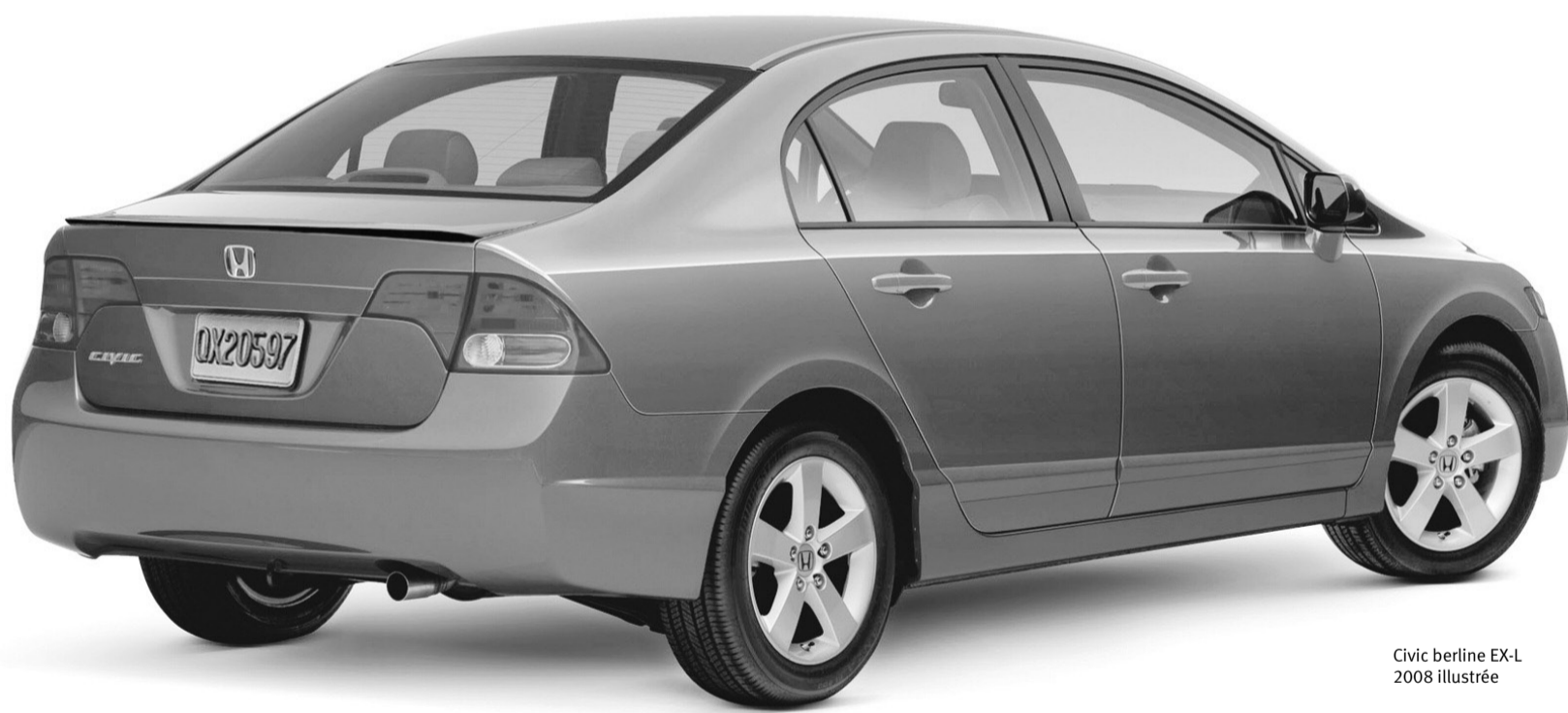
Civic berline EX-L 2008 illustrée

Véhicule le plus vendu au Canada pour une 10 e année consécutive.