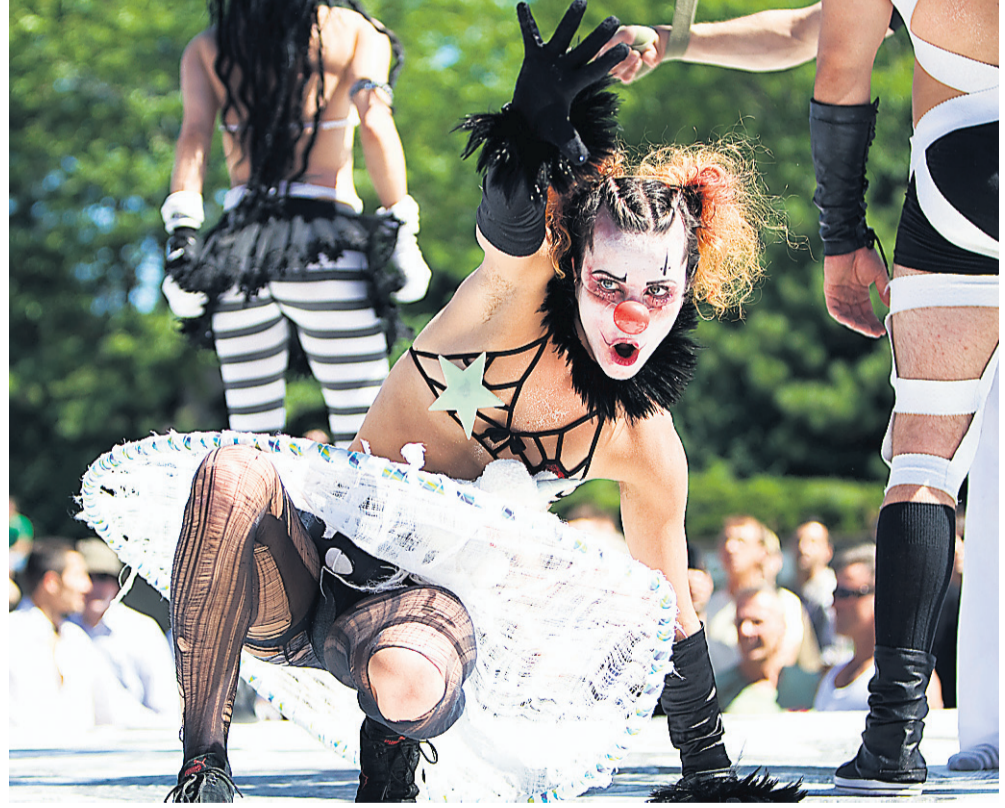
«Place au cirque!» Tel était cette année le thème du Défilé de la fierté. Les milliers de personnes rassemblées le long du boulevard René-Lévesque ont notamment vu défiler acrobates, jongleurs, magiciens, clowns et danseurs musclés en petits costumes colorés. Parmi les personnalités politiques présentes, on a remarqué le maire Gérald Tremblay et le chef du Parti libéral du Canada, Stéphane Dion.