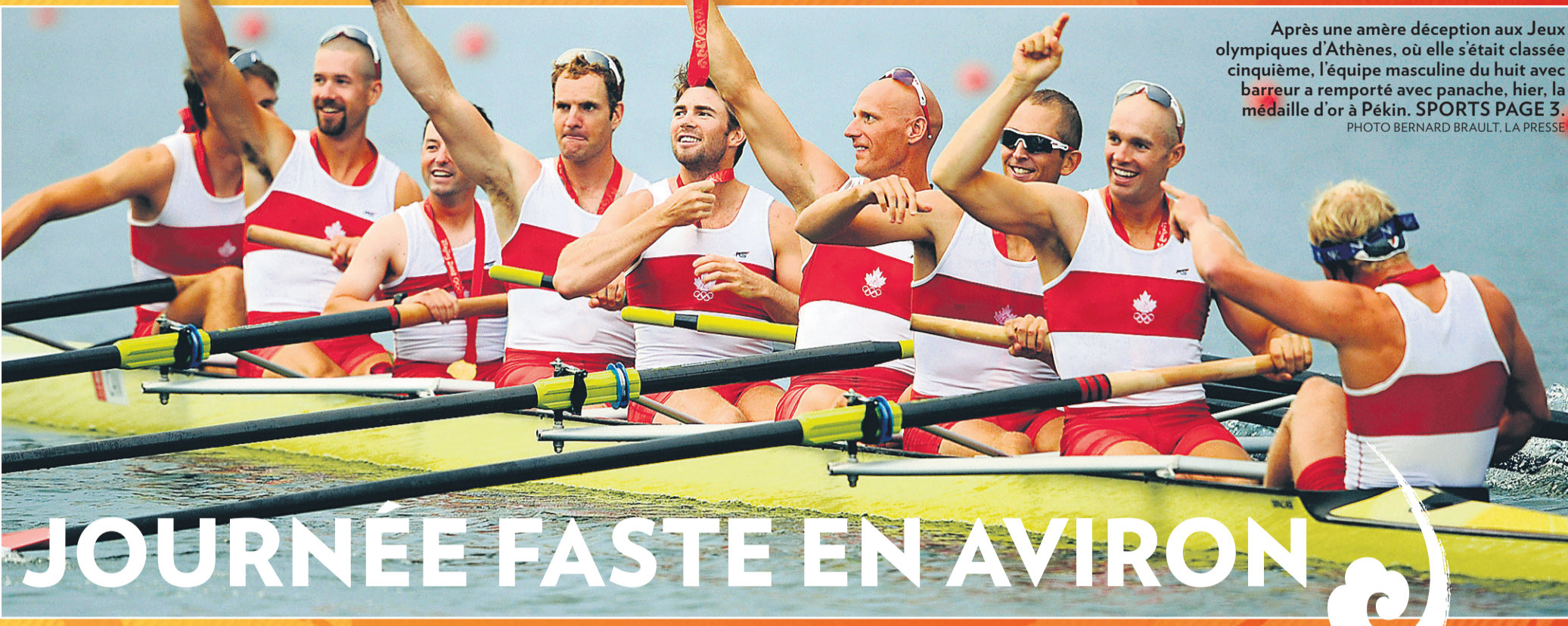
Après une amère déception aux Jeux olympiques d'Athènes, où elle s'était classée cinquième, l'équipe masculine du huit avec barreur a remporté avec panache, hier, la médaille d'or à Pékin. SPORTS PAGE 3.