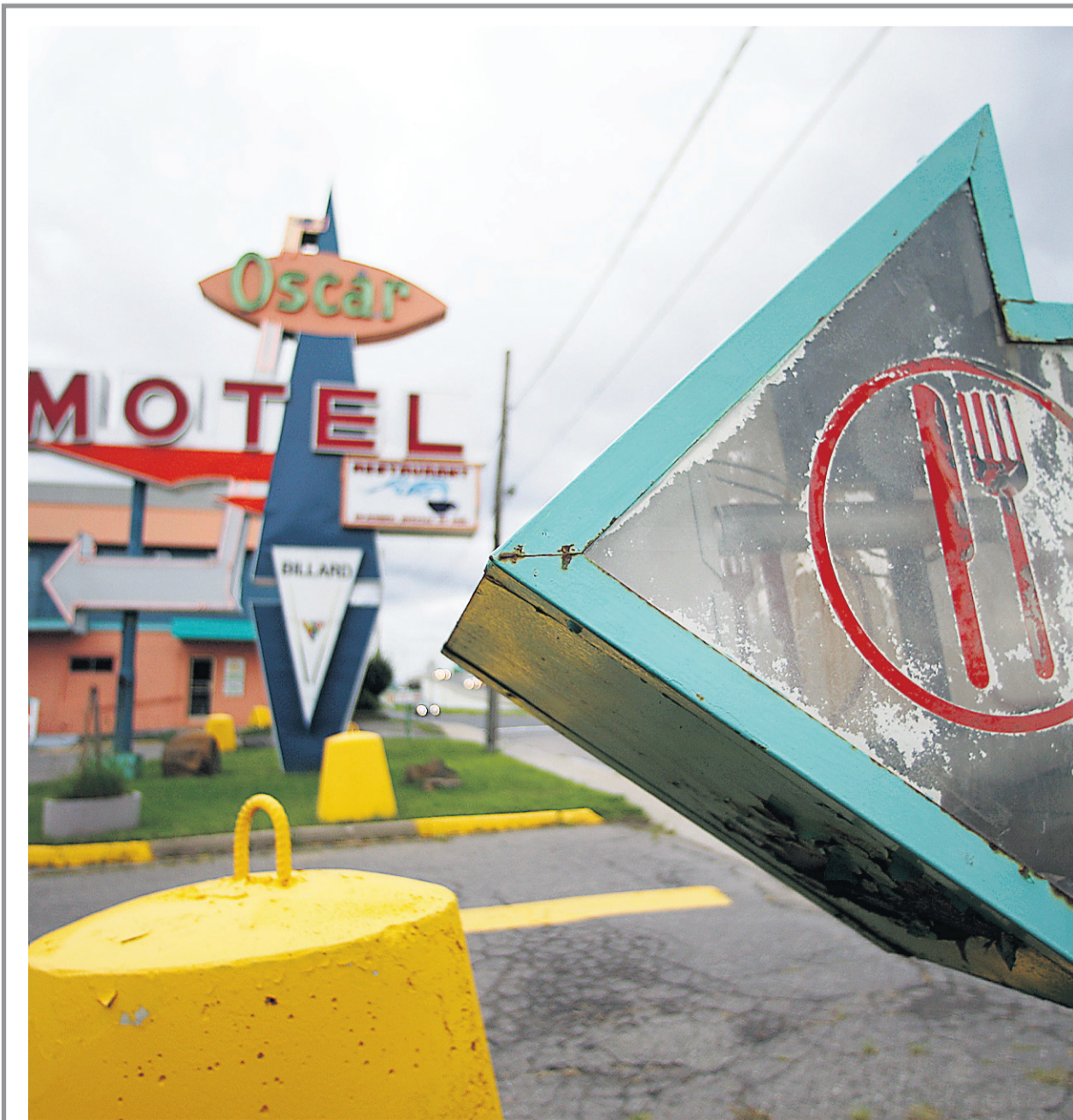
Un motel au coeur d'un quartier chaud de Longueuil.

La plupart de ces filles âgées de 14 à 17 ans ont été abandonnées par leur famille. «C'est en plein ces filles-là que les gars de gang cherchent. Des filles démunies financièrement et socialement. Les filles ont peu