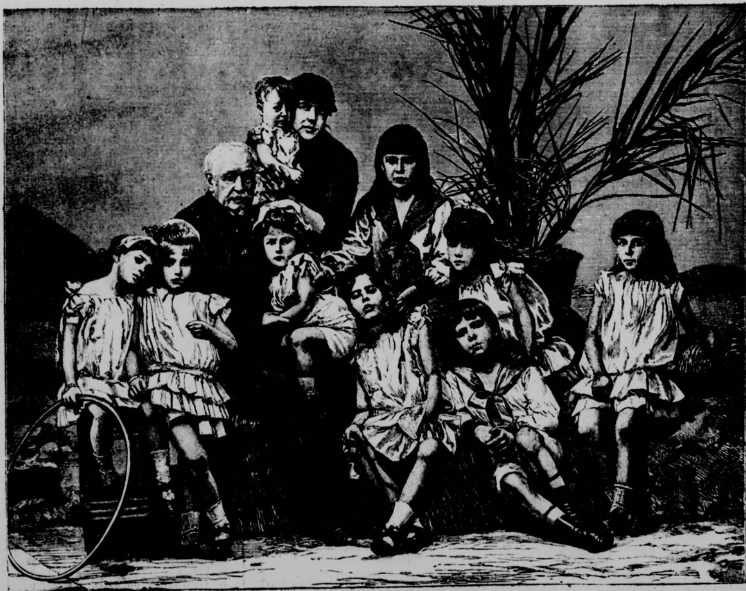
M. FERDINAND DE LESSEPS ET SES ENFANTS