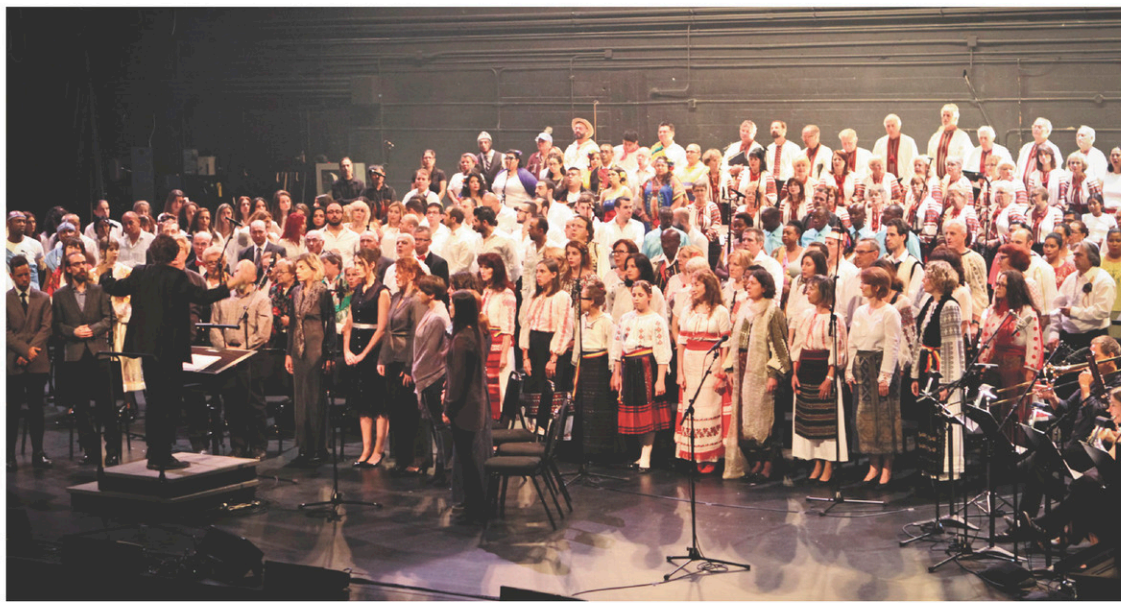
Souffles – 10 chœurs pour un chant à créer a été présenté l'an dernier à la salle Wilfrid-Pelletier de la Place des Arts lors des Journées de la culture.

«C'était touchant de voir réunies toutes ces communautés qui n'ont pas l'habitude de se fré-