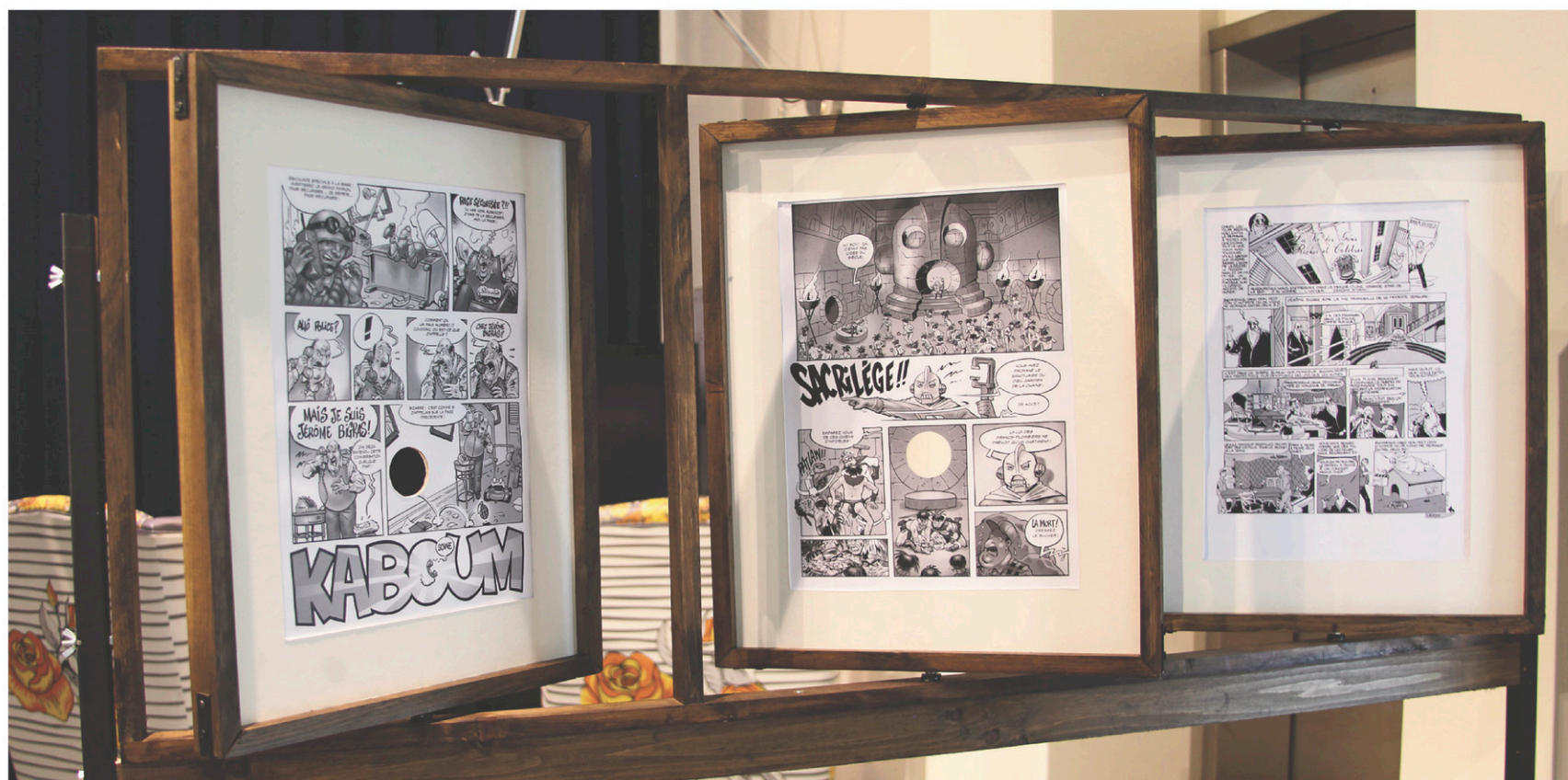
Exposition des planches de Jean-Paul Eid, auteur des célèbres aventures de Jérôme Bigras

Si le Festival BD de Montréal a réussi à bien s'implanter, c'est qu'il est venu au monde à point nommé, c'est-à-dire à un moment où le neuvième art est arrivé à une certaine maturité, au Québec, mais aussi ailleurs dans le monde. «D'une part, la bande dessinée au Québec se porte plutôt bien, nous comptons de nombreux auteurs talentueux qui sont soutenus par de solides maisons d'édition. D'autre part, la bande dessinée a beaucoup évolué.» En effet, cantonnée dans ses débuts au genre comique, elle s'en est affranchie pour aujourd'hui se diversifier et embrasser plusieurs