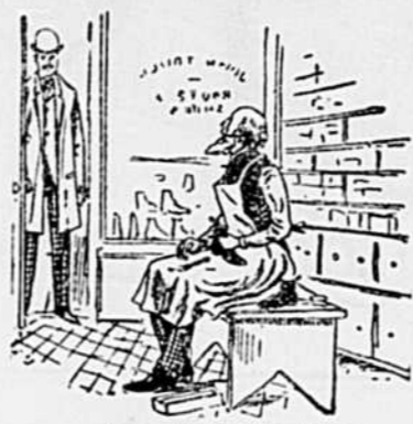
Occupé à son travail

au domicile de la personne qui avait obtenu de si merveilleux résultats.