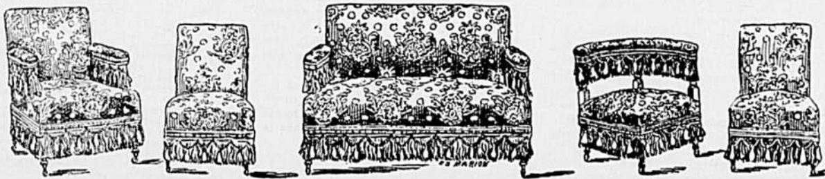
Set de salon en tapestry, garni avec frange en laine. Couleur au goût de l'acheteur, seulement $20.00, commandes par la poste exécutées promptement.

Nous donnons toujours des présents. Feuilles de modes gratis.