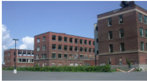
Bâtiment industriel qui fait l'objet d'une revitalisation à des fins résidentielles

La zone industrielle Est compte une trentaine d'entreprises employant actuellement près de 2 400 travailleurs. Toutefois, le nombre d'emplois y diminue continuellement. On y retrouve plusieurs vieilles industries lourdes et extensives qui confèrent à cette zone un caractère vétuste et une image d'ancienne économie. On y retrouve plusieurs grands bâtiments abandonnés et de nombreux terrains contaminés.