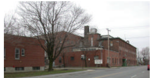
Bâtiment industriel sur la rue Victoria

Le premier secteur, le secteur Centre, est délimité au sud par les rues Notre-Dame et Victoria, à l'est par la 18 e Avenue, à l'ouest par la 32 e Avenue et au nord par les rues Remembrance et une partie de la rue Saint-Antoine entre la 20 e et la 25 e Avenue. Il regroupe environ 25 entreprises actives et plusieurs bâtiments inoccupés. On y retrouve également quelques bâtiments commerciaux vétustes comptant de nombreux locaux vacants.