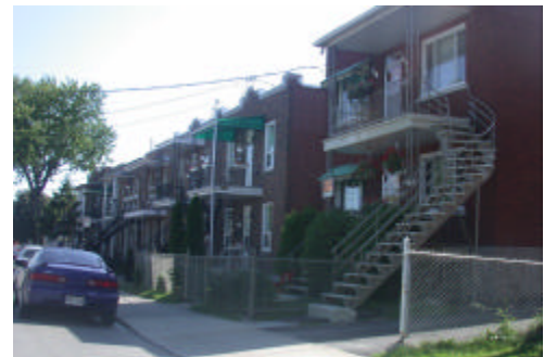
Plex des quartiers anciens

Le secteur à l'est de la 32 e Avenue et le quartier Saint-Pierre sont principalement composés de résidences multifamiliales. Plus de 83 % des logements situés dans ces secteurs se retrouvent dans des structures de type «plex» et des conciergeries.