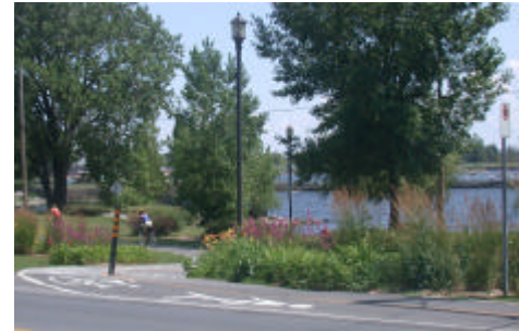
Réseau cyclable en bordure du lac Saint-Louis

À l'exception de la piste cyclable traversant le parc du Rail dans le secteur Centre, le réseau cyclable de Lachine longe uniquement les rives du canal de Lachine et du lac Saint-Louis.