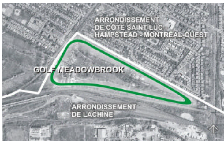
Partie du Golf Meadowbrook située à Lachine

Le golf Meadowbrook occupe l'ensemble du secteur. Ce golf, construit après la deuxième guerre mondiale par le Canadian Pacific Recreation Club of Montreal, a été aménagé de part et d'autre de l'emprise ferroviaire à l'ouest. Ainsi, la moitié du parcours est localisée dans l'arrondissement de Côte-Saint-Luc – Hampstead – Montréal-Ouest alors que l'autre partie est située dans l'arrondissement de Lachine.