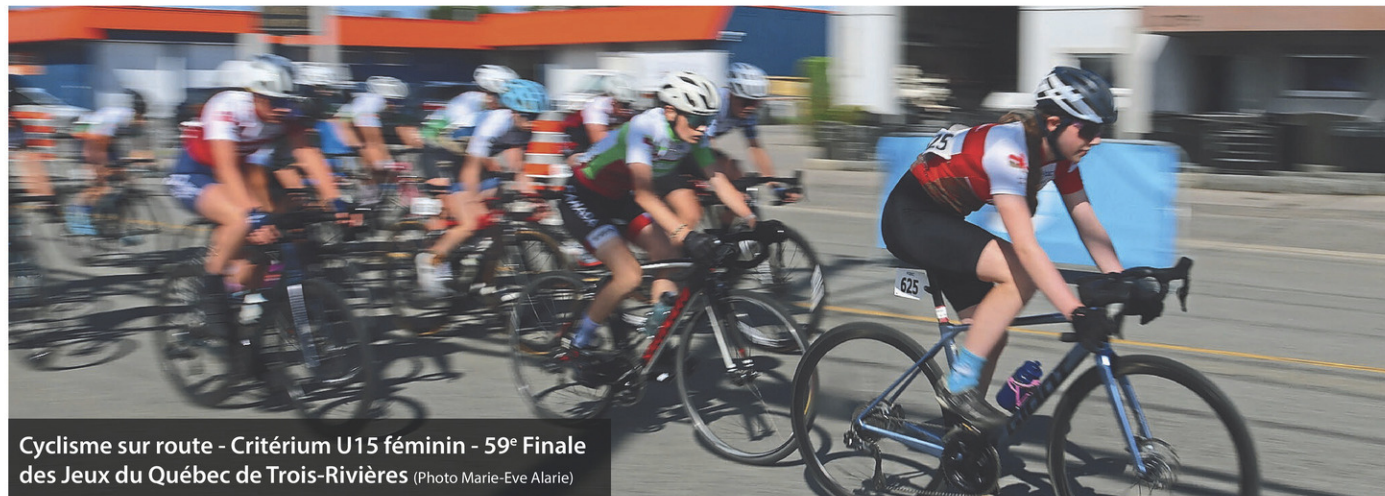
Cyclisme sur route - Critérium U15 féminin - 59 e Finale des Jeux du Québec de Trois-Rivières

L'étude évalue à 22,8 M$ la valeur ajoutée au PIB grâce à la tenue des Jeux du Québec. « Pour