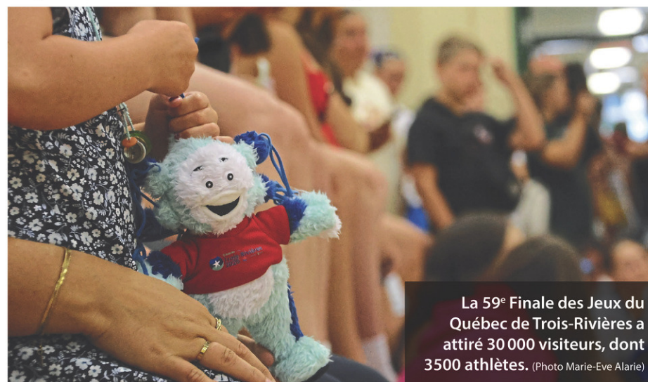
La 59 e Finale des Jeux du Québec de Trois-Rivières a attiré 30 000 visiteurs, dont 3 500 athlètes.

En parallèle, les dépenses d'exploitation pour cette 59 e Finale des Jeux du Québec se chiffrent à 9,5 M$, tandis que 11,2 M$ ont été investis dans les infrastructures. L'étude d'impact chiffre à 2,5 M$ les «fuites», soit les retombées ne bénéficiant pas au Québec.