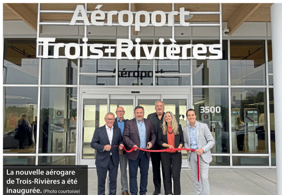
La nouvelle aérogare de Trois-Rivières a été inaugurée.

« Avec la conjoncture économique particulière, il y a un impératif de diversifier les marchés. Trois-Rivières devient un pôle majeur dans le pôle névralgique qu'est l'aéronautique, d'autant plus qu'une douzaine d'entreprises en aéronautique et d'écoles de pilotage vient renforcer le positionnement de Trois-Rivières », renchérit Jean Boulet, député de Trois-Rivières, ministre du Travail et ministre responsable de la région de la Mauricie.