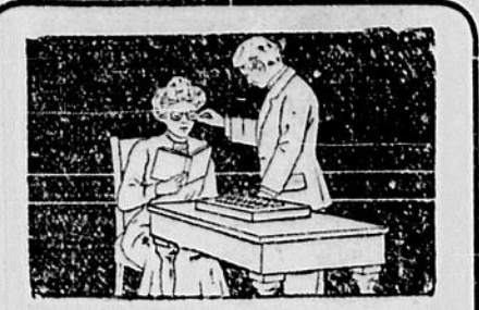
Lorsque vous avez besoin de verres

of Russia samedi a irrité les Hindous qui prétendent qu'en leur qualité de citoyens britanniques ils ont plutôt que les Chinois le droit de débarquer au Canada.