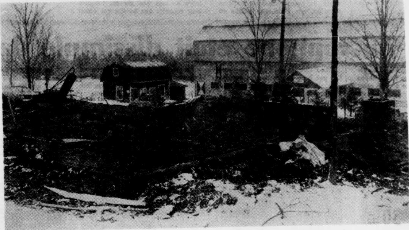
Voici ce qui reste de la maison, alors que ça fume en core.