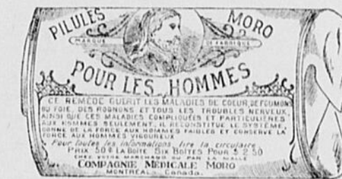
L'Etiquette est de papier blanc imprimé en bleu.

Fac-Simile exact d'une boîte de Pilules Moro.