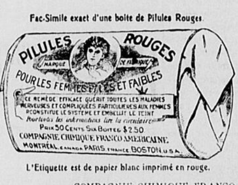
Fac-Simile exact d'une boîte de Pilules Rouges.

procure un sang riche et abondant et leur donne en même temps un surcroît de vigueur, de force et d'embonpoint.