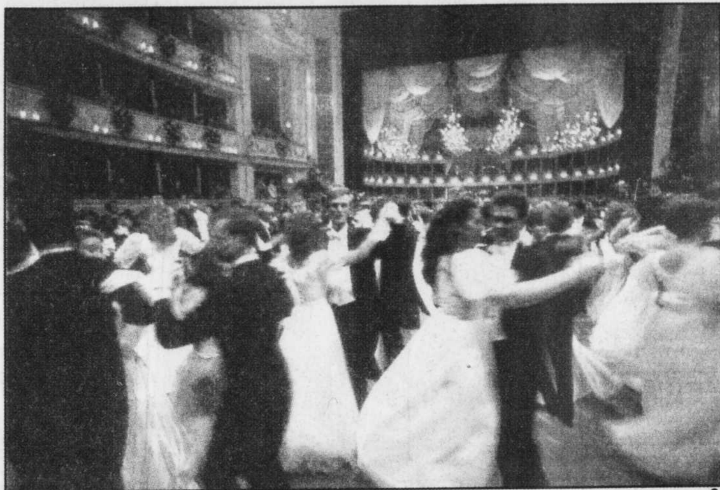
Le bal annuel, l'événement le plus couru à Vienne.

Mais il y a quelque 50 autres collections dignes d'intérêt qui seront ou-