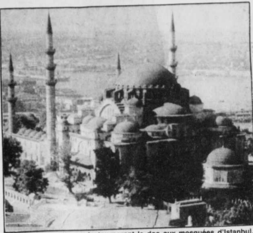
Les touristes cette année tourneront le dos aux mosquées d'Istanbul.

Quant au ministère du Tourisme, il reste quand même optimiste et estime à 4,5 milliards $ les revenus que le pays tirera du tourisme en 1994, pour 7,5 millions de visiteurs. En 1993, les revenus du tourisme avaient atteint 3,9 milliard $ pour 6,5 millions de visiteurs.