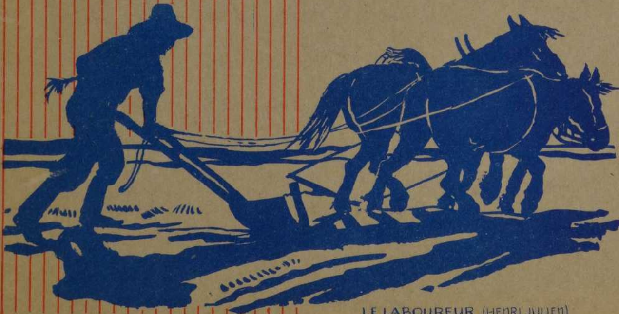
LE LABOUREUR (HENRI JULIEN)