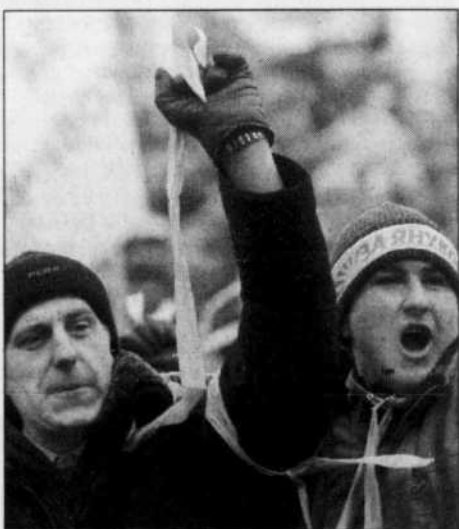
Les manifestations se poursuivent en Ukraine.

L'Ukraine est en réalité divisée en divers morceaux. C'est un pays qui, au long de son histoire, s'est trouvé entre tous les empires, ottoman, austro-hongrois, la Pologne et l'Empire russe. Les gens ont vécu sans Etat véritable, sauf lors d'une très courte parenthèse au début du XX e siècle et, en même temps, ils ont toujours été contre les pouvoirs. C'est un pays historiquement façonné pour être rebelle. Mais il a connu une destinée si tragique, avec des millions de morts, en particulier au siècle dernier — avec l'élimination de l'intelligentsia dans les années 1920, la grande famine des années 1930, la Seconde Guerre mondiale —, que la population craint par-dessus tout que le sang coule.