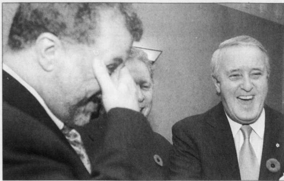
Philippe Couillard et Brian Mulroney lors des travaux de la commission Johnson-Mulroney.