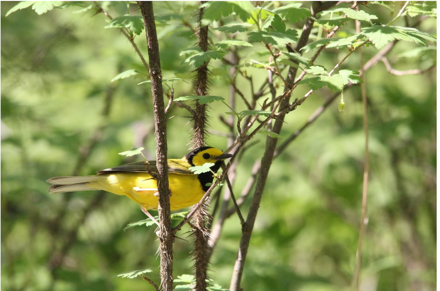
1- Les parulines de Pointe Pelée ( article dans le journal automne 2020 )