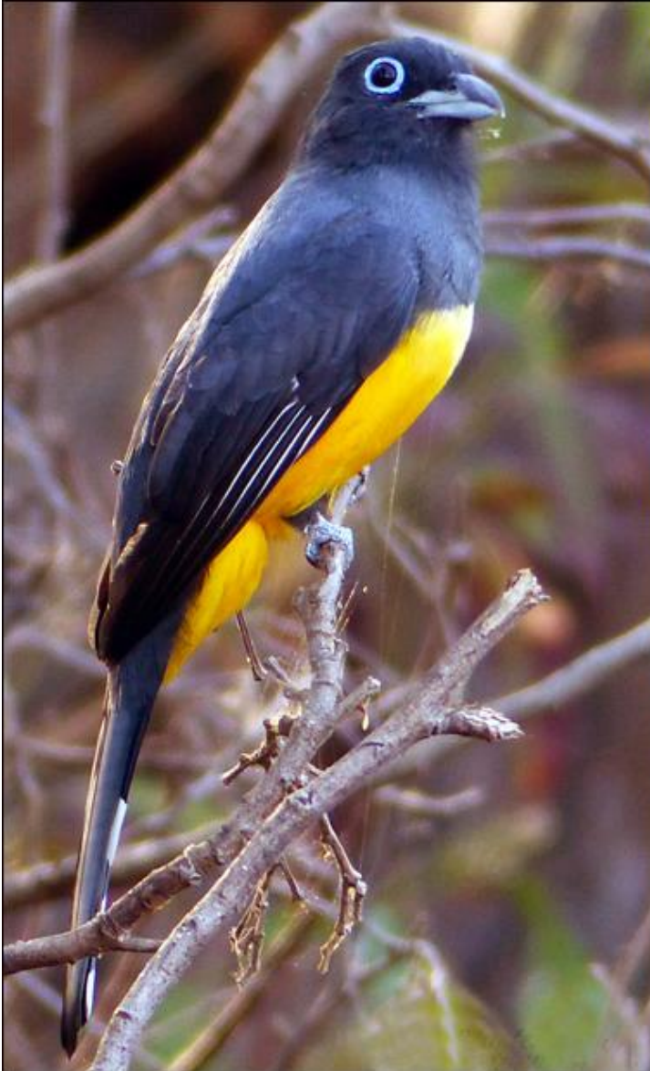
Le Trogon à tête noire ,