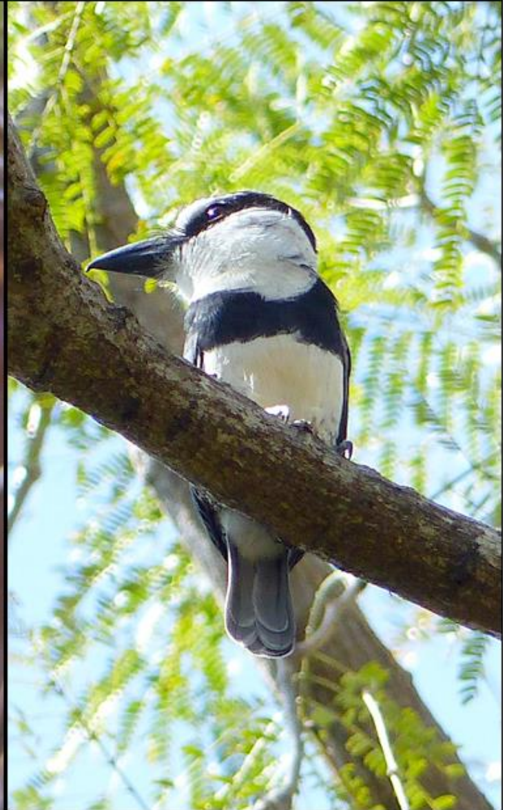
le Tamatia à front blanc