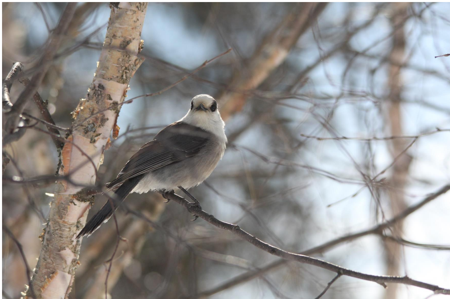
Mésangeai du Canada, Chutes St-Philippe mars 2020 ( Gilles Cyr )

LE JASEUR DES MOULINS Volume 29 – Numéro 3 printemps 2020