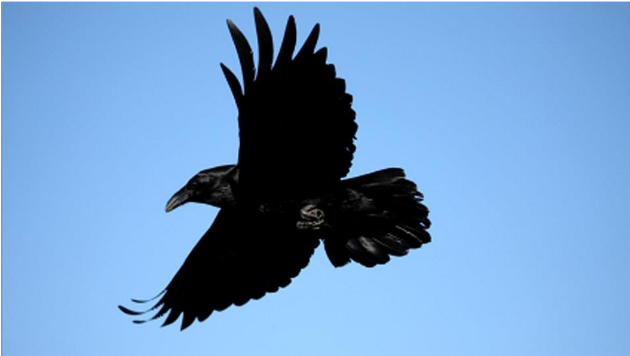
3 Le Grand Corbeau ( article de Jean-Pierre Fabien) journal automne 2020