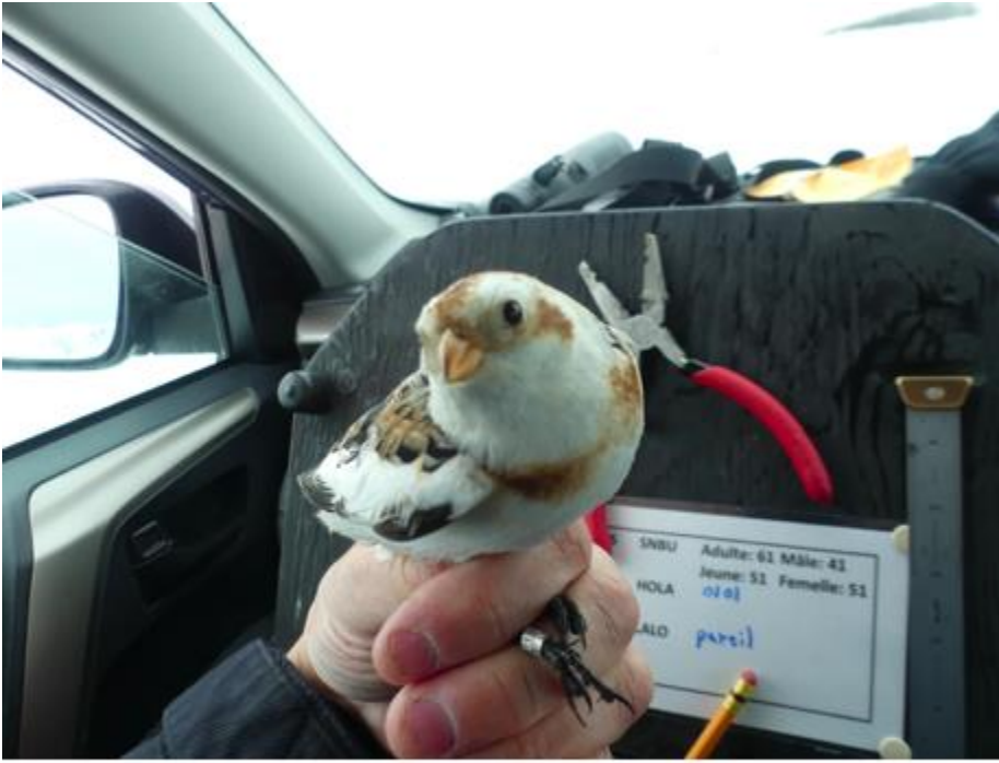
Voici le 400e oiseau bagué à St-Roch-Ouest en 2020 : un jeune mâle plectrophane des neiges

Il est toujours un peu difficile d'établir des règles de base. Habituellement un bon couvert de neige et une température basse augurent bien. Pourtant les données statistiques à St-Roch-Ouest contredisent cette hypothèse pour la saison en cours. De fait, mes plus belles prises ont été réalisées cette année par temps doux (environ 0 degré Celsius). À l'autre extrême, sous un climat glacial avec un ressenti de -25 à -35 degrés Celsius et un ciel dégagé, les visiteurs se faisaient attendre. Seuls de petits groupes venaient explorer les lieux pour de brefs instants, puis repartaient pour ne plus être revus de la matinée. Mystère!