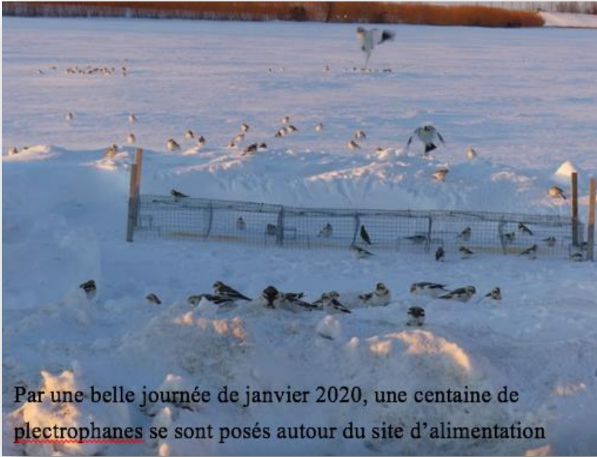
Par une belle journée de janvier 2020, une centaine de plectrophanes se sont posés autour du site d'alimentation