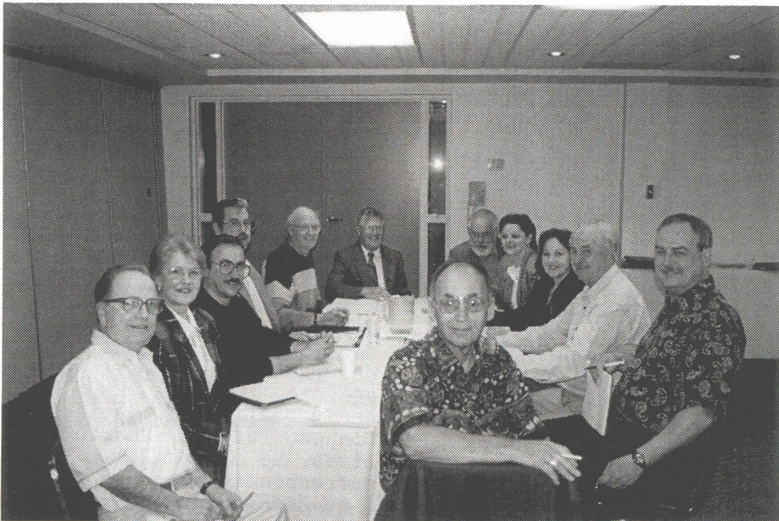
Le Conseil d'administration 1995-96

Rencontre à Montréal à l'automne: l'Association organisera une soirée rétro vers la fin d'octobre 1995 afin de favoriser la fraternité entre les membres de la grande région de Montréal.