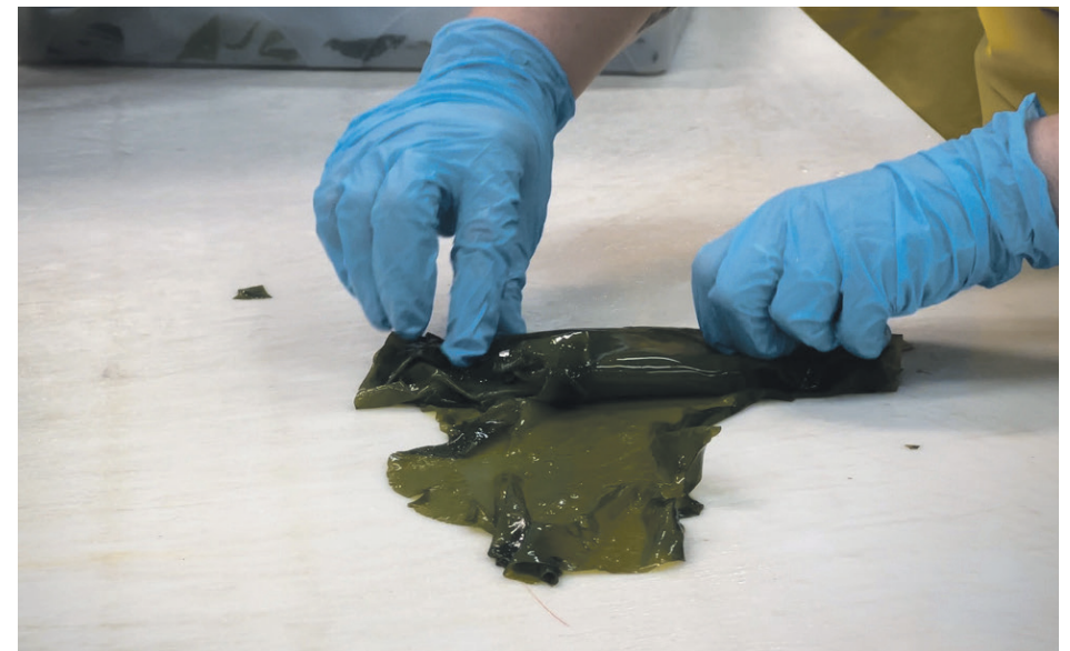
Manipulation de bioproduits marins de la Côte-Nord.

Une capsule proposant des recettes simples à faire partout, même en camping, allant à des plus sophistiquées qu'on pourrait servir en restaurant est notamment au programme.