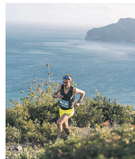
Les parcours de course en montagne sont plus longs que le cross-country.

Il ajoute également que sa préparation va bon train, et qu'il réagit bien aux dénivelés et à la chaleur qui vont l'accompagner en Espagne en septembre prochain.