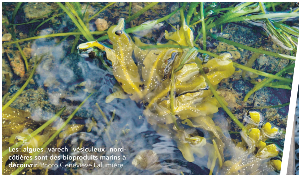
Les algues varech vésiculeux nord-côtières sont des bioproduits marins à découvrir.