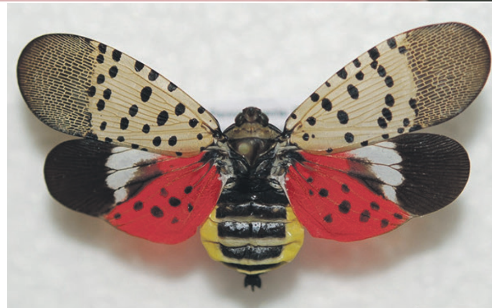
Le papillon du fulgor tacheté. Aussi joli soit-il, il doit être redouté.

En ce qui concerne les autres types d'insectes piqueurs (taon, mouche à chevreuil et autres «frappes à bord»), la donne est différente.