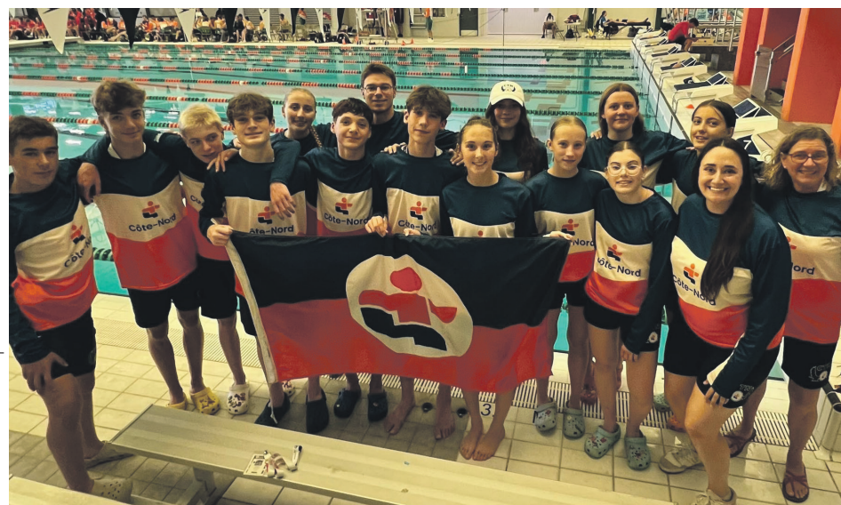
La délégation de natation de la Côte-Nord, sur la photo, a remporté une bannière d'éthique sportive tout comme celle de vélo de montagne.