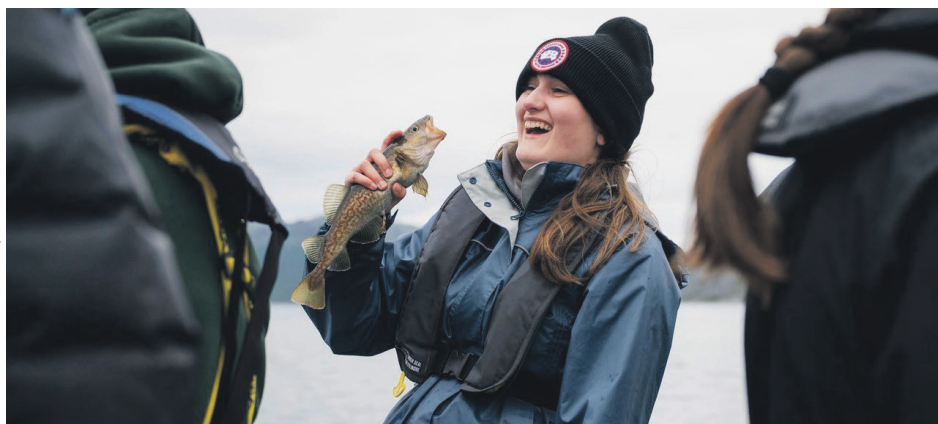
L'étudiante au Cégep de Baie-Comeau a tissé des liens d'amitié avec d'autres participants.

«N'hésitez pas à vous lancer. Ce genre d'aventure peut vraiment changer une vie. Moi, ça m'a changée», conclut-elle.