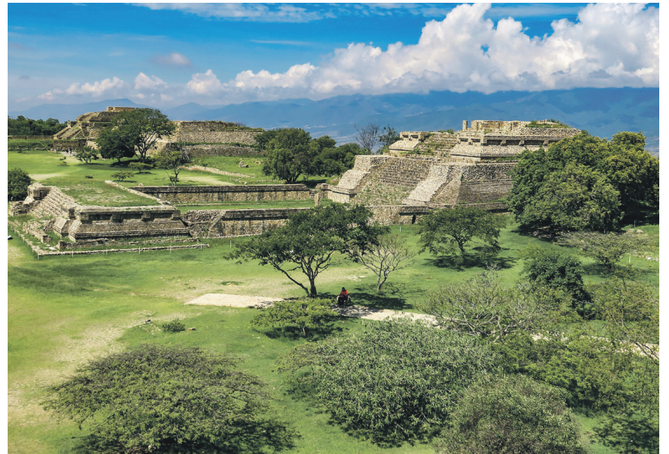
Monte Albán est un site archéologique important de la Mésoamérique situé près de la ville d'Oaxaca au Mexique.

«Éventuellement, je vais faire un algorithme qui va trier toutes les photos