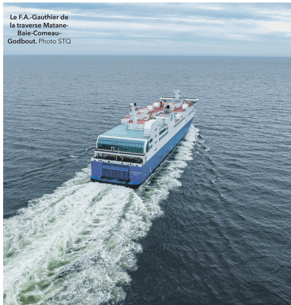
Le F.A.-Gauthier de la traverse Matane-Baie-Comeau-Godbout.

dont la vision ne semble pas dépasser les 4 ans. Dans combien de dossiers avons-nous appris que l'information était colligée depuis belle lurette : coupure de services dans les soins de prévisible etc, etc, etc. Comment peut-on en arriver à faire fi de toute cette information disponible et préférer administrer une conti-