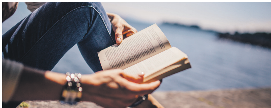
Lire un livre d'un auteur de la Côte-Nord dans un paysage de la Côte-Nord, c'est encore mieux!

a la cote auprès des touristes, je l'ai vu défiler à de nombreuses reprises sur mes réseaux sociaux. Plusieurs l'ont utilisé comme guide touristique, mais on peut aussi y découvrir une véritable lettre d'amour de l'auteur pour sa région d'adoption.