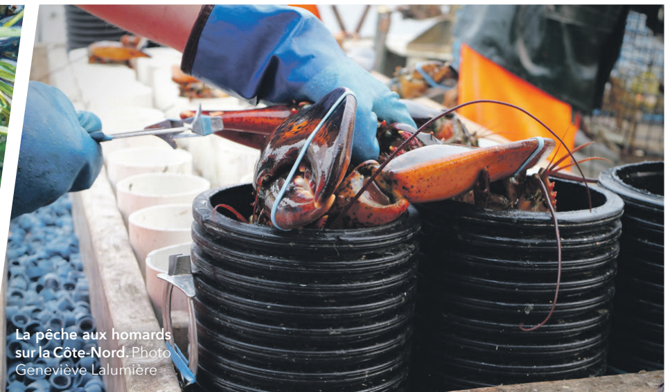
La pêche aux homards sur la Côte-Nord.