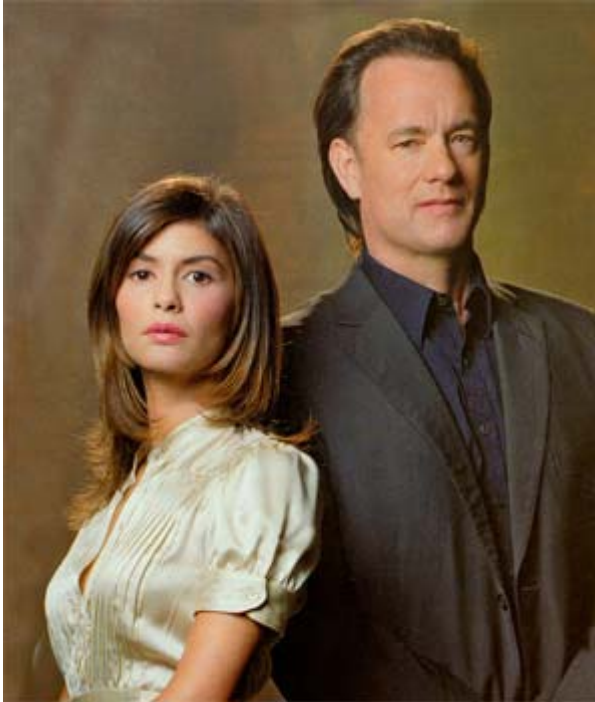
Audrey Tautou et Tom Hanks