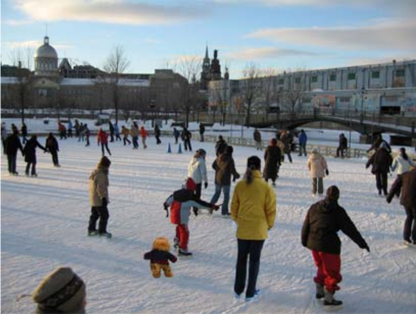
La mascotte Monsieur X et mademoiselleX sur la patinoire du Vieux Port de Montréal

«Rien au monde ne rend le bonheur inaccessible que le fait de se lancer à sa poursuite.»