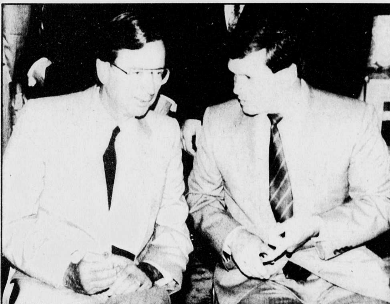
Le premier ministre Robert Bourassa s'est entretenu avec son homologue du Nouveau-Brunswick, Frank McKenna, hier, juste avant le début de la rencontre officielle des dix premiers ministres provinciaux du Canada.

"D'abord, les réserves de la Banque du Canada se chiffrent à 16 milliards $; le taux d'inflation