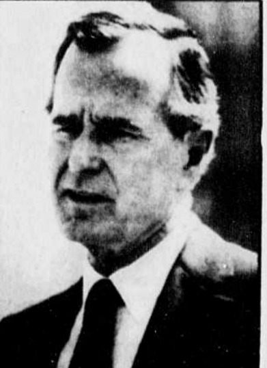
Le vice-président George Bush

A cet égard, le candidat républicain s'est déclaré prêt à poursuivre les négociations avec l'URSS sur la réduction des ar-