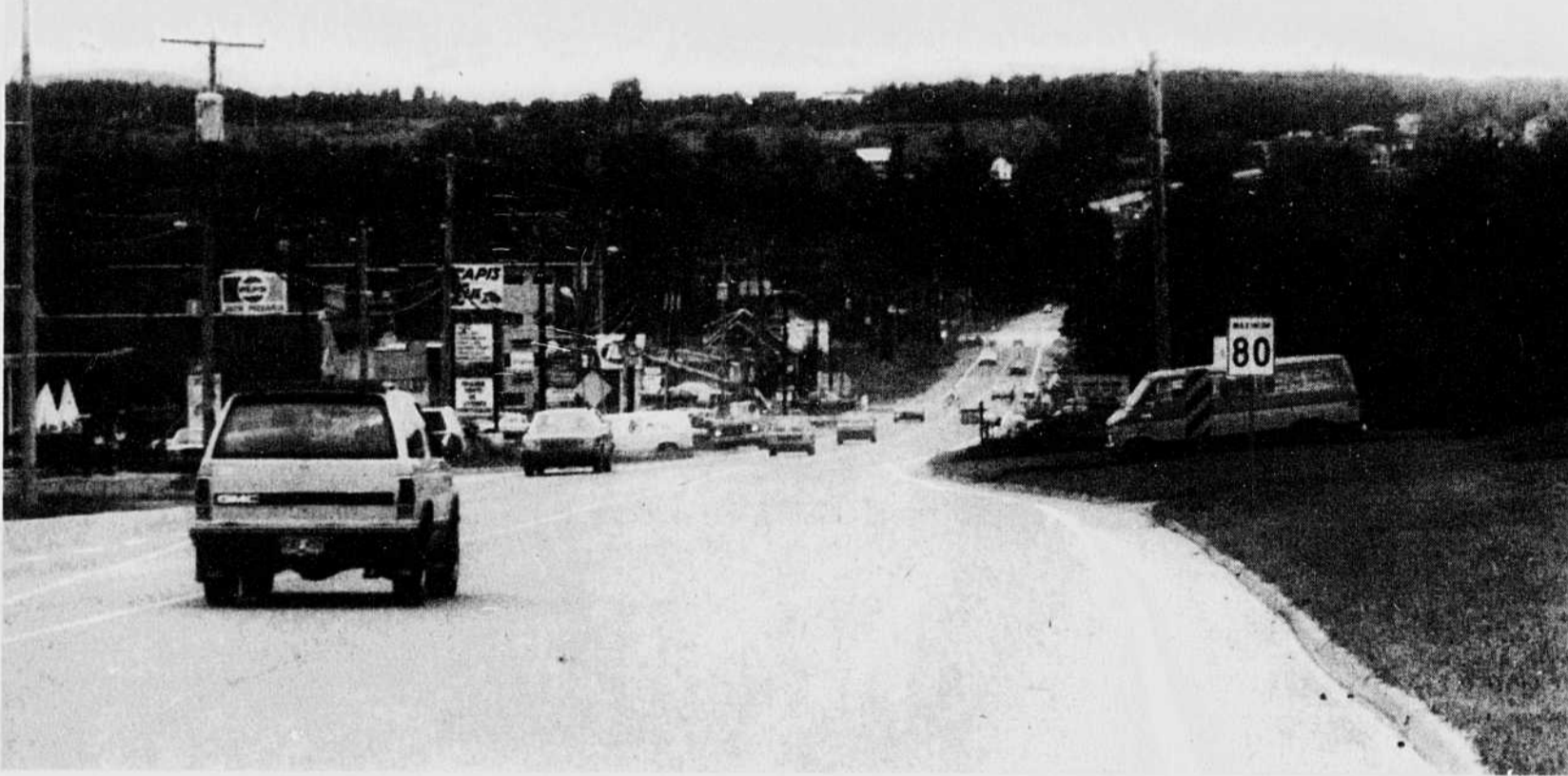
La route 220 à St-Élie-d'Orford. Elle a considérablement changé ces dernières années; pour la prospérité de tous les citoyens, mais ces derniers risquent gros.

"Je ne dis pas cela pour trouver un coupable. Je le dis parce que comme cycliste, je sais que c'est extrêmement dangereux, rouler dans le noir."