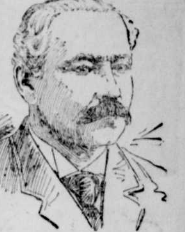
L'hon. JOHN COSTIGAN, M.P. Le père de la Chambre des Communes

Ottawa, 22 avril. Une députation de commis de malle est venue hier, demander à sir William Mulock.