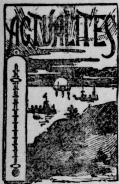
Belle journée aujourd'hui.

Les conservateurs se demandent, depuis 15 heures : "où est Gamsy?"