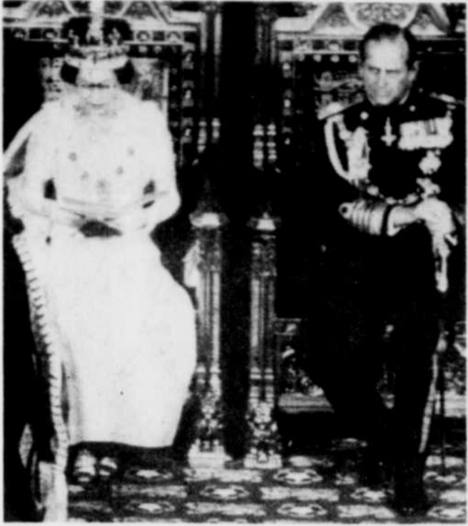
La reine Elizabeth II a lu hier le discours du Trône annonçant les nouvelles mesures économiques de Mme Thatcher, tandis que son mari, le duc d'Edimbourg, l'écoutait.