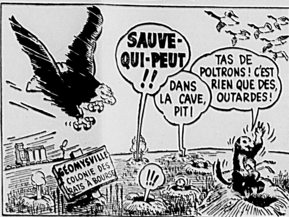
Voici l'une des "chaînes alimentaires" grâce auxquelles la Nature maintient l'équilibre entre les animaux et les plantes. Avant de chasser ce que vous prenez pour un féau, pensez à son importance pour vous. N'oubliez pas qu'une nature équilibrée est une nature primitive.

Nature Primitive - A VOUS D'EN JOUIR - A VOUS DE LA PROTÉGER