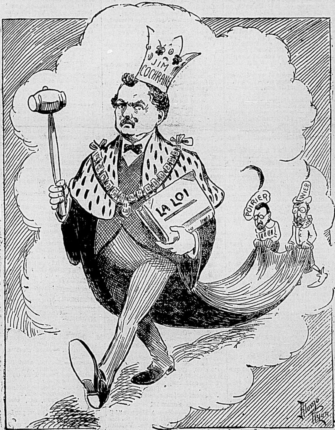
JIM. — La loi, c'est moi.