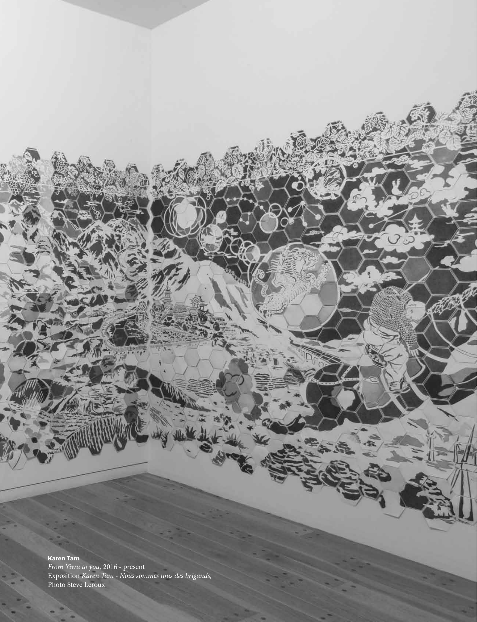
Karen Tam From Yiwu to you , 2016 - present Exposition Karen Tam - Nous sommes tous des brigands , Photo Steve Leroux