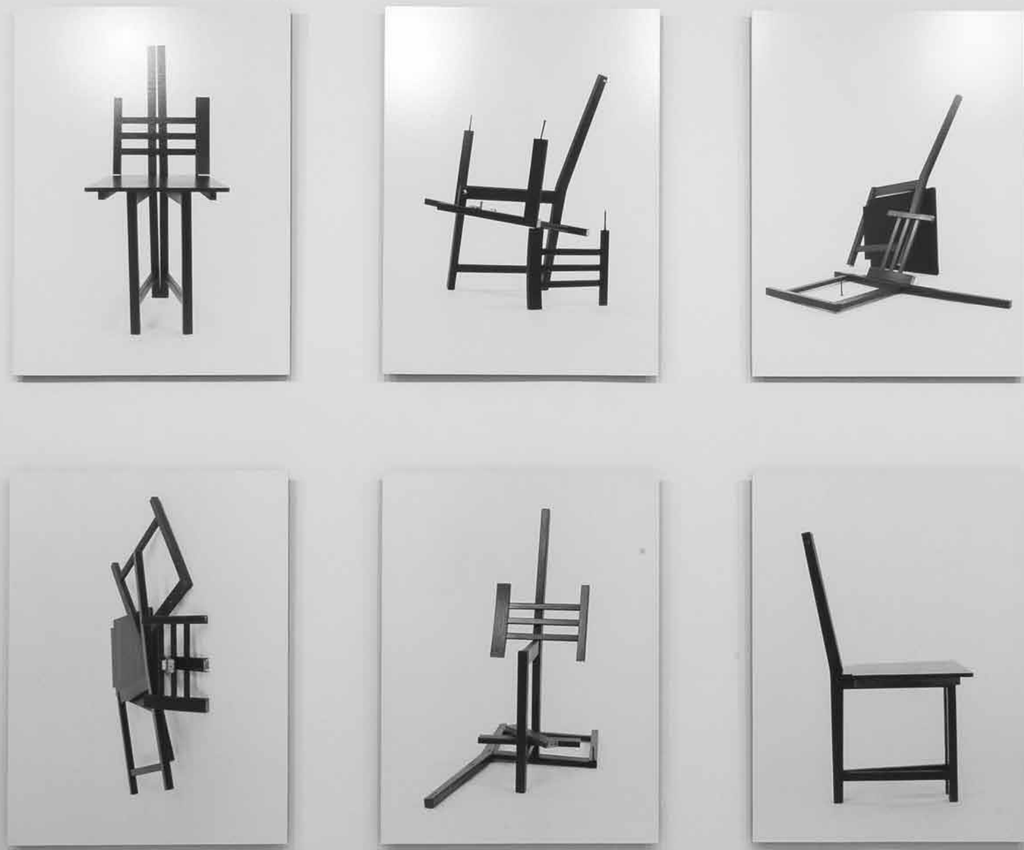
Jacinthe Lessard-L Two-Minute Sculptures (détail), 2005 Exposition La Chose en soi Collection du Musée régional de Rimouski